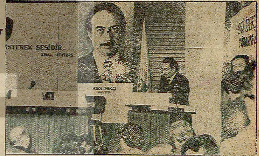
"Türkiye'de Anarşi" konulu Abdi İpekçi Seminerinde Çağlayangil ve Kuntay'dan sonra CHP Genel Başkanı Ecevit de bir konuşma yaptı.

(*) Bu sektöre karaborsa, aracılık yollarıyla elde edilen gelirler de dahildir.