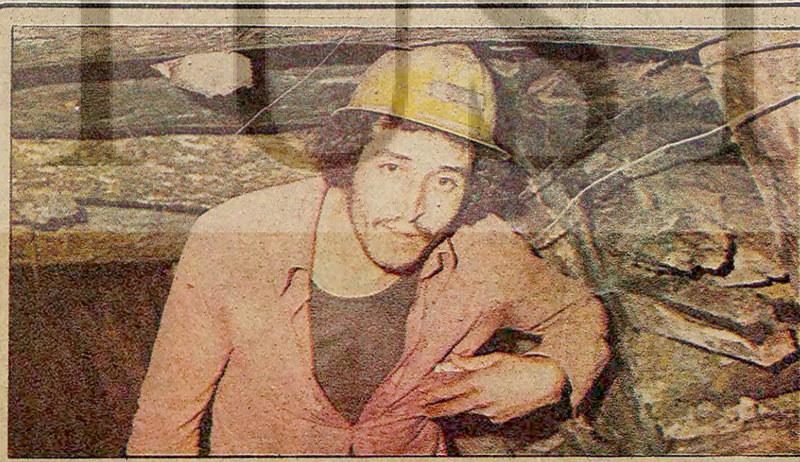
Yayınımız üzerine ilgililer harekete geçti

"Biz, aşağıda imzaları olan Orta Doğu Teknik Üniversitesinde öğretim üyeleri ve yardımcıları, bağılantı ülkelerin çeşitli Birleşmiş Milletler organlarına sundukları karar tasarıları, BM Güvenlik Konseyi'nin 2 aleyhte oya karşı, 13 lehte oyu, BM Genel Kurulu'nun 18 aleyhte oya karşı, 104 lehte oyu ve geniş dünya kamuoyunun vicdanı yargısına doğrultusunda, Sovyetler Birliği'nin Afganistan'ın işgal etmesini kınıyor ve Sovyet askerlerinin Afganistan'ı derhal terketmelerini talep ediyor." (Devamı sav. 7 s. 3'de)