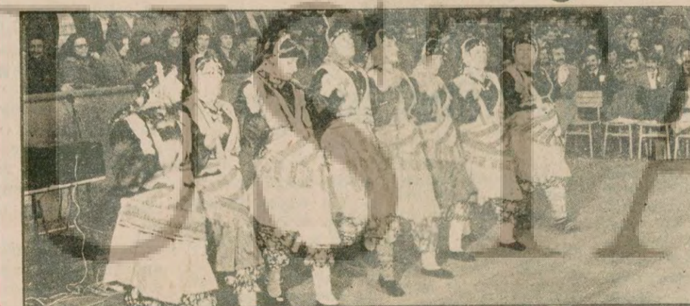
Kongreye Anadolu'nun sesini havasını, kokusunu taşıyan folklor ekiplerinden biri