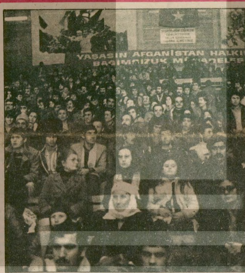
"Deryayı taşıracağız, Atatürk Spor Salonunu dolduracağız". TIKP Genel Başkanı Doğu Perinçek, kongrenin ikinci gününde Derya sinemasında böyle diyor ve Ankara halkını Atatürk Spor Salonuna çağırıyordu. Gerçekten de ertesi gün, Türkiye'nin dört bir yanından, Ankara'nın her semtinden gelen binlerce kişi Atatürk Spor Salonunu hızla doldurmuştu.