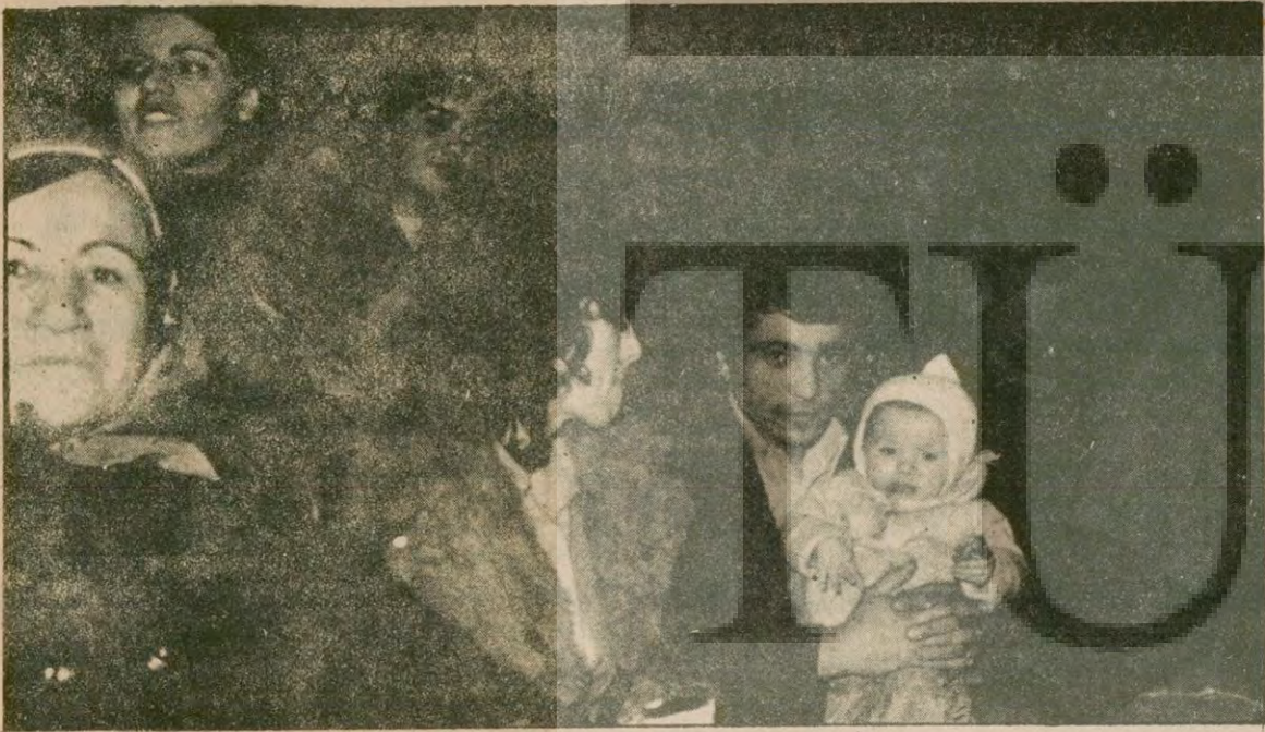
Analar, babalar, çocuklar

TIKP Birinci Genel Kongresinin birinci gününde çalışmalar başlamadan hemen önce davul zurnalarla sahneye gelen Van Folklor ekibi kongreyi coşturdu. Az sonra başlayacak olan kongrede heyecan bir kat daha arttı.