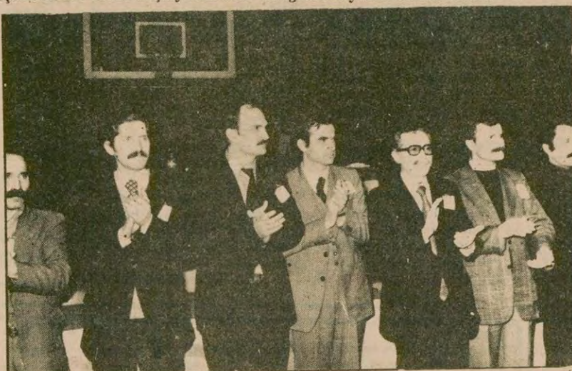
Merkez Komitesi adayları,

Dizinin "Doğan sarıdığı gün" adlı bölümünde Lassie sağı çocuklar ile birlikte depreme uğrar.