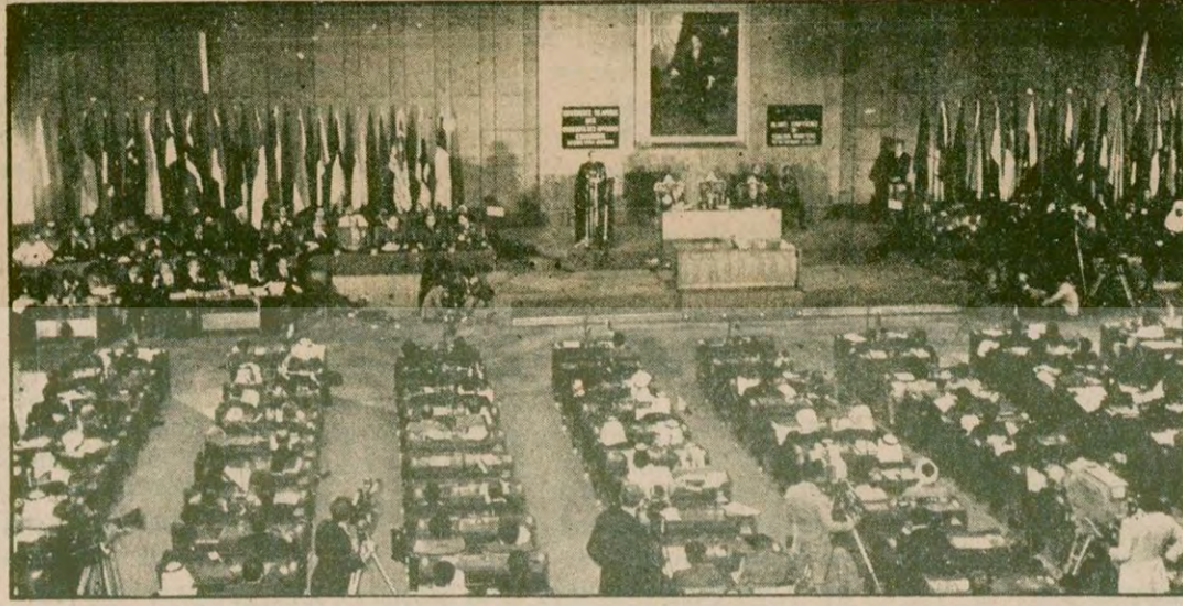
Pakistan Devlet Başkanı General Ziya Ul-Hak İslam Konferansının açılış konuşmasını yaparken

Nuri Çolakoğlu bildiriyor SLAMABAD'da yapılan İslam Ülkeleri Konferansı sonunda kabul edilen kararda Rusya'nın Afganistan'a