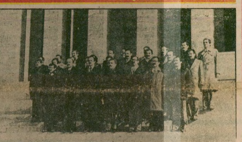
TIKP Merkez Komitesine seçilen üyeler, görev bölümü yaptıktan sonra Anıt-Kabir'e giderek saygı duruşunda bulundular. Fax: AKAJANS