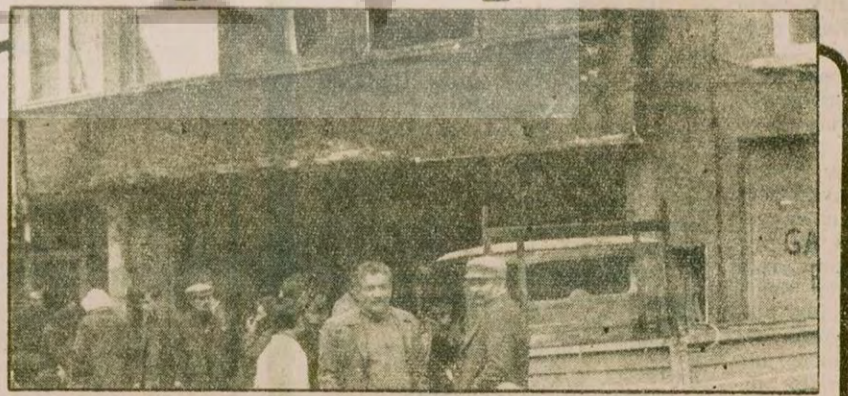
Dün İstanbul'da ateşe verilen 4 bankadan biri, Garanti Bankası Topağacı şubesi.