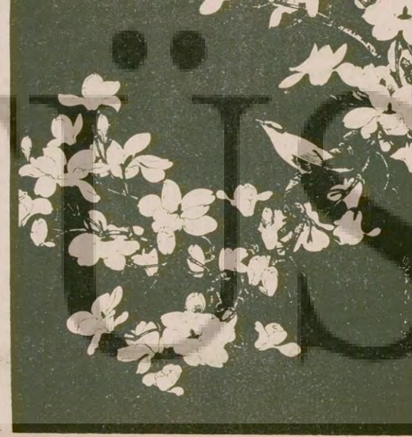
Sergide yer alan resimlerden biri.

Üçüncü kez ve üç aylık olarak çıkarılması tasarlanan Papirüs dergisi, edebiyat çevrelerinde ilgiyle bekleniyor.