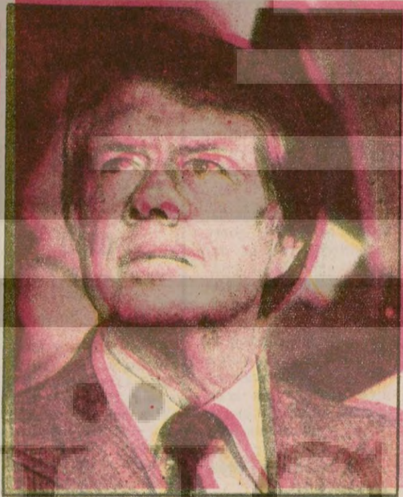
ABD Başkanı Carter, Afganistan'daki Rus işgalinin İkinci Dünya Savaşı'ndan bu yana dünyaya barışını tehdit eden en ciddi girişim olduğunu söyledi.

İngiltere Dışişleri Bakanı Lord Carrington Rusya'nın Afganistan'ı işgal etmesine karşılık olarak, hükümetinin Rusya ile Bakanlık düzeyindeki her türlü teması durdurma kararı aldığını açıkladı. Öte yandan, AP ajansının haberine göre, Türkiye İslam Konferansında (Devamı Sa. 7, Sü. 1'de)