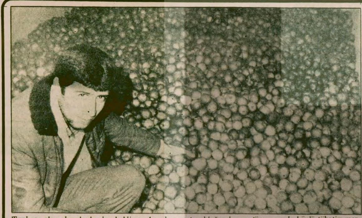
Tonlarca elma depolarda alıcı bekliyor. Ancak mazot yokluğundan ne tüccar ne de köylü tüketim merkezlerine götürebiliyor.

Değindiğim tüm olayların meydana gelmesinde esas neden, bu alanda yetişmiş uzman elemanların yeterli sayıda olmamasıdır. Kuduz konusunda bilgi birikimleri değerlendirilerek, bu alanda uzman elemanlar acilen yetiştirilmelidir."