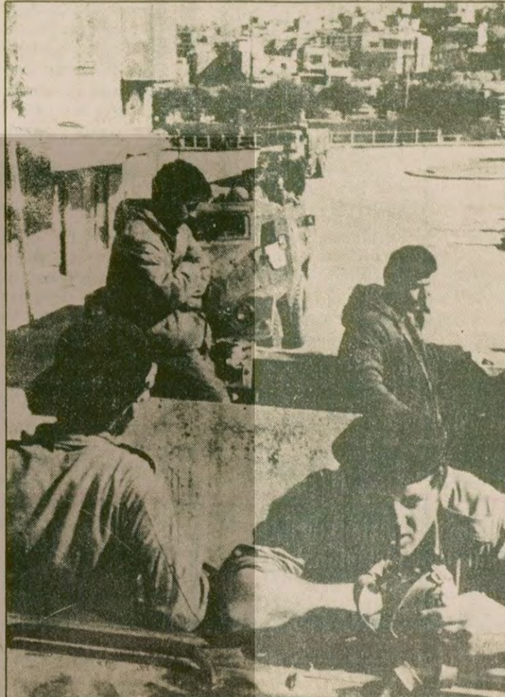
Mısır-İsrail barış anlaşması uyarınca, İsrail askerleri Sina'dan çekiliyor. Fotoğrafta işgal edilmiş topraklarda devriye gezin bir silyonist birlik görülüyor.