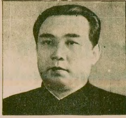
Kore Demokratik Halk Cumhuriyeti Devlet Başkanı Kim Il Sung.