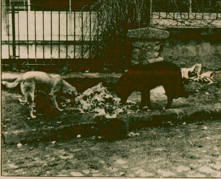
Ortada başıboş gezen köpekler için etkili önlemler alınmadığı sürece kuduz hastalığı da tehdit oluşturmaya devam edecek.

Kuduz olayları görülen Konya, Ağrı ve Çorum'da bazı yerleşim merkezleri karantinaya alındı