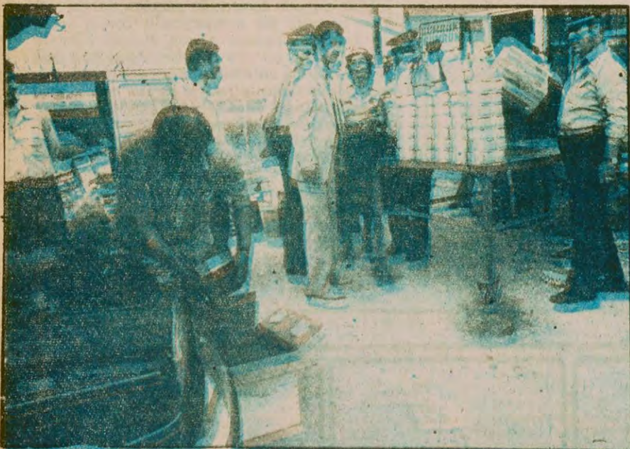
Büyük patronlar genellikle "Esnaf işi" yaparlar. "Esnaf işi" silah ve eroin dışındaki nispeten daha az tehlikeli kaçakçılık alanlarını kapsar. Fotoğrafta gümrüklük yakalanan kaçak oto yedek parçaları görülmüyor.