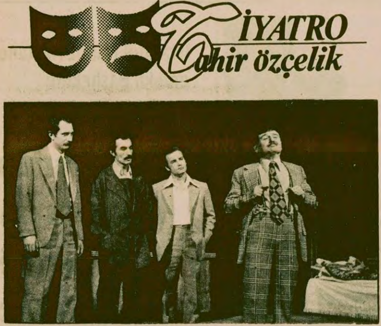
Geçen yılın ilginç oyunlarından "Bir Ölümün Toplumsal Anatomisi"nden bir sahne.