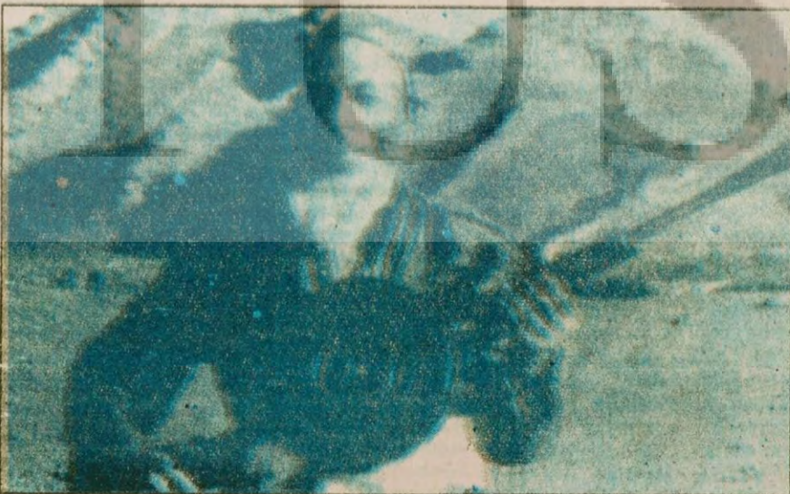
70 YAŞINDAKİ GERİLLA: Sovyetler Birliği'nin işgaline karşı savaşan Müslüman gerillalar arasında yaşı 70'i bulanlar da var. Fotoğrafta eski model tüfeği ile Rus işgaline karşı koyan 70'lik gerilla.