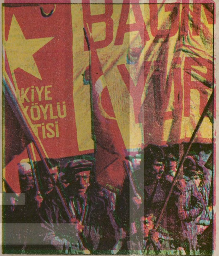
Geçen yıl Rus savaş gemilerinin İstanbul Boğazına demirlemesi üzerine Türkiye İşçi Köylü Partisi "Rus Filosu Defol" yürüyüşü düzenlemişti.