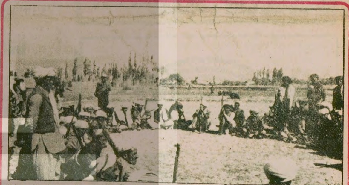
Afgan direnişçileri bir eğitim sırasında. Direnişçiler kendi olanaklarıyla yaptığı bombalarla özellikle geceleri faaliyet gösteriyorlar. Yayınladıkları bildiri'de halkı mücadeleye yolunda örgütüyorlar.