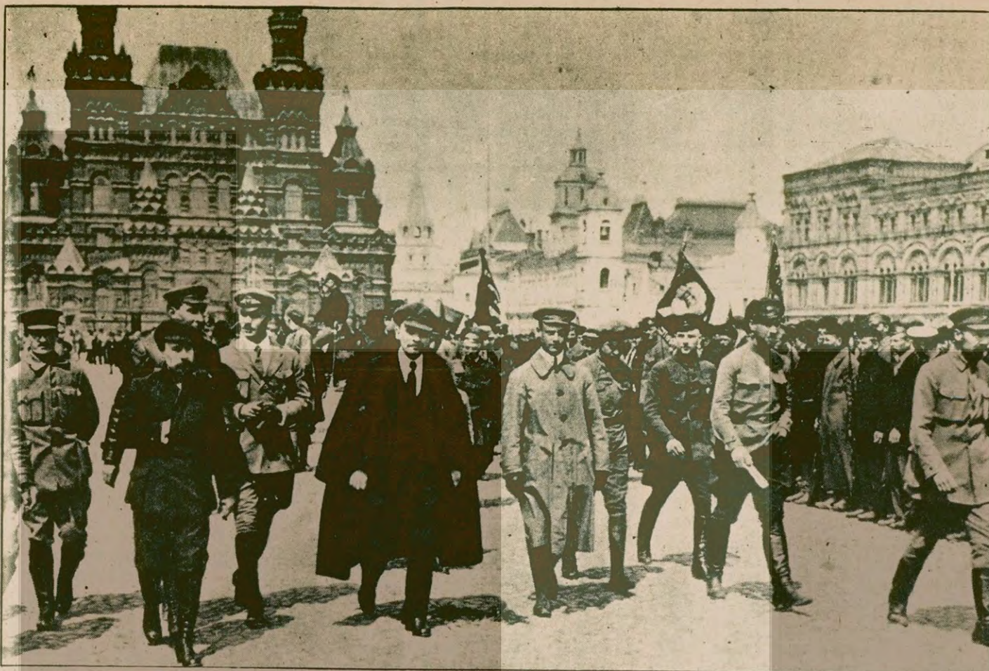
Lenin, bir grup subayla, askeri eğitim birliklerini denetliyor. O, başka ülkelere saldırmanın emperyalist bir siyaset olduğunu belirtir, yurt savunmasının önemi üzerinde dururdu. (Moskova, Kızıl Meydan, 25 Mayıs 1919)