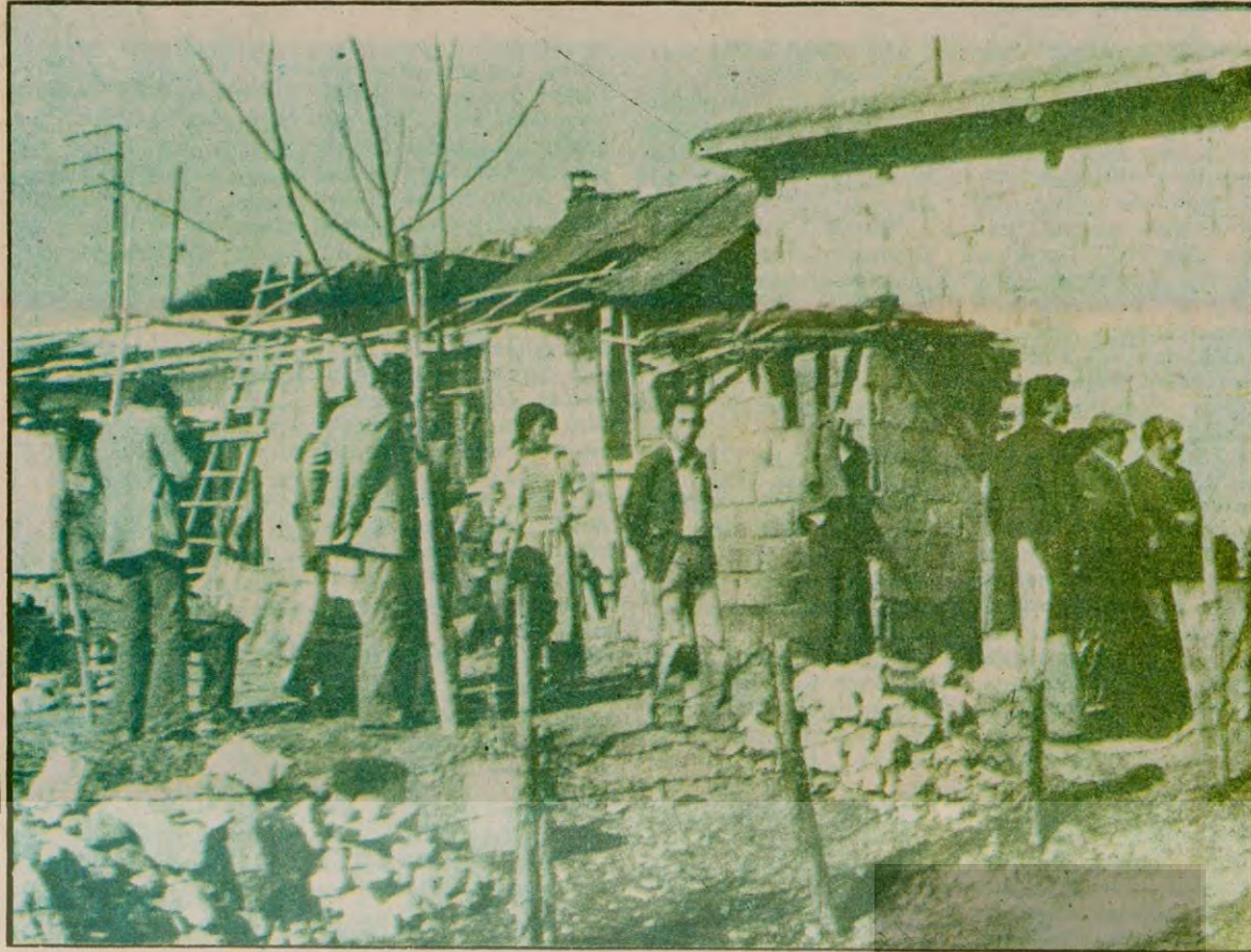
Keşifler sırasında evlerin bir çoğunun olaylardan sonraki haliyle kaldığı görüldü.