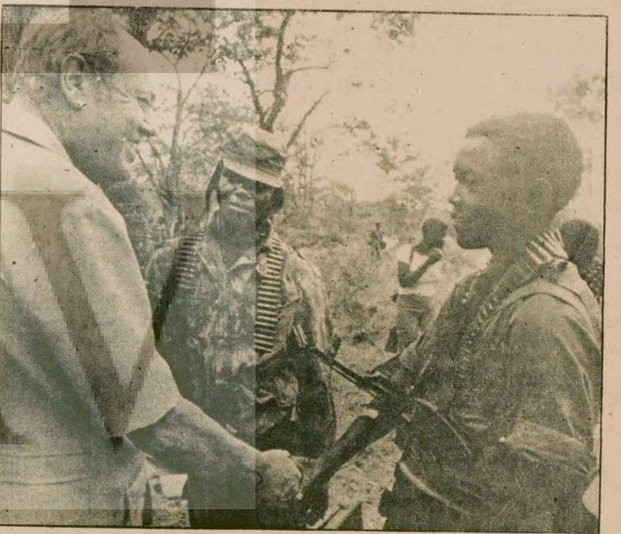
İngiliz Vali Lord Soames, ateşkes anlaşmasını denetlemek için Zimbabve'de çıktığı bir gezide, Yurtsever Cephenin ZANU kanadına bağlı bir gerilla ile el sıkışırken.

Şili'de maden işçileri grevinin dikta yönetiminin işbaşına geldiği 6 yıldan bu yana yapılan grevlerin en geniş kapsamlısı olduğu belirtiliyor.