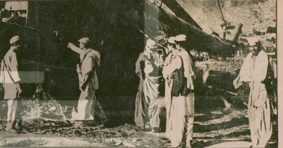
Afgan direnişçileri Rusların ilerlemesini engellemeye çalışıyor. Genç kızlar göğüslerine bomba bağlayarak Rus tanklarının üzerine atıyor. Yollar, köprüler havaya uçuruluyor. Fotoğrafta gerillaların düşürdüğü bir Sovyet helikopteri.