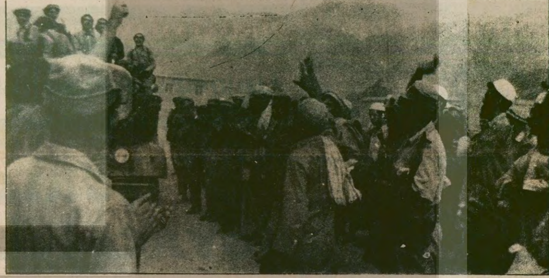
Afgan ordu birliklerinin de katılımıyla daha da güçlenen Müslüman gerillalar, Rus işgalci birlikleri-ne karşı vur-kaç yöntemi ile savaşıyorlar. Doğuk