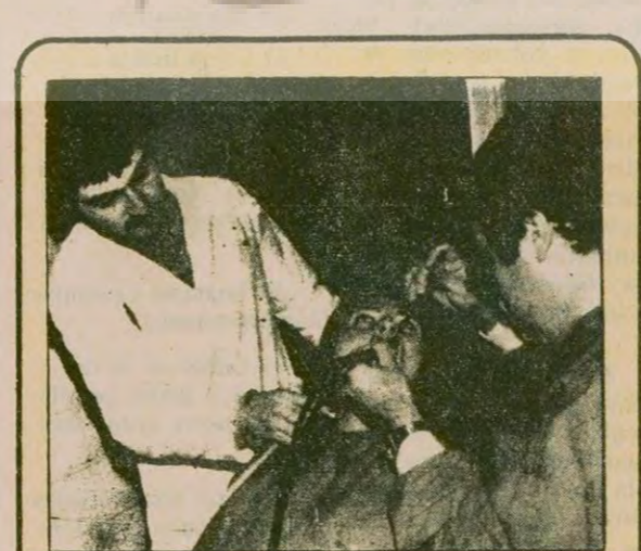
Diş macununun çok gerekli olmayıp ağıza hoş bir koku verdiğini söyleyen diş tabipleri fırça ve suyla temizliğin yeterli olduğunu söylüyor.