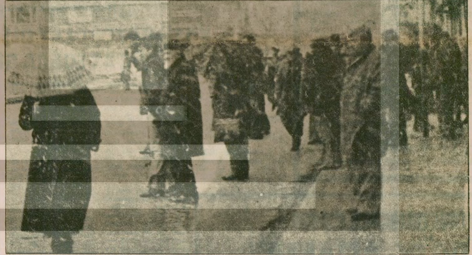
İSTANBUL'A YILIN İLK KARI YAGDI- Tunceli'de kar kalınlığı 1,5 metreyi aşarken İstanbul'da da yılın ilk karı yağdı.

KANDAHAR, Paktia, Banyan ve Badakşan kentlerinde denetimci ellerine geçirmeye çalışan Sovyet birlikleri ile Afgan direniş kuvvetleri arasında yoğun çarpışmaların olduğu bildiriliyor. Yoğun çarpışmaların sürdüğü kentlerden biri de İran sınırına 100 kilometre uzaklıktaki Herat. Ajanslar Sovyet birliklerinin kenti sardığını, Pakistan sınırına 90 kilometre uzaklıktaki Celalabad kentindeki askeri üssün de (Devamı sa.7, sü.9'da)