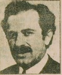
Zeki Eroğlu (CHP İstanbul Milletvekili)

"Tamamen emperyalist bir işgaldir. Bağımsız bir ülkenin işgali son derece tehlikeli bir gelişmedir. Başka bir emperyalist ülkenin başka bir ülkeyi işgaline yol açacak kadar tehlikeli bir gelişme, ayrıca pazarlıktan da endişeliyim."