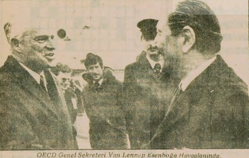
OECD Genel Sekreteri Van Lennep Ezenboğa Havaalanında.

"Rusların apaçık bir müdahalesidir. Alabildiğine kınıyorum. Rusya'nın emperyalist bir ülke olduğunu ve artık kuzu postuna bürünerek saklanamayacağını göstermiştir. Afganistan'da dış tehlikelerden korumak için gittiğini ileri sürüyor. Oysa dış tehlike kendisi (Devamı sa.7, sü.5'de)