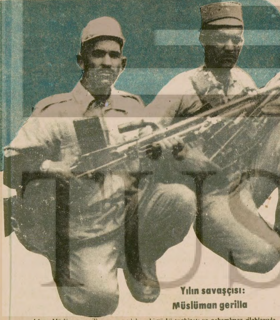
Yılın savaşçısı: Müslüman gerilla

Rusya Afganistan'a güç yığmayı sürdürüyor