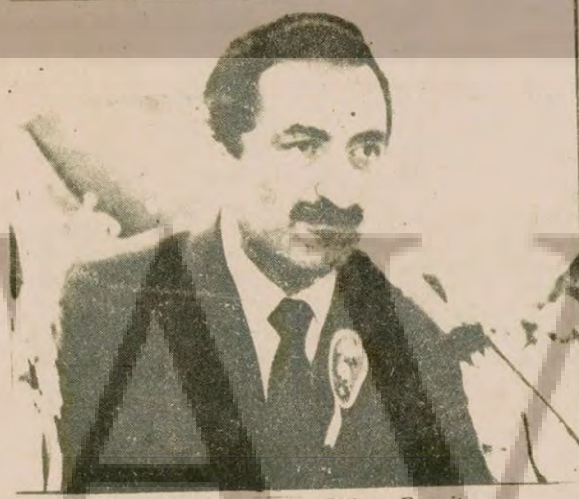
CHP Genel Başkanı Bülent Ecevit

Ecevit: "Birbirimizi anlamaya çalışmak zorundayız"