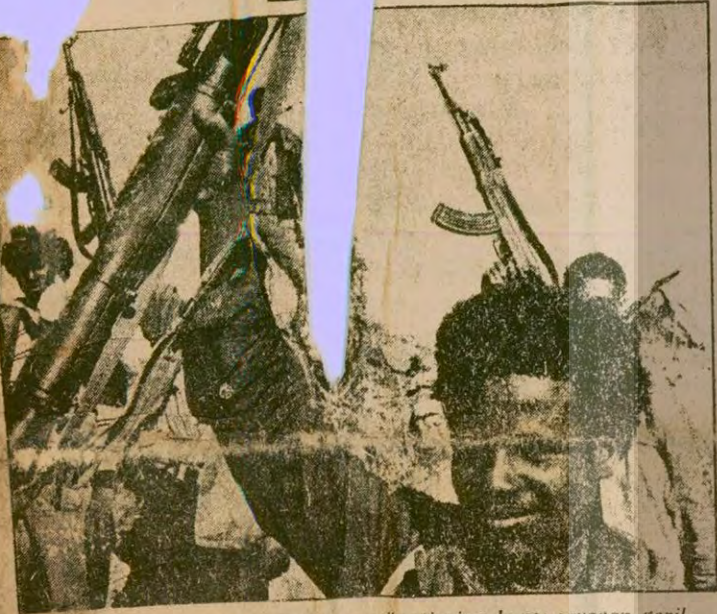
Eritre'de, Rus yanlısı Etyopya yönetimine karşı savaşan gerillalar.

1980'lere girerken dünyanın çeşitli yerlerinde Sovyet idarlığına karşı sıcak savaş devam ediyor. Savaşın başlıca cepheleri, Afganistan, Kamboçya ve Eritre.