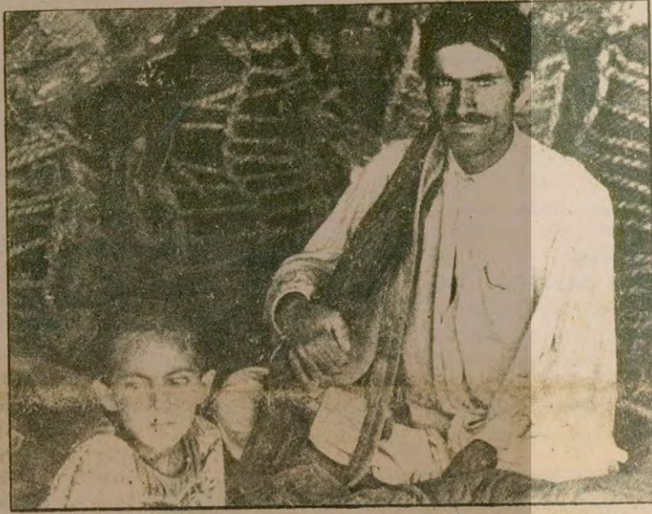
Afganistan'da önce Taraki, sonra Amin ve şimdi de Babrak Karmel'in Rus yanlısı yönetimlerine karşı silahlı mücadele veren bir Müslüman gerilla.

■ Afganistan, Kamboçya, Eritre ve Angola'da Sovyet işgalcilerine ve Sovyetlerin desteklediği kukla rejimlere karşı silahlı halk savaşı sürüyor