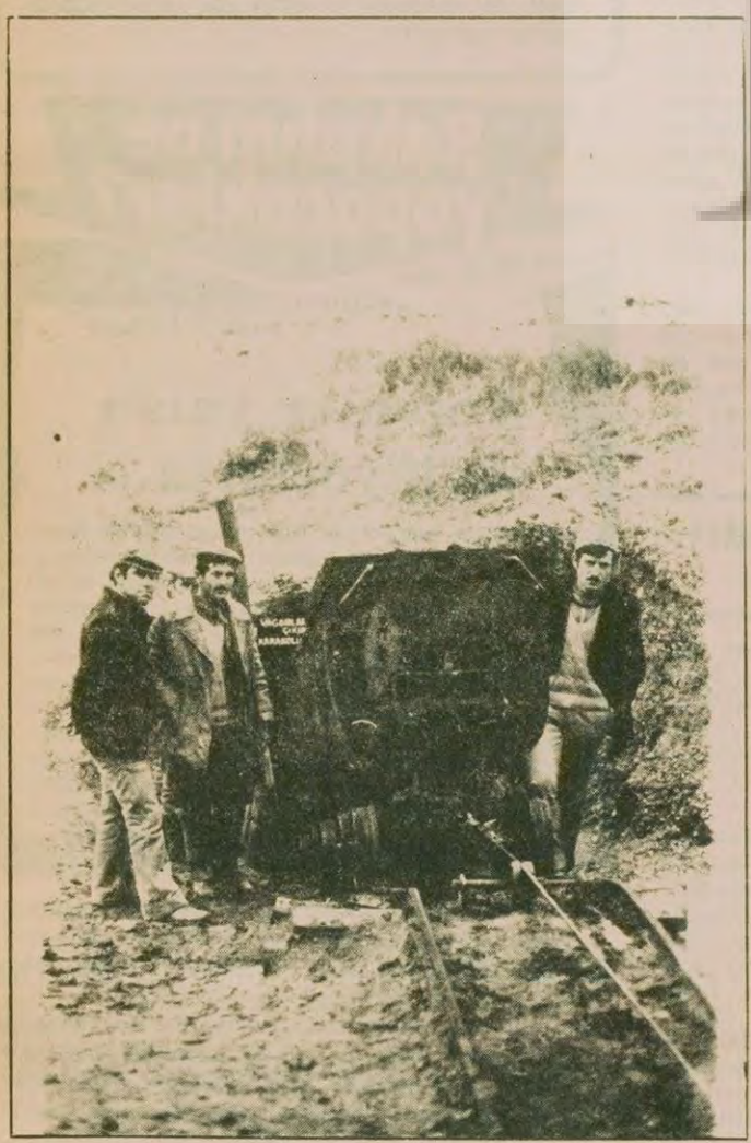
Vagonlar ardarda taşınıyor yeryüzüne.