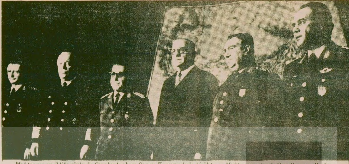
Muhtıranın verildiği günlerde Cumhurbaşkanı Sunay Komutanlarla birlikte... Muhtıranın altında Genelkurmay Başkanı Tağmaç ve komutanların imzaları vardı ama cuntanın başında Sunay - Tağmaç ikilisi bulunuyordu.

1971'in 12 Mart günü TRT'nin öyle haberlerinde okunan bir muhtıra siyasal yaşamı bir anda altüst etti. Altında Genelkurmay Başkanı Tağmaç ve Kuvvet Komutanları Gürler, Eyicioğlu ve Batur'un imzaları bulunan ve Cumhurbaşkanı ile Senato ve Meclis Başkanlarına sunulan muhtıradan, hükümetin çekilmesi isteniyor aksi halde Silahlı Kuvvetlerin yönetime el koyacağı belirtiliyordu. Aynı gün Demirel hükümeti istifa etti. Bunu izleyen günlerde de CHP Kocaali milletvekili Nihat Erim partisinin ayrıldı ve Başbakanlığa getirildi.