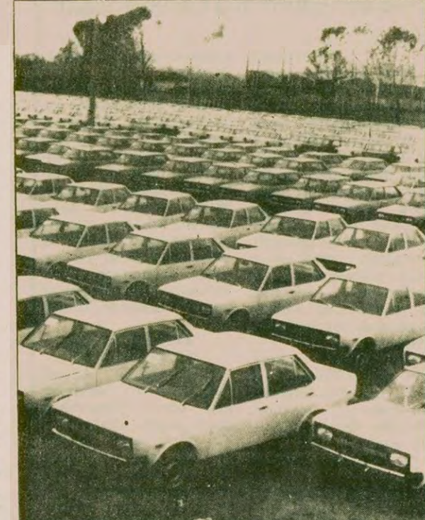
Döviz darlığı nedeniyle 1979 yılı içinde Otomotiv Sanayinde ancak yüzde 50 kapasite ile üretim yapılabildiği belirtiliyor.