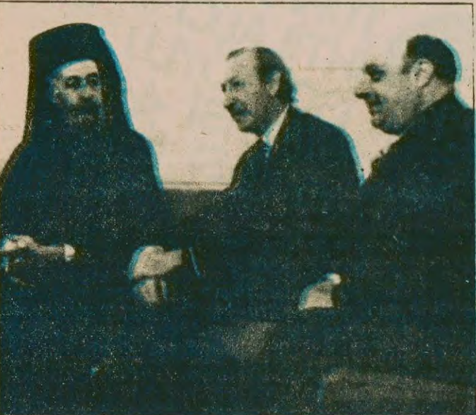
Kıbrıs sorununun çözümünü isteyen herkes, toplumlararası görüşmelerin tek çıkış yolu olduğunu görüyor ve destekliyor. Sovyetler Birliği ise, Kıbrıs'ta barışın yeminli düşmanı olarak sorunu uluslararasılaştırmaya çalışıyor. Fotoğrafta, şimdiye kadar sonuçsuz kalan toplumlararası görüşmelerden biri. Makarios, Waldheim ve Denktaş birlikte.

madan giriyoruz. Olayların gerçek tertipçileri ise hâlâ yeni cinayetler işlemede ve tertiplere girismekte. Türkiye halkı ölümlerinin acısını unutmadı, 1980'li yıllara katillerin cezalandırılması ve suç örgütü MHP'den hesap sorulması talebiyle girişti.