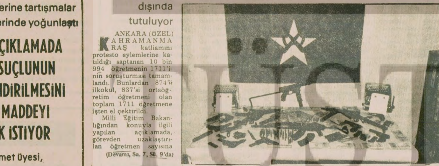
Emniyet görevlileri Acilcilerin üslendığı bir eylem yaptıkları baskında Klasi-kof ve M-5 silahlarıyla çok sayıda mermi ve tabanca ele geçirildi.

TIKP Erzincan il Başkanı ETKO tarafından kaçırılmak istendi