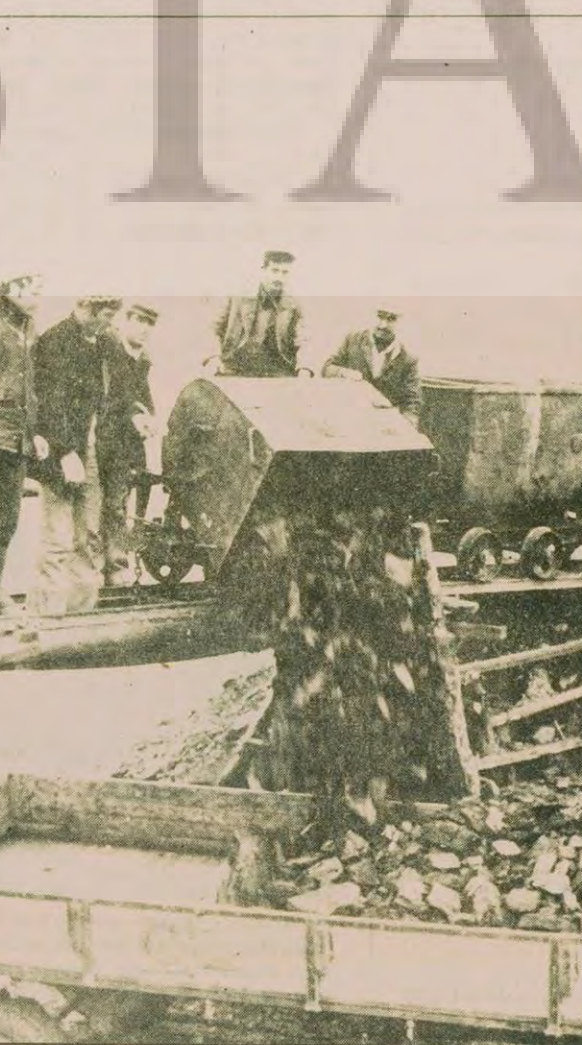
Ve, traktörlere bastılar kömürleri. Az sonra bu kömürler birçoğumuzun evini ısıtacak...