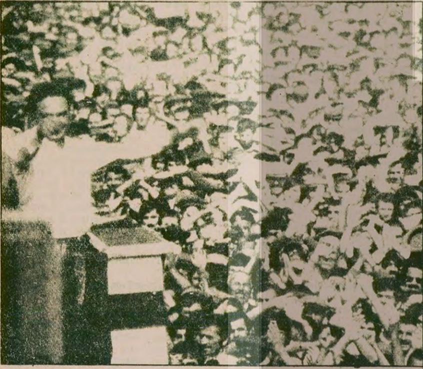
12 Mart'ın şanssız bir dönem seçtikleri, darbeden 2,5 yıl sonra belgeniyor. Kendiliğinden gelişen kitle hareketleri meydanlarda yüz binleri topluyor, 12 Mart'ın yüreğine korku salıyordu. İşte 1973'ün görkemli mitinglerinden biri.