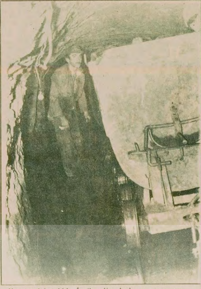
Her taraf bataklık. İşçiler dize kadar su ve çamur içinde çalışıyorlar.

D İŞARIDAYIZOR... tahık bağağı karamış. İşçiler, gelin beraber bir yemek yiye lim, diyorlar. Oturuyoruz.