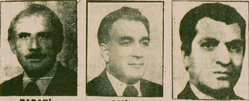
TARAKI Muhammed Nur Taraki, 27 Nisan 1978'de Rusların desteği ile kanlı bir darbe yaparak işbaşına gelmişti. Hafızullah Amin, 14 Eylül 1979 günü Taraki'yi kanlı bir saray darbesi ile tasfiye etti. 27 Aralık 1979 Babrak Karmel Rusya'nın katıldığı bir darbe yaparak Amin'i idam etti. AMIN BABRAK