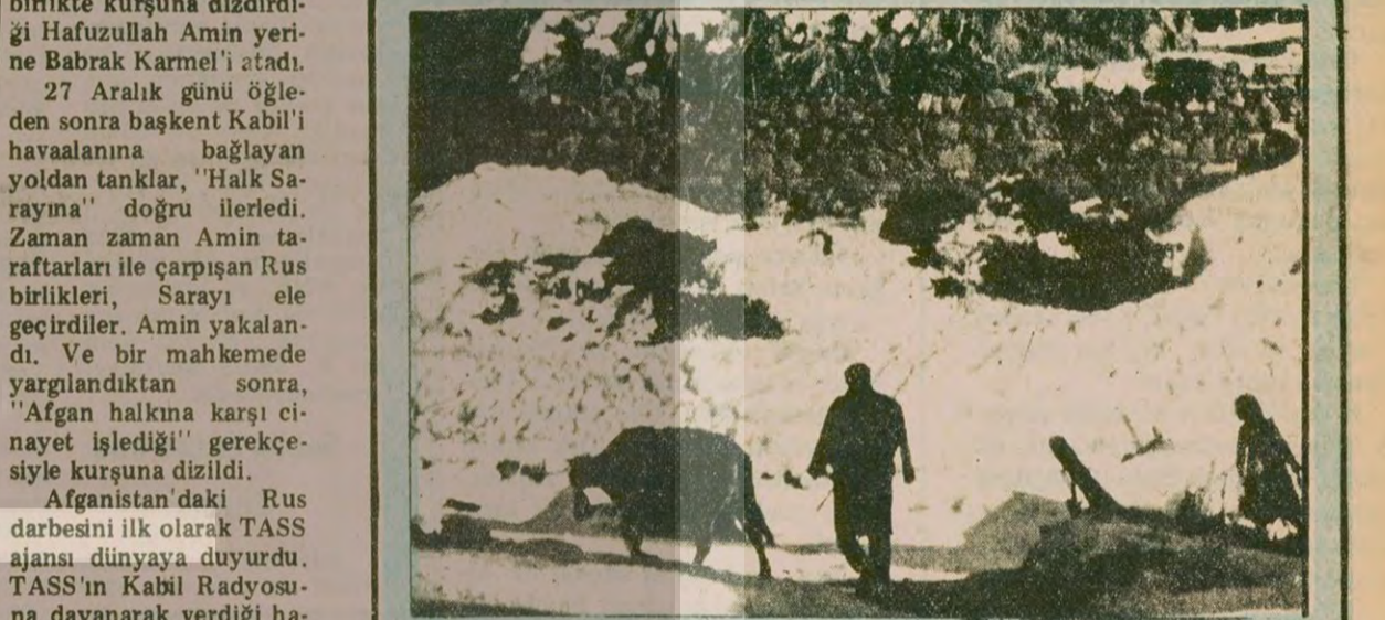
SAMANLAR KAR ALTINDA KALDI — Karayollarına bağlı "karla mücadele ekipleri" yolları temizlemek için çalışırken, köylüler de samanlarını kurtarmaya çalışıyor. Kar kalınlığının 40 santimetreye ulaştığı Erzurum'da her şey kar altında kaldı.

●Müslüman gerillalar, "Rus ajanı Babrak'a karşı savaşın süreceğini" ilan etti