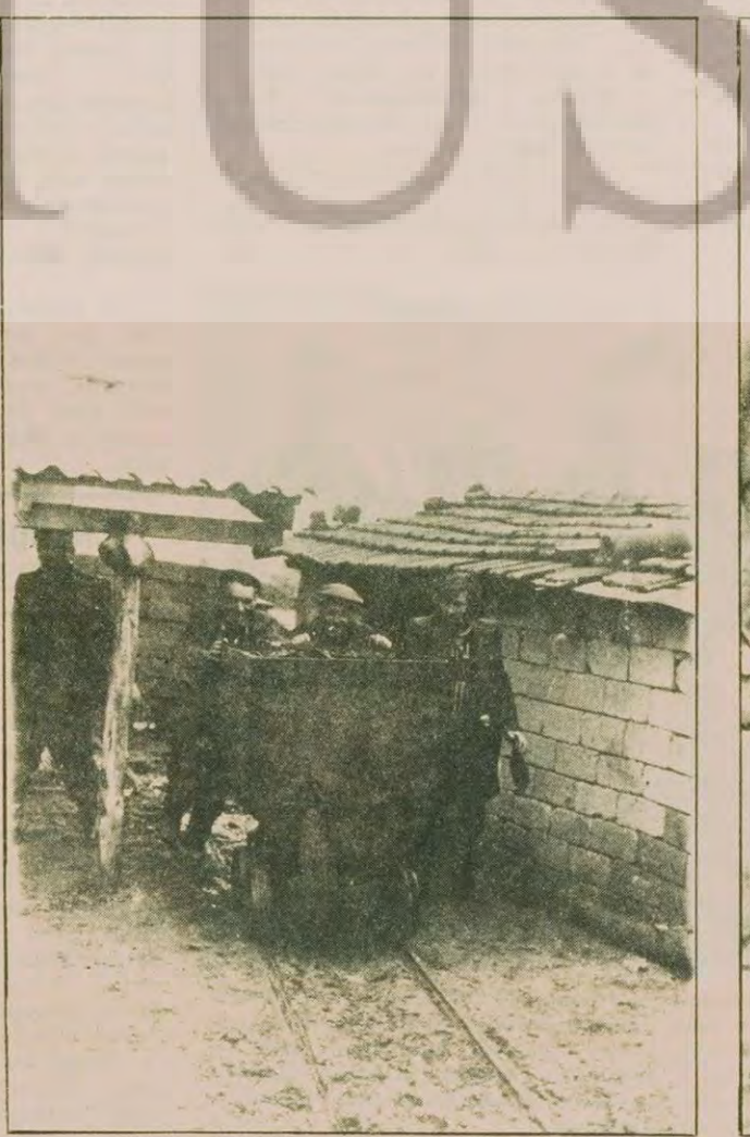
Bazen alıcılar da yardım eder işçilere...