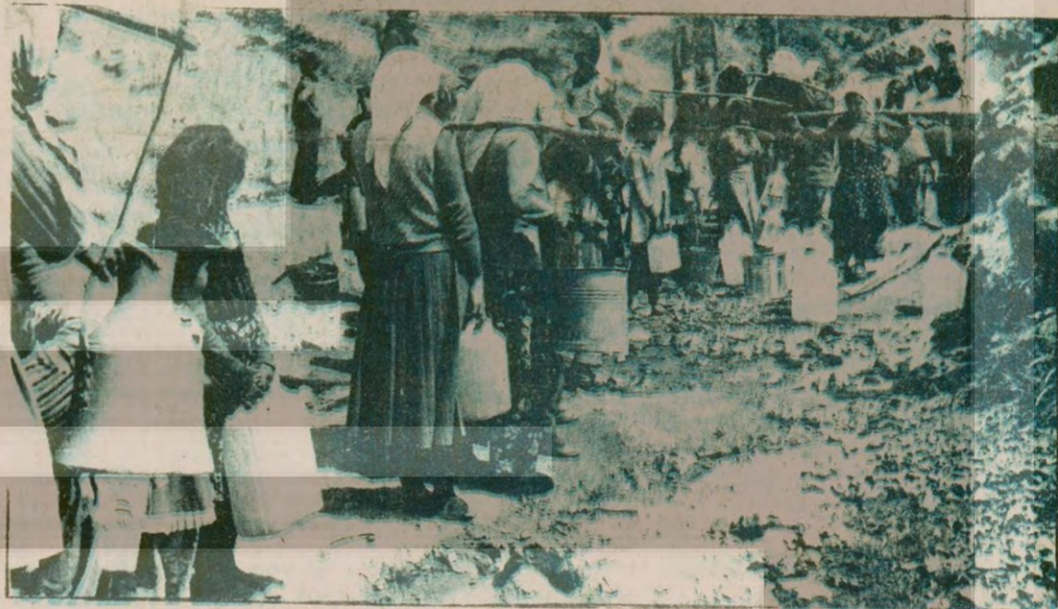
Bir türlü bitmeyen su kuyruklarında boşa akan muslukların da payı var