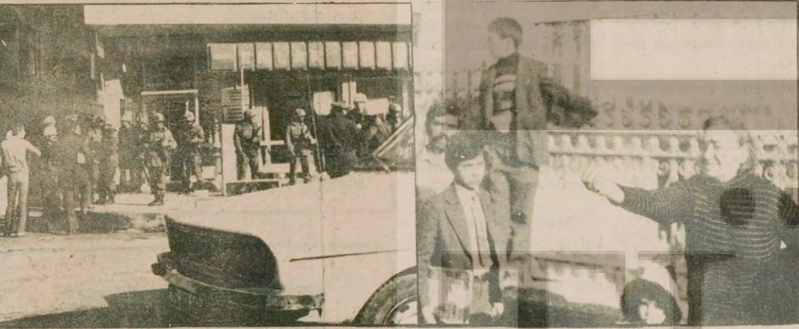
Buca Eğitim Enstitüsünde çıkan olaylarda yüzlerce öğrenci gözaltına alındı. Yaralanan öğrencilerin yaralarını çocuklarını hastane önünde saatlerce aradılar.

42 Eğitim Enstitüsünün öğrenimine ara verilmesi üzerine