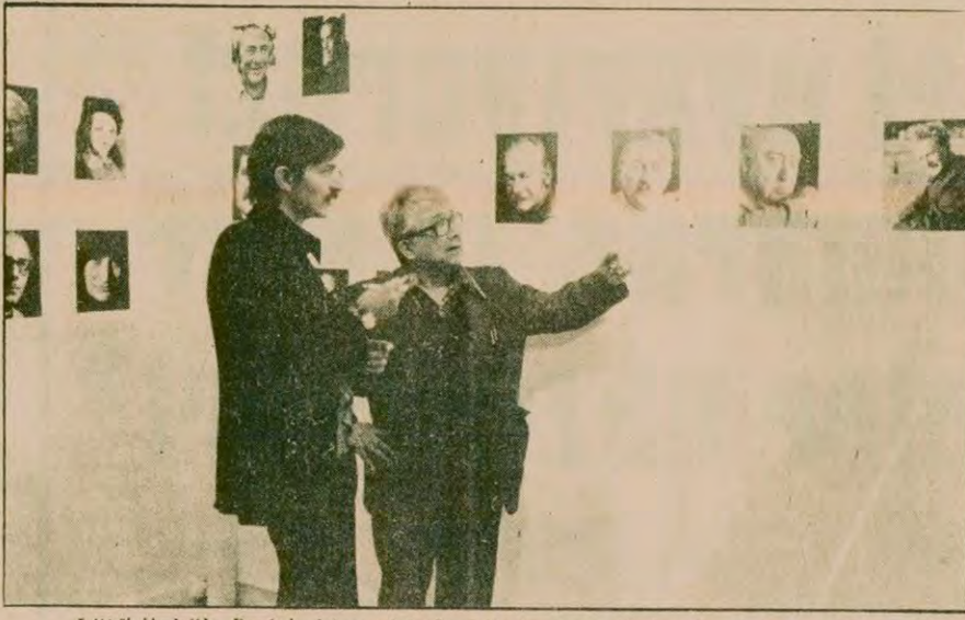
Lütfi Özkök, Paris'teki sergisinde arkadaşımız Akdora'ya bilgi verirken

koleksiyonunun tamamı 500'ü aşımıyor. Sanatçı 20 yılı aşkın bir çaba sonucu dünyadaki ender fotoğraf arşivlerinden birini oluşturmuş. Portreleri ya özel görüşmelerle, ya da uluslararası yazar kongrelerinde olanakları değerlendirilerek bir araya getirmiş. Her bir portrenin bir öyküsü var. Bunlardan Beckett basına ve fotoğraflara kapıları kapalı, reklamlardan hoşlanmayan bir