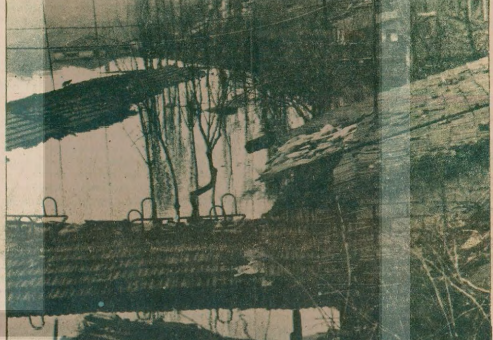
Lağım suyu basan evlerin sadece çatıları gözlüküyor.