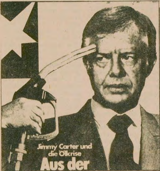
Jimmy Carter und die Ökrisse Aus der

Petrol fiyatlarının artmasıyla ilgili incelememiz 3. sayfa