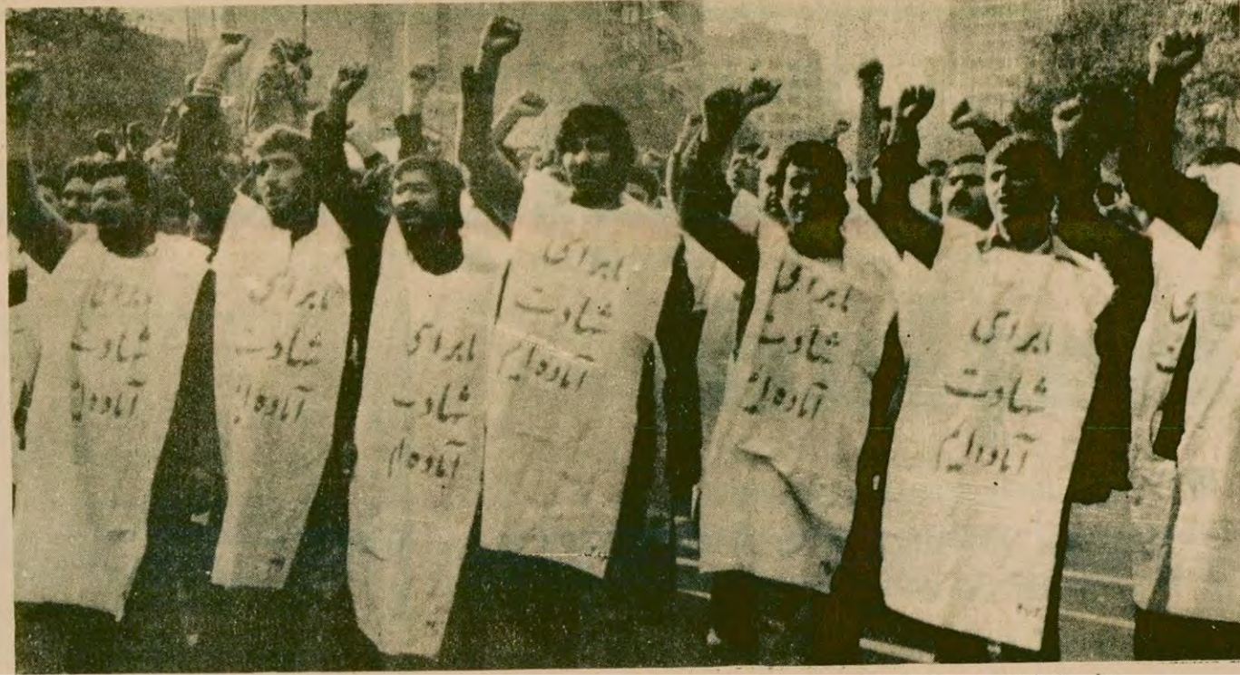
ABD Tahran Elçiliğindeki işgalcileri destekleyen göstericiler, ABD'nin devrik Şahı iade etmesini istiyorlar.