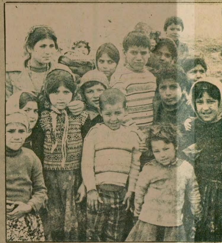
Anadolu'da okula gitme imkanı bulamayan çocuklar "çocuk yılının ne demek olduğunu pek anlayamadılar. "Çocuk yılı için ne düşünüyorsunuz diye sorulduğunda, çocuklar "ne yapılacak" diye soruyor ve kendilerinden bahsedildiği için kıkır kıkır güliyorlar.