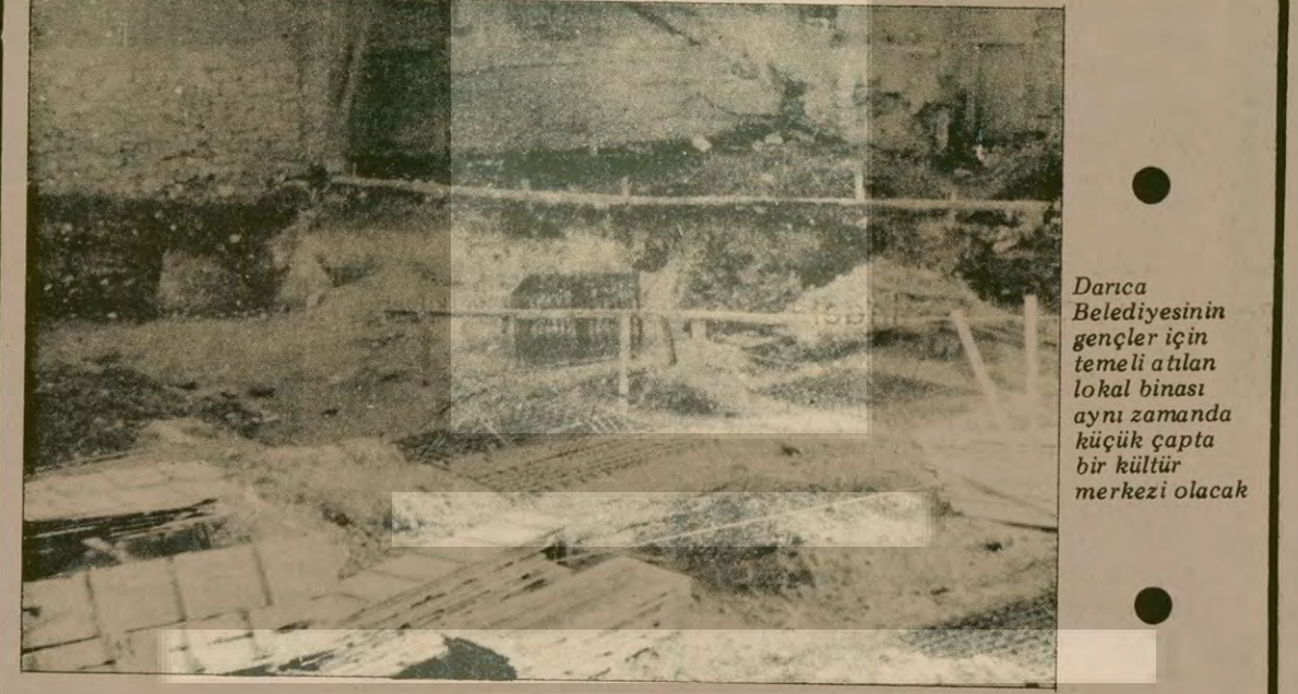
Darıca Belediyesinin gençler için temeli atılan lokal binası aynı zamanda küçük çapta bir kültür merkezi olacak

Milli Eğitim Müdürlüğünden edinilen bilgiye göre, şu anda okul idarecileri ve öğretmenler hakkında soruşturma açılan okullar şunlar: Çınarlı Meslek Lisesi, Bornova Süphü Koyuncuğu Lisesi, Namik Kemal Lisesi, Karşıyaka Erkek Lisesi, Buca Lisesi, Şirinyer Lisesi, Hava Özışbakan Lisesi, 50. Yıl Lisesi ve Narlıdere Lisesi.