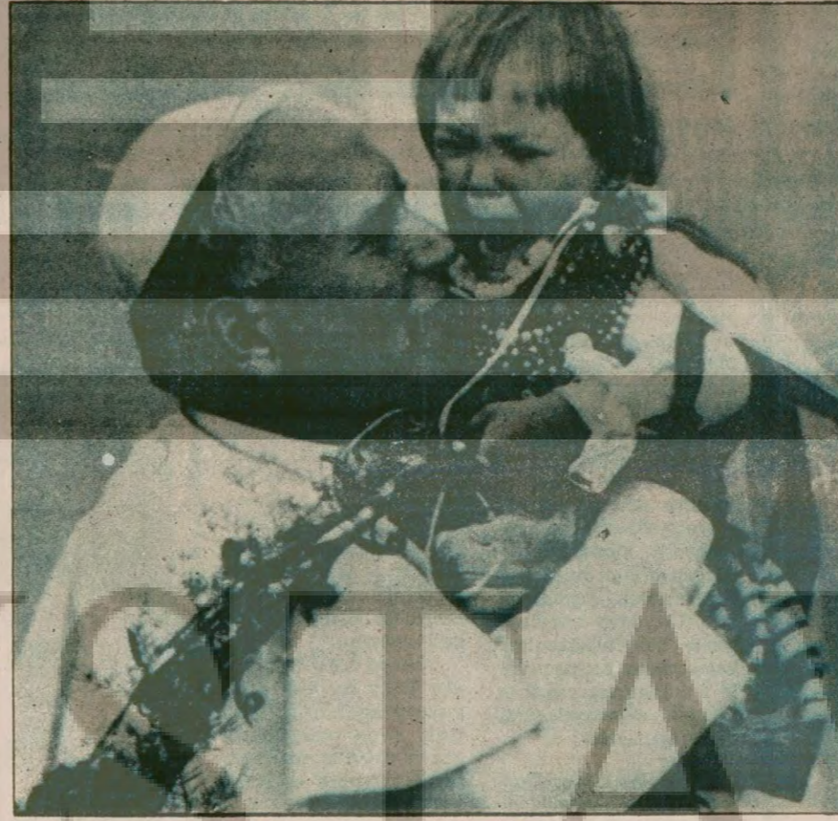
Papa, gittiği her ülkede sevgiyle karşılanıyor.

● Papa'nın ziyaretiyle ilgili protokol gizli tutuluyor ● Papa'nın, Patrik I. Dimitrios'la görüşmesinin tarihi önemdedir olduğu bildiriliyor