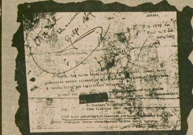
Hakkı Yaşar adlı bir kişi tarafından Şemsi Gök'e gönderilen ve Gök'ün üzerine kendi el yazısı ile kurum hatibinden bilgi istediğini belgeleyen mektup. Mektubun en üzerinde A.T./1066 yazılarak resmi bir yazışma gibi numara verilmiş.

Bir yakınının, kendisine gönderdiği ve işin çabuklaşmasını talep ettiği mektubunu, Şemsi Gök'ün resmi bir yazışma gibi göstererek, hazırlık aşamasında bulunan bir