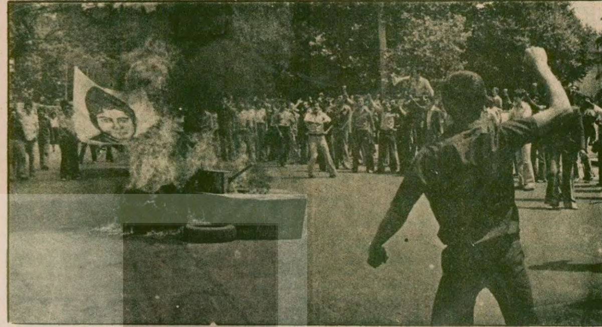
Moskova yanlısı İGD'iler İstanbul'da korsan miting yapıyorlar. Türkiye'ye karşı eylemler, Türkiye'ye karşı sloganlar ve Türkiye'ye karşı bir cephe kurma çabası...

14 Ekim seçimleri, beklenenin aksine hemen hiç bir önemli olaya sahne olmadı. Halkın birlik ve barış istediğini bir başarıydı bu. Ve seçimlerden sonraki iki hafta, nispeten "huzurlu" geçti. Ta ki, 28 Ekim akşamına kadar. Türkiye'deki anarşi olaylarının