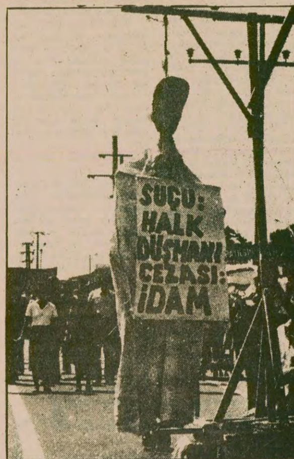
İDAM: TKP'nin en ilmi görünüm taşıyan yayıncı organı "Kadınların Sesi" bu eşiği yayınladı. Anarşi mihrakları gizli mahzenlerde değil, göz önünde...

Gariptir, her ikisi de MC istiyordu. MHP'nin hükümeti kışkırtarak ve faşizme çekerek kazançlı çıkacağı açıktı. TKP ise, herhangi bir hükümet formülünün karşısında olduğunu peşinen açıklıyor, bir AP-CHP hükümetinin kurulmasına karşı savaş ilan ediyordu. TKP, gerçekleştirilmeye çalışıldığı ve UDC adını verdiği cephenin, ancak bir MC sayesinde mümkün