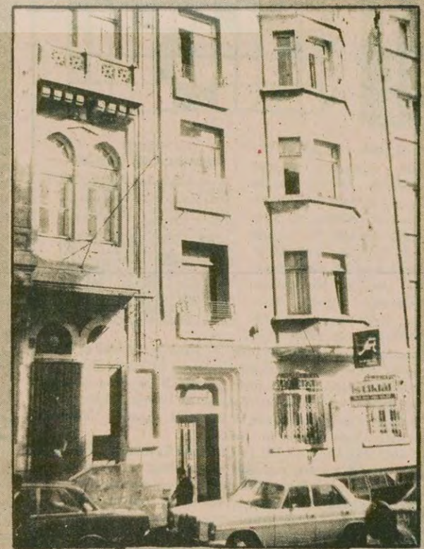
Cağaloğlu'nda Kardeşler Apartmanının beşinci katı Gök tarafından usulsüz olarak kiralandı.

• Ağca'nın Kartal Askeri Cezaevinden resmi elbise giyerek kaçtığı ihtimali üzerinde duruluyor