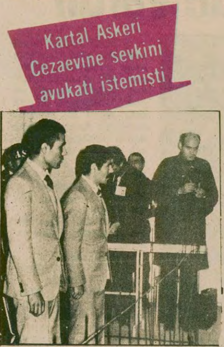
Ağca'nın kaçmaya kalktığı ve kaçtığı yerlere sevkini, avukatı (Sağ başta ayakta) ısrarla istemişti.