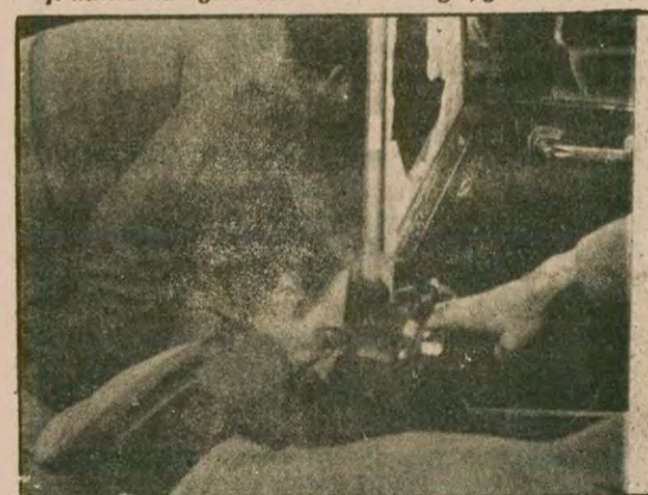
MHP mihrakı seçimlerden sonra ayar kıyımını yeniden başlattı. Alçakça saldırı hem Ümit Doğanay Hacıyan kişiliğine yönelik, hem de ülkeye duyulan hayata, barış ve birlik eğilimini dinamitlemek amacıyla.

kün olabileceğini hesaplıyordu. Savaş Yolu'nun "Demirel'in kuracağı anti-demokratik hükümet, faşizm tehlikesini de kendisinde taşıyor. Bu tehlike Ecevit'in iddia ettiği gibi AP-CHP işbirliğine önlenebilir. AP-CHP işbirliği, emperyalizm, işbirlikçi tekelci burjuvazinin, elde tuttukları bir başka alternatiftir." demesi de bu yüzdendi. Toplumun iki kampa ayrılacak bir şekilde vuruşması, TKP ve Rusya'nın güç toplamasına yarayacaktı.