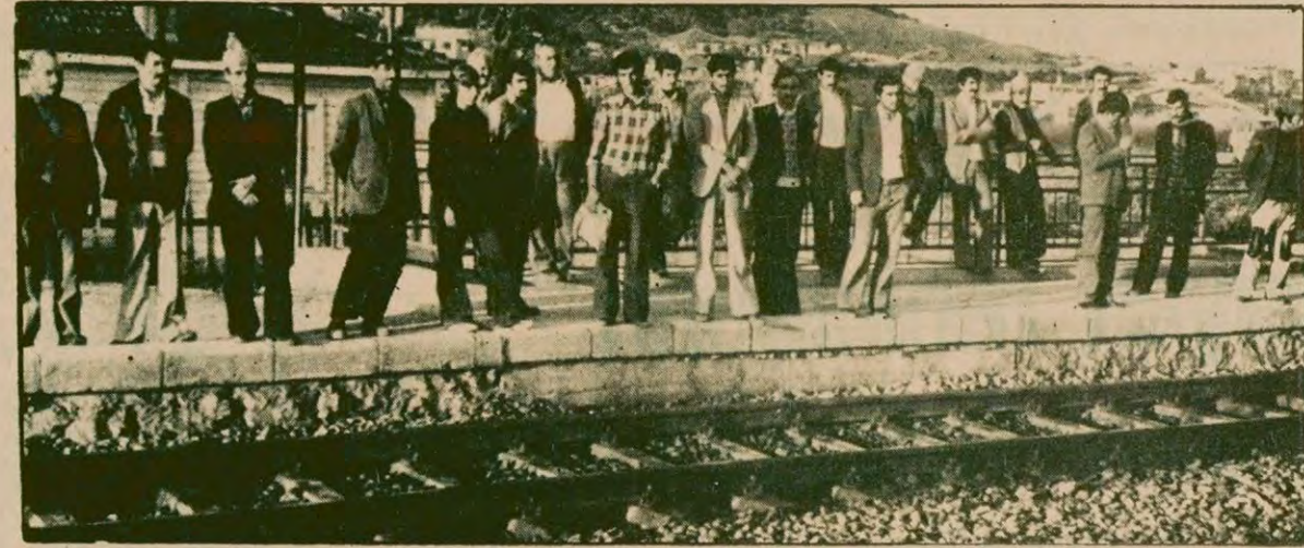
Dil İskelesinde evlerine dönmek için bekleyen semt halkı. Kapalı yeri olmayan bu istasyonda insanların soğuk ve yağmur altında saatlerce bekledikleri otuyur. Sık sık gecikmeli gelen trenler bu çileyi daha artırıyor. Tabii T.C.D.D. yetkililerinin de kulakları çınıyor.

Dil İskelesi halkı TCDD yetkililerine soruyor: