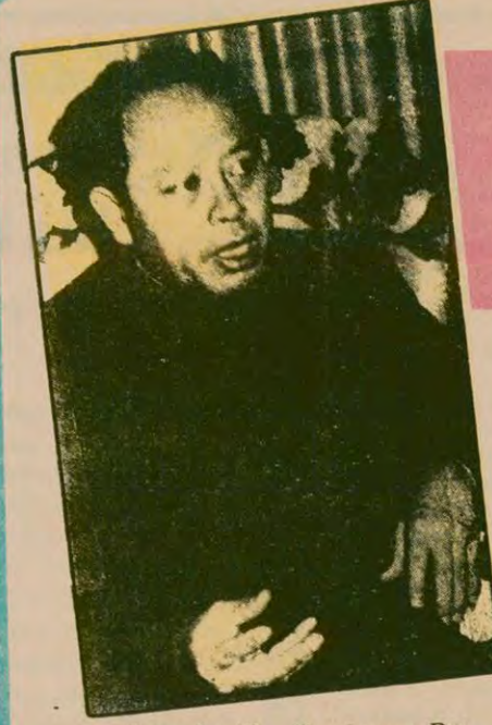
Demokratik Kamboçya Dışişleri Bakanı İng Sary ile bir görüşme:

Çin Halk Cumhuriyeti temsilcisi de, ülkesinin Kıbrıs sorununun toplumlararası görüşmeler yoluyla çözümlenmesini yana ve Kıbrıs'ın iç işlerine müdahale edilmesine karşı olduklarını belirtti. Çin temsilcisi, sorunun iki toplum arasında çözülmesini desteklediklerini söyledi.