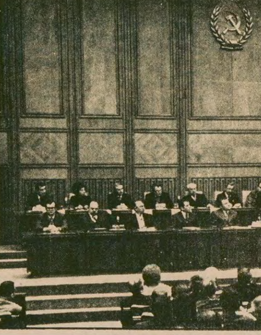
Romanya Komünist Partisinin 11. Kongresinden bir görünüm.

ROMANYA, SSCB'NİN EMİRLERİNE UYMUYOR Romanya'nın Rusya karşısındaki siyaseti Brej-