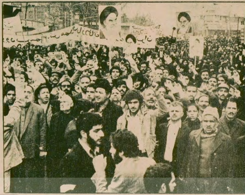
1978 ekiminden 79 şubatına kadar Tahran bir gösteri kenti haline gelmişti. İşte bu tür gösterilerden biri de dün yapıldı.

Homeyni, açıklamasında, ABD hesabına casusluk yaptıkları dair hiç bir kanıt bulunmayan kadın ve siyahıların Dışişleri Bakanlığına gönderilmesini talep etti.