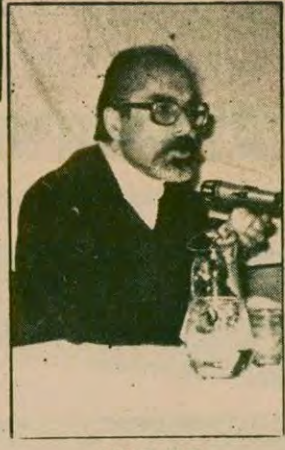
DOÇ. DR. EMRE KONGAR