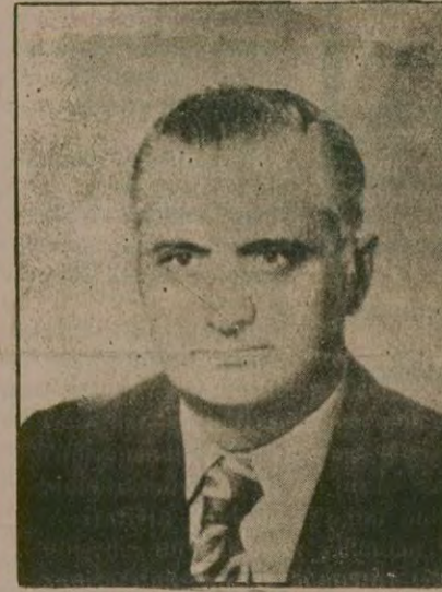
İÇİŞLERİ BAKANI GÜLCÜGİL

● İçişleri Bakanı, bazı gazetelerde yer alan, Sıkıyönetimin 25 M kapsayacak şekilde genişletileceği yolundaki haberleri yalanladı