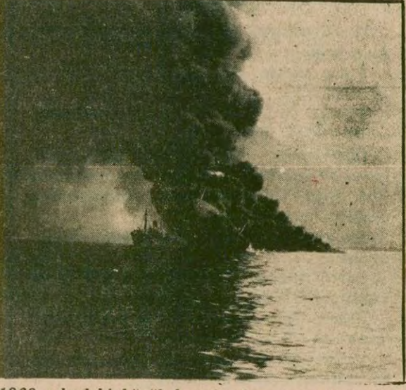
1960 yılındaki büyük kazada alev alan petrol yüklü Yugoslav tankeri, 52 gün boyunca yandı, istinye önlerine kadar sürüklenerek Tarsus yolcu gemisini de yaktı. On yıl önce de bir Sovyet gemisinden yayılan petrol Karaköv iskelesinin yanmasına yol açmıştı.