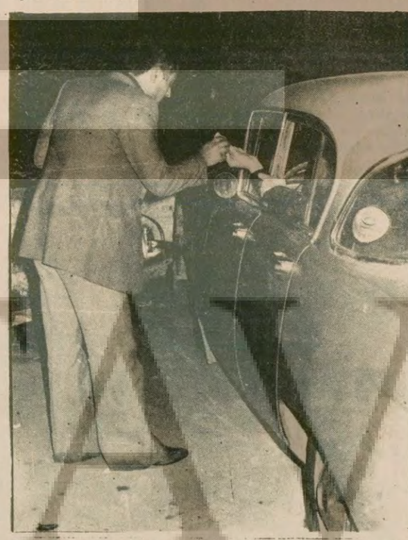
Yazlık çayhaneler, seyircinin çokluğu karşısında yeni- den açıldı. Arabalı seyircilere çay götüren çaycılar müşterilerin hespine yetişemiyor.

İSTANBUL Yangın merak konusu olmaya devam ediyor. Anadolü ve Rumeli yakasında oturan yurttaşlar yangının seyrini takibetmek, söndürme çalışmalarını izlemek için sahile koşuyorlar. Minibüsler, her gün cumartesi