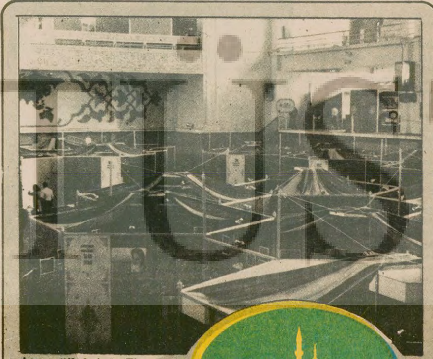
İslam Ülkeleri 1. Ticaret Fuarı bugün açılıyor. 14 Arap ülkesinin Ticaret Bakanının da katılacağı fuarda Filistin Kurtuluş Örgütü de temsil edilecek.

Newsweek dergisinin yayınladığı bu makalede, Moynihan son olarak Sovyetler Birliği'nde yaşayan azınlık milliyetlere dikkat çekti. "İki bin yıldır Sovyet toplumunun üçte biri Müslüman olacaktır" diyen ABD'li Senatör, bir süre sonra merkezî yönetimin etkisiz hale geleceğini söyledi.