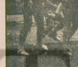
İstanbul orta dereceli okullararası birinciliğine katılan atletler, 1500 metre çıkışında...

Galler maçı ile ilgili primi federasyonun tespit edeceğini açıklayan Sabri Kiraz, prim verilmesi için Galler'in muhakkak yenilmesi gerektiğini ifade etti.