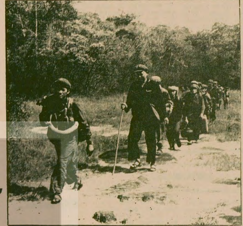
İng Sary Kamboçya'nın direniş bölgelerinde yaptığı bir gezi sırasında... (Soldan ikinci) Sary bazı hatalar yaptıklarını kabul ediyor. "Ama" diyor "Vietnam yanlısı güçlerin sabotaj ve karşılaştık çıkartma çabaları kan dökülmesine yol açan en büyük etken oldu."

Demokratik Kamboçya Dışişleri Bakanı İng Sary ile bir görüşme: