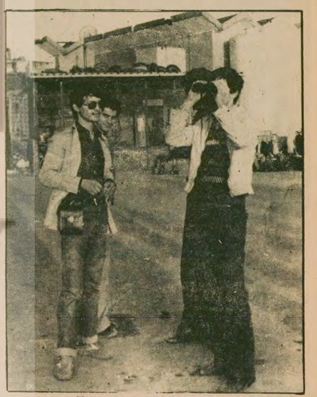
Bu arada işsizler de yangın sayesinde geçimlerini sağ- lama yollarını buluyorlar. Dübbin tedarik eden işsizler meraklılara dübbünü 5 ila 15 lira arasında kullandırlı yor.

bazar maçlarına taşdıkları yolcu sayısından fazla meraklı taşıyarak sefer rekoru kırıyor. Sahildeki evlerin balkonları günün her saati tık- lım tıkım insan dolu.