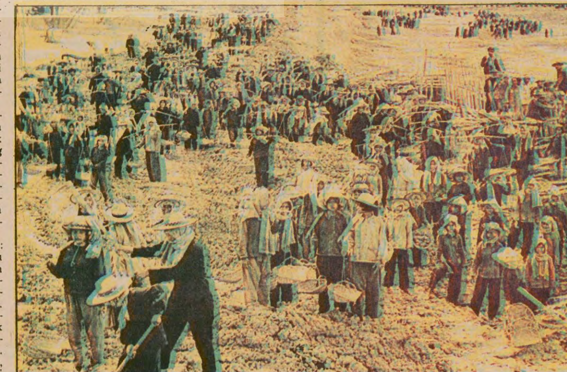
Vietnam'ın şimdi yakıp yıktığı güzelim pirinç tarlaları. Bir zamanlar kendine yetecek kadar yiyeceğe sahip olan halk şimdi açlık çekiyor.

İng Sary, son 20 yılını Kamboçya can-gıllamda gerilla savaşını vererek geçirmiş bir kimsedir. Şimdi Kamboçya halkının yürüttüğü savaşın ne kadar çetin olduğunu farkında. Yine de zafere olan inancının açık ve sarsılmaz olduğu görülüyor.