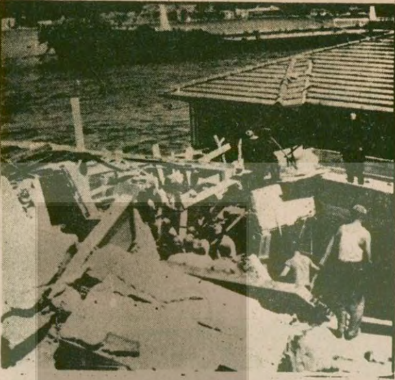
Boğaz kazaları sık sık meydana geliyor. Kılavuz almayan gemiler ya birbirine çarpıyor, ya kıyıya bindiriyor ya da karaya oturuyor. Deniz dibindeki kabloları kopartıyorlar, kıyıdaki karayoluna çıkanlar da var.