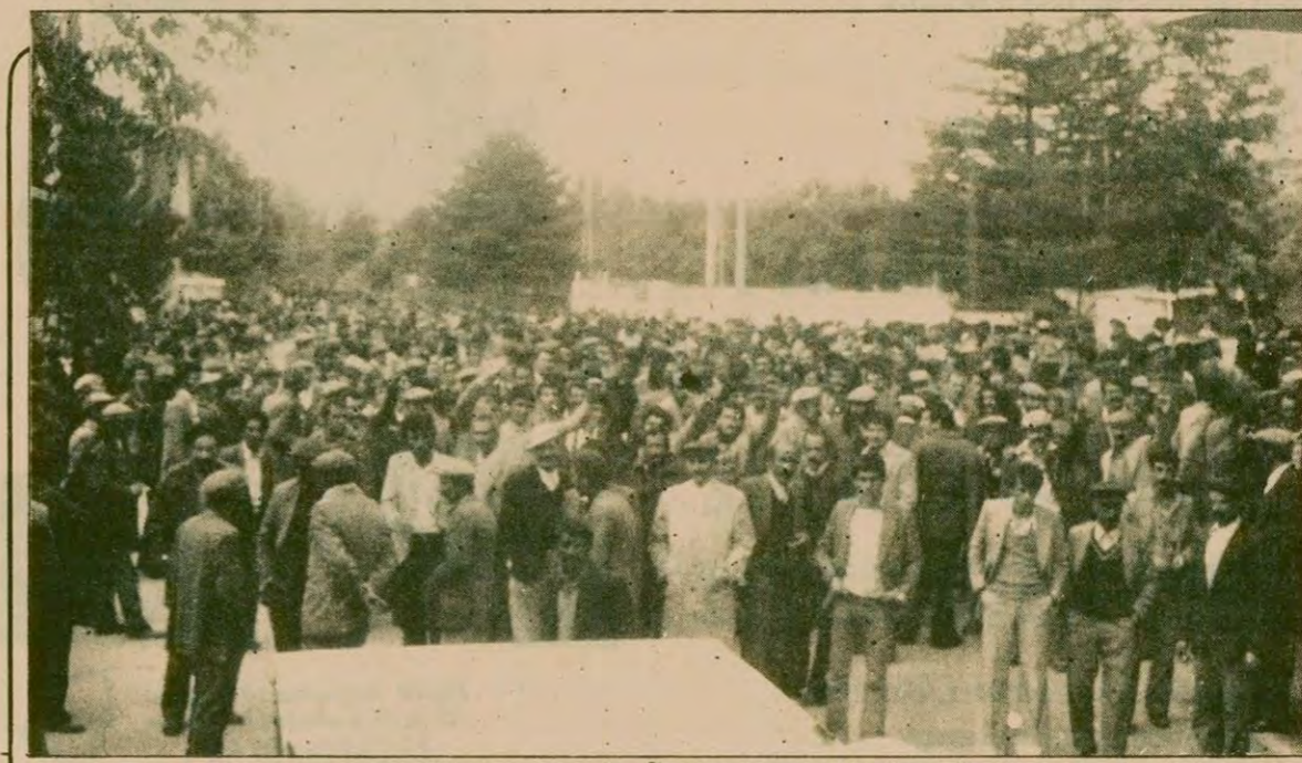
Elazığ Yol-İş Sendikasının geçtiğimiz ay yapılan Kongresine sendika üyesi üç bine yakın işçi alınması, MHP'li yöneticilerin zorbalığı protesto eden işçiler ayrı bir yerde toplantı yaparak yeni bir sendika kurma kararı almışlardır.