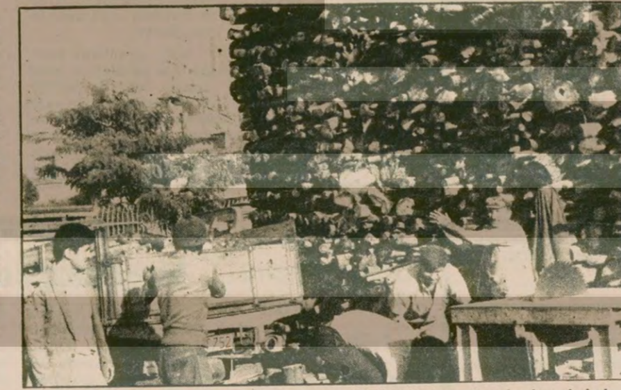
Bu odunlar, ne satılıyor ne de başka yere götürülebilir. 3 aydır depoda bekleyen odun ve kömürler çürümeye terk edildi. Oduncular, arada bir, odunları depodun bir yerinden başka bir bölümüne taşımak zorunda kalıyorlar.

KAYIP: Tunceli İKÖğretmen Müdürlüğünden aldığım öğretmenlik kimliğimi 26-10-1979 günü kaybettim. Geçersizdir. Hidir TAKAK