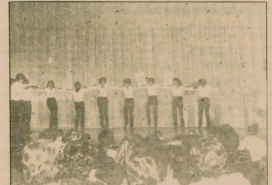
Çeşitli ülkelerden işçilerin folklor gösterileri sevinç ve coşkuyla izlendi.

Göçmen işçi derneklerinin açık oturumdan sonra sundukları eğlence programı büyük bir ilgiyle izlendi. Lozan'daki Yunan derneği başkanın Türkleri dinleyicilere takdim etmesi, Türk ve Yunan göçmen işçilerinin dostluğu üzerine yaptığı konuşma alkışlarla karşılandı. Çevrede büyük ilgi uyandıran göçmen işçilerin gecesine katılan bu tür gösterilerin devam etmesini diliyorlar.