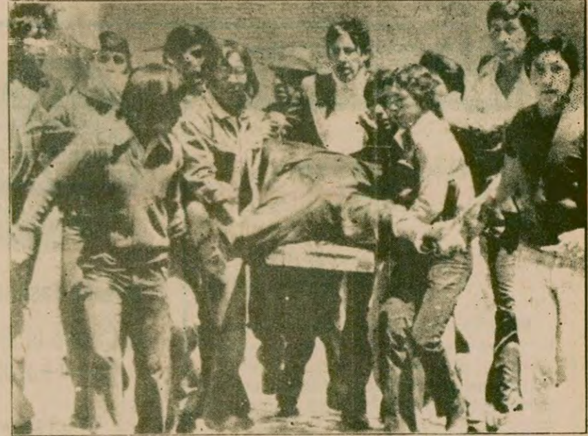
Diktatör Natusch yönetiminin saldırısına uğrayanlardan sadece biri.

Amman'da Ürdün Kralı Hüseyin'in konuşduğu bir toplantıda, petrol üretimini artırmak için 30 bin dolar ödül vereceğini açıkladı.