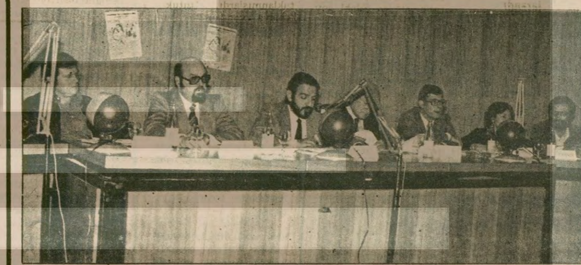
Gecede düzenlenen açık oturuma İsviçreli bazı sendikacılar ve yetkililer de katıldı. Yeni Yabancılar Tasarısı sert eleştirilere uğradı.