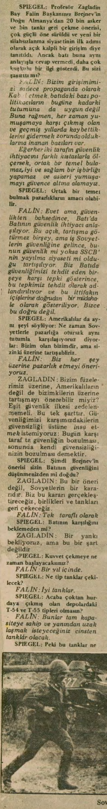
Sovyet askerleri bir manevrada