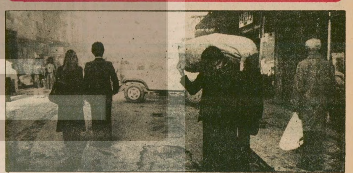
Saat dokuz beş gece herkes saygı duruşundaydı