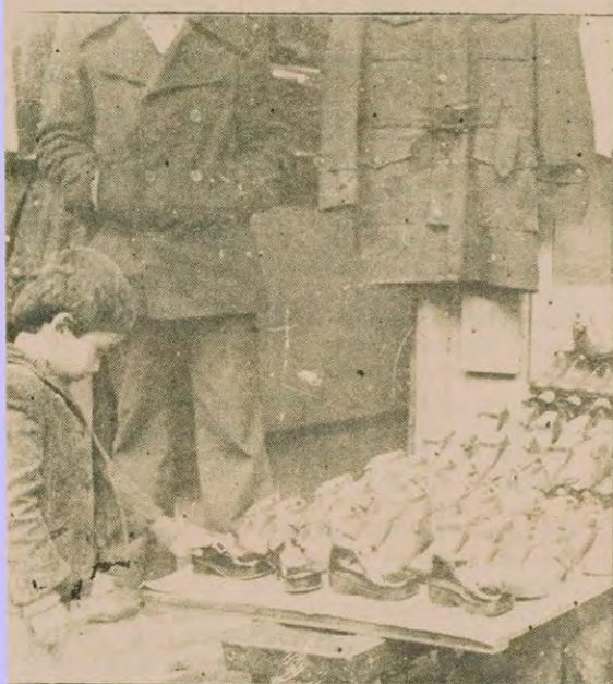
Yisini arıyor Ayakkabıların yığıldığı tezgahı küçük bir çocuk. Babası başka tezgahta pardesi çerker, o da ayakkabıları inceliyor.

HABER MERKEZİ Kurbanlık müşterileri beklerken, bayram öncesi maaşını alanlar doğru oduncuya, pazara koştu. Günlerden cumartesi olmasına rağmen otobüsler hınca hınç dolu, İstanbul'un büyük işporta merkezi Mahmudpaşa'ya insan taşıdı. Bir denbire müşterileri artan oduncularda da kuyruklar oluştu. Kurbanlık koyunun adını bile ağzına almaktan korkan halk, Et Balık Kurumlarının önünde her zamankinden daha uzun bayram kuyruğuna girdiler. Kurban pazarları yerine odunculara akın edenler, "Kurban olmasa da bayram olur, hele bir usulim o zaman ailecek bayram edeceğiz" dediler. Oduna kavuşan bir vatandaş, "Artık bu işin sevabı da günahı da kalmadı. Her şey ateş pahası. Odunu mu tercih edersin, kurbanı mı? Ben odunu tercih ettim" şeklinde konuştu.