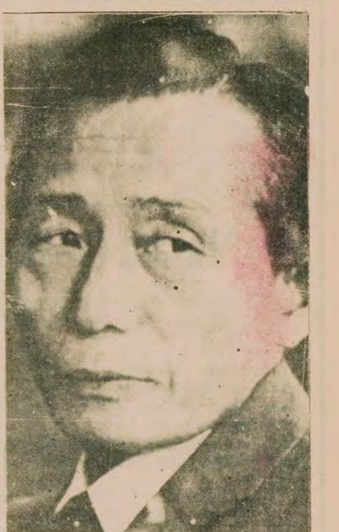
Devlet Başkanı Park Chung Hee 18 yıldır halka karşı diktatörlük uyguluyordu.

Sözkonusu açıklamada (Devamı sa. 7, sü. 3'de)