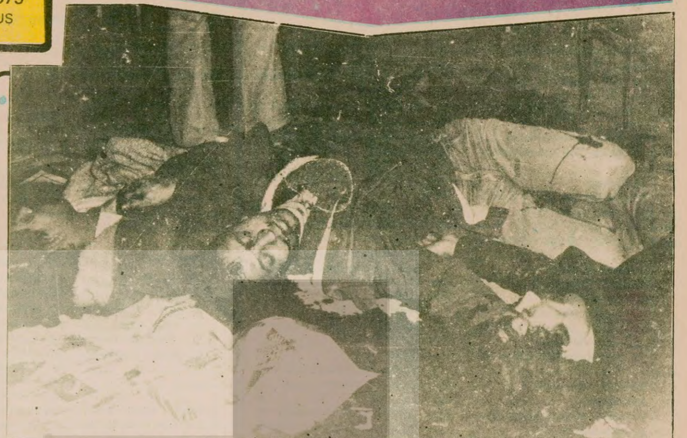
Kehvede oturuyorlardı. Duvara dizildiler ve yayım ateşle öldürüldüler.