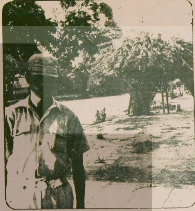
Kabil'in merkezinde 'Kabul Hotel' ve 'Bankı milli'nin karşısında 'Halk' Sarayının bir girişi daha. Ağaçlı yolun sonunda tanklar var. Askerin resmini çekiyoruz.

Bugün Afgan polisinin bir iki marifetini anlatalım: