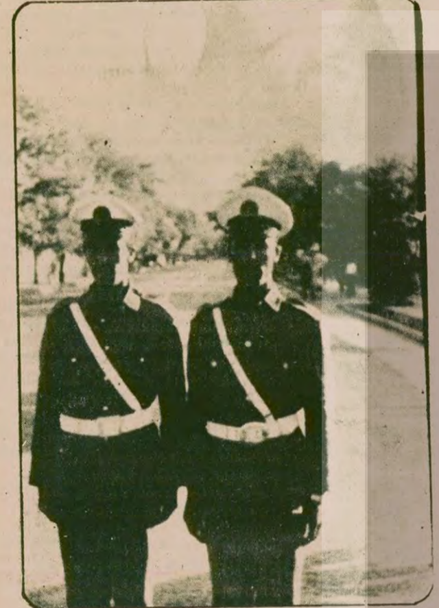
İşte Türkiye elçiliğinin önünden geçen yolun başı. İki polis 24 saat nöbette. Yolun sonu Dışişleri Bakanlığında ve 'Halk' sarayına gidiyor.