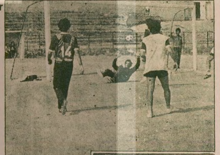
Beşiktaşlı futbolcular bir çalışmada

● Beşiktaşlı futbolcular iki ana taktik üzerinden çalışma yaptılar