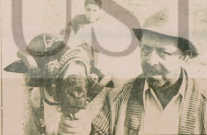
BU KOÇU ALAMAZSINIZI..