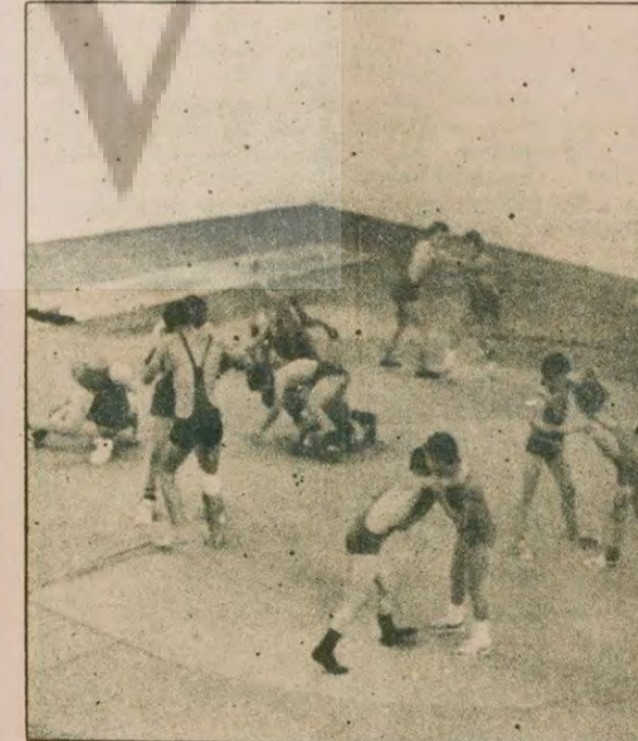
Çalışmalarını hızla sürdüren Tofaş-SAS minik ve yıldız güreş takımı

Trabzonsporlu futbolcuların kampa geç katılmaları konusunda daha fazla açıklama yapmaya yetkili olmadığını belirten Kiraz, Şenol, Serdar ve Turgay'ın kampa geç katılmaları gerekçe olarak uçak bulamadıklarını gösterdiklerini belirtti. Milli takım adaylarına erteleme maçları nedeniyle izin vereceğini belirten Kiraz, ancak bu futbolcuların pazartesi günü öğleden sonra milli takım kampına katılmalarını şart koşacağını söyledi.