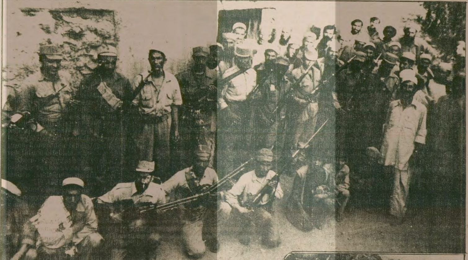
Afgan Müslüman gerillaları Moskova yanlısı Amin iktidarına karşı her gün yeni başarılar kazanıyor

THATCHER'İN AÇIKLAMASI Öte yandan BBC Radyosunun haberinde, İngiltere Başbakanı Bayan Margaret Thatcher'in NATO'nun silahlarını modernleştirilmesi gerektiğini söylediği belirtildi. Bayan Thatcher, "NATO silahlarını modernleştirme için güçlenmezse Sovyetler Birliği bunu daha çok siyasi baskı aracı olarak kullanır. Sovyetler Birliği'nin silahlanması savunmaya değil saldırıya yöneliktir" dedi.