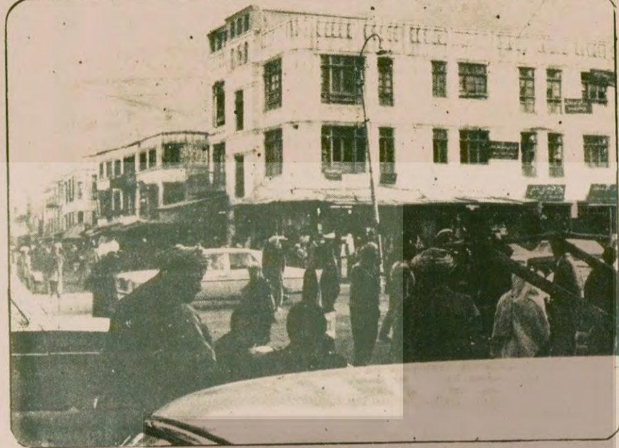
Halkların çoğu Türkmen. Tatlıcılar ise Özbek. "Yaş sen?" diye soruyoruz, "Elhamdülillah" diyorlar, ama hiç de neşeli görünmüyor esnaf.