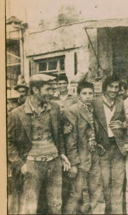
Samsun Saat Meydanında sabahın kör karanlığından akşamın geç saatlerine kadar bekleyen Samsun köylüleriyle konuştu. Ben 'seçim' derken Kavak, Çarşamba, Ahill, Susuzköy, Emilli, Kilkil, Erikli-Mahmutlu, Kovancık köylüleri şöyle döktüler içlerini: "Yağ yok, mazot yok, bir de bunların yanında iş yok. Sabahlan aksama kadar bir inşaatçılık alacak bizi diye ömür tüketiyoruz. Kimimiz bir haftadır iş bekliyor. Açlıktan anamız ağladı. Ne yüze oy diye önmüze çıkarıyor bu siyasiler."