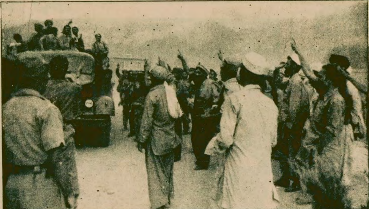
Afganistan'da Müslüman gerillalar Tarkı devrildikten sonra Sovyet yanlısı Amin yönetimine karşı da mücadeleyi sürdürüyorlar. İşte Kunar eyaletinde gerillalar, cepheye giderken...