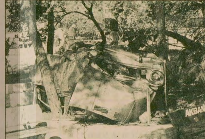
Freni patlayan oto, yol kenarındaki parmaklıkları kırdıktan sonra büyük bir ağacı devirdi ancak durabildi.