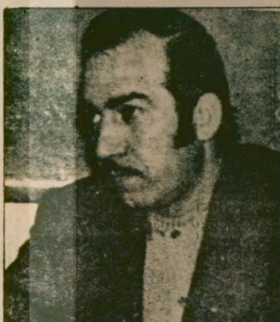
Filistin Kurtuluş Örgütü Başkomutan Yardımcısı Abu Cihad...

Özel olarak Türkiye ile Filistin halkları, genel olarak da, Türkiye ile Arap halkları arasındaki ilişkilerin niteliği, Türkiye'nin davamızı desteklemesi, bizimle dayanışması ve aynı zamanda rakı düşman-