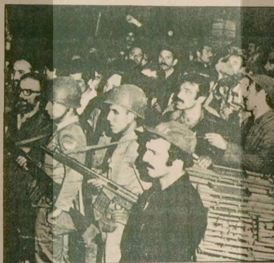
İrade beyanı uygulaması sakin bir hava içinde geçti. Demir Döküm işçilerinin her beyanı, Maden-İş'in sahteciliğine indirilen bir darbe oldu.