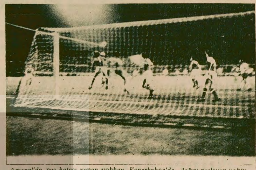
Arsenal'da pas hatası yapan yokken, Fenerbahçe'de doğru paslayan yoktu.

Oyunun genelinde, Arsenal'in bilinçli bir şekilde sahaya yayıldığı, Fenerbahçe'nin ise her hatında boşluk olduğu kendini gösteriyordu. Fenerbahçe, bir iki gol fırsatı yakaladıysa da berberlik nedeniyle bir sonuç elde edemedi.