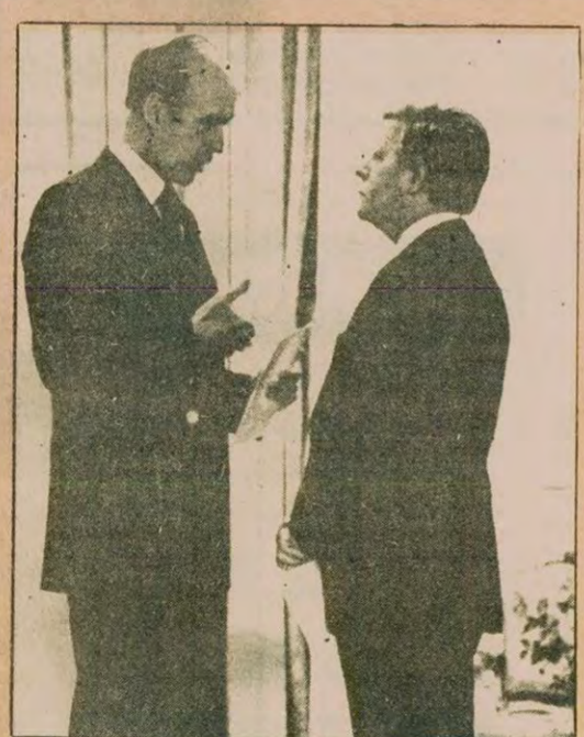
Fransa Devlet Başkanı Giscard d'Estaing ve Alman Başbakanı Schmidt