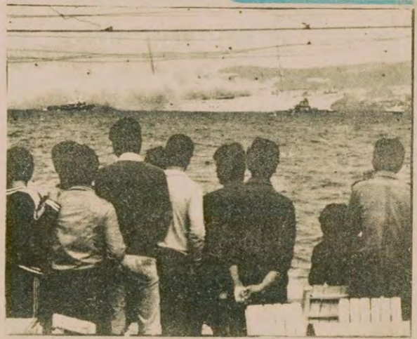
Ada sakinleri gemiden çıkan dumanları gördülerse de uzun süre Savarona'nın yandığına inanmadılar.

KORHAN ATAY Atatürk'ün içinde son günlerini geçirdiği, tarihi Savarona gemisi, dün sabah bilinmeyen bir nedenle çıkan yangın sonucunda büyük ölçüde tahrip oldu ve karaya oturduldu. Yangın sonucunda zararın milyonlarca lira olduğu bildiriliyor. Deniz Harp Okuluna ait eğitim gemisi Savarona'nın yananması olayı ile soruşturmayı Sıkıyönetim Askeri Savcılığı el koydu. (Devamı sa. 7, s. 7'de)