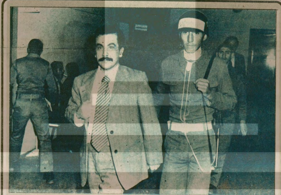
Gazetemiz baskıya girerken...

HABER MERKEZİ AP Genel Başkanı Süleyman Demirel, partisinin Kars senatör adayı Salim Dursunoğlu'nun öldürülmesi üzerine düzenlediği basın toplantısında, "Böylece Halk Partisi hükümeti idaresindeki seçimde kanlı demokrasi devrine girmiş bulunuyoruz" dedi.