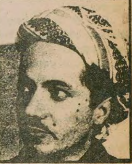
Mesut Barzani'nin, hükümet kuvvetleriyle çatışan güçleri desteklemediği iddia edildi.

"Aydınlık Gazetesi Yazı İşleri Müdürlüğüne: "28 Haziran 1979 tarihli Hürriyet Gazetesinde bir takım örgütsel faaliyetlerin bana maledildiğini gördüm. Daha önce de, örneğin 17 Mart 1979 tarihli Aydınlık, 12 Mayıs 1979 tarihli Tercüman gazetesi, hakkında bu tür yayınlar yaptılar. Bütün bu yayınlarda bana maledilmeye çalışılan örgütsel faaliyetlerle uzaktan yakından en ufak bir ilişkim yoktur. (Devamı sa.7, sü.5'de)