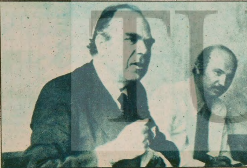
Sanayi Bakanı Orhan Alp "seçime iki hafta kala yapılan istifaları tasvip etmiyorum" dedi.

Orhan Alp: "Karaaslan'ın sekiz sayfalık diyeceği varmış da niye söylememiş"