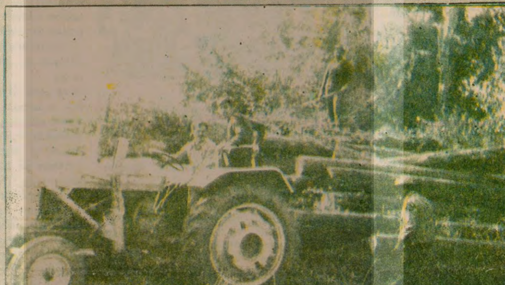
DEMEK OLABİLİRİMİŞ. Düzce Kereste fabrikası önünde bir faaliyet, bir faaliyet. Traktörler geliyor. Tomruklar yüklü dönüyor. 10 milyon değerindeki kereste için işçiler, "Birinci sınıf keresteydi. Şimdi odun niyetine satılacak. Hiç yoktan yine de iyidir" dediler.