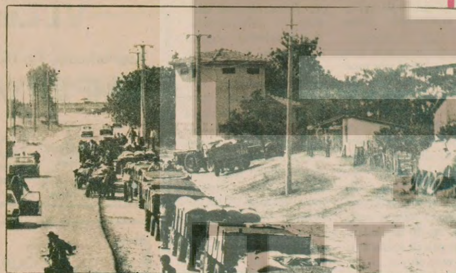
Ecevit: "Bir römork ayçiçeği satan köylü zengin oluyor"

Seçim gezisi sırasında Ecevit'in otobüsü, yol kıyısında sıralanmış traktörlerin yanından geçiyor. (üstte), Ayçiçeği yüklü römorkları göstererek CHP yöneticileri, üretici "bir römork ayçiçeği satıyor, 80 bin lira cebeyindiriyor, böyle para görmedi köylü" diyorlar. CHP Genel Başkanı Ecevit'de, konuşmalarında kalkınmayı köyden başlatıldıklarından bol bol söz ediyor. Gerekçe olarak ayçiçeği taban fiyatını 8 liradan 16 liraya yükselttiklerini söylüyor. Aynı yerden bir hafta önce geçen Demirel ise, "kalkınma kim, bunlar kim?" diyordu, boş traktörlerin önünde konuşurken. AP Genel Başkanı'na göre, bir römork buğday satan köylü traktörünün arka lastiğini bile alamıyor.