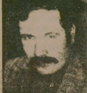
Bitlis Belediye Başkanı Muzaffer Geylani