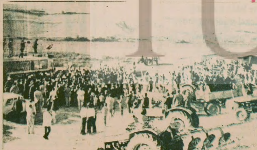
Demirel: "Bir römork buğday satan köylü traktörün arka lastiğini alamıyor"