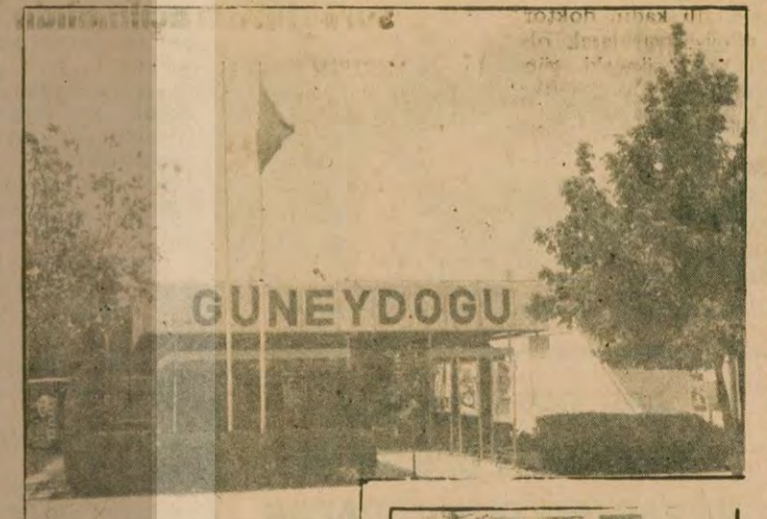
Gaziantep Sanayi Fuarında Güneydoğu Kooperatifler Birliği Pavyonu (Östte), ve Pavyondan bir bölüm. (Sağda)