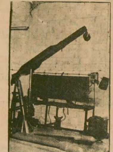
Gaziantep Sanayi Fuarında sergilenen vinçlerden biri...

Antep ile Malatya arasında sıkı bağlar olmuştur her zaman. Eskiden, ta Osmanlı zamanında, Antep üzerinden geçip Halep pazarlarına ulaşmış Malatya tüccarları. Oradan halı, kilim, kumaş, kalya, kuyum işleri, züccaciye, baharat, şeker, kahve, kına gibi şeyler getirirlermiş, Cumhuriyet döneminde Suriye ile Türkiye arasında sınır çekilince, bura insanları geçim için kaçmak için işi kaçırmışlar. Osmanlı devrinden kalma yapılar da, -Malatya'da da, Antep'te de- Halep çarşılarından almış yüklerle dönen develer rahat geçsin diye, çift kanatlı, yüksek kapılar bulunur hâlâ. Böyle yapılar belirlidir ki, eski tüccarların, kervan sahiplerinin evidir... Antep'in kaçakçılık merkezi bir kent olmasının nedeni, bu sonda çekilen sınırdır işte. Açık ticaret gizliliğe dökmüş, adına da kaçak-