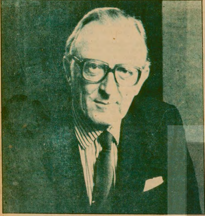
Dışişleri Bakanı Lord Carrington

İngiltere, Lusaka Konferansında varılan anlaşma uyarınca Zimbabve için bir anayasa taslağının anahatlarını hazırladı ve bu taslak bizim de izlediğimiz bir basın toplantısında açıklandı. Şu anda Zimbabve sorununa taraf olduğu belirtilen kuruluşlar Londra'da İngiltere Dışişleri Bakanı Lord Carrington başkanlığında sürdürülen bir konferansta bu meseleyi tartışıyorlar. Önemli bir belge olması ve halen Londra'da süren konferansta tartışılması nedeniyle 14 Ağustos'ta açıklanan bu Anayasa taslağı burada bir kez daha yayımlıyoruz.