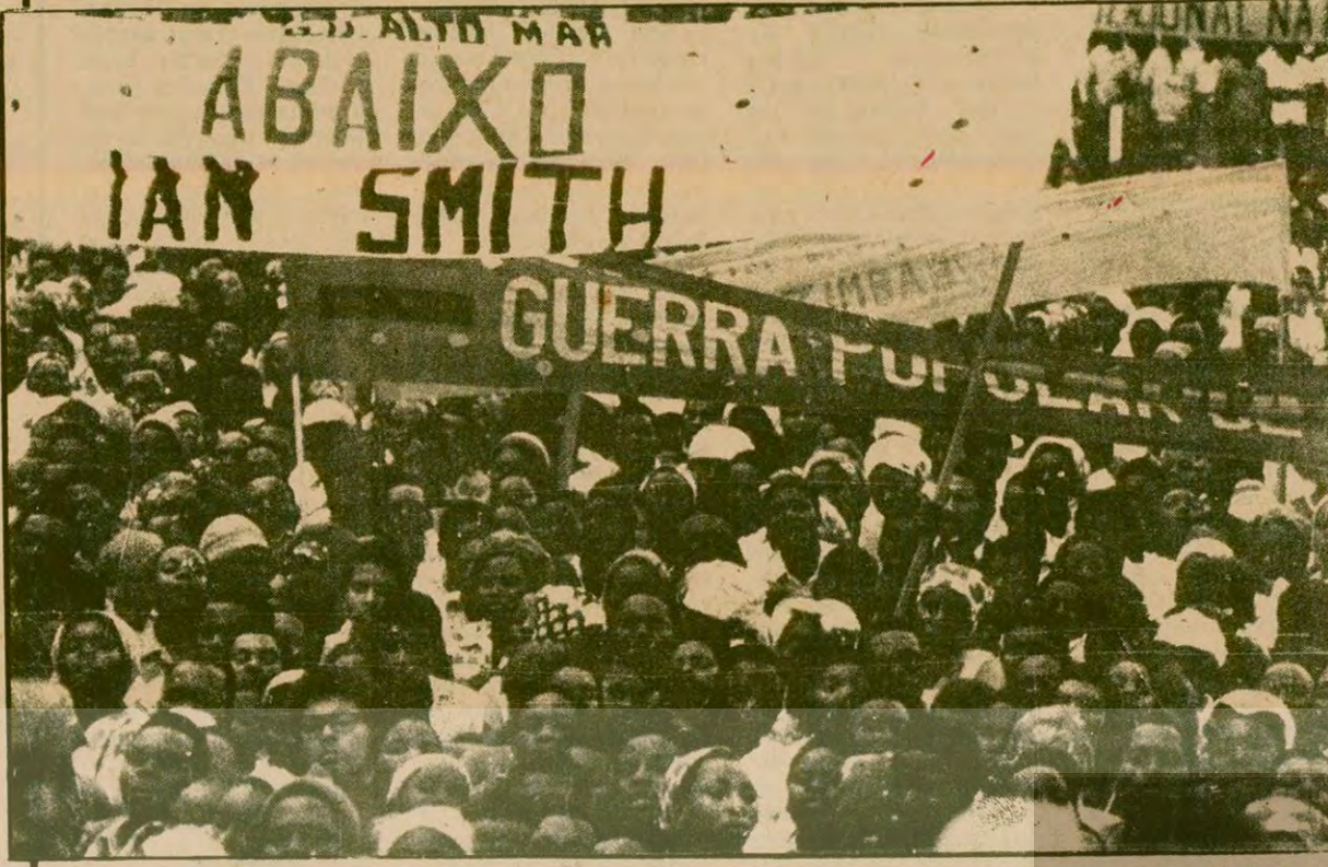
Londra'da Rodezya (Zimbabve) sorununa bir çözüm aranırken, Afrika ve tüm dünya halkları Zimbabve Yurtsever Cephesine destek oluyor. Fotoğrafta, Mozambik'te Zimbabve halkı lehine yapılan bir gösteri.