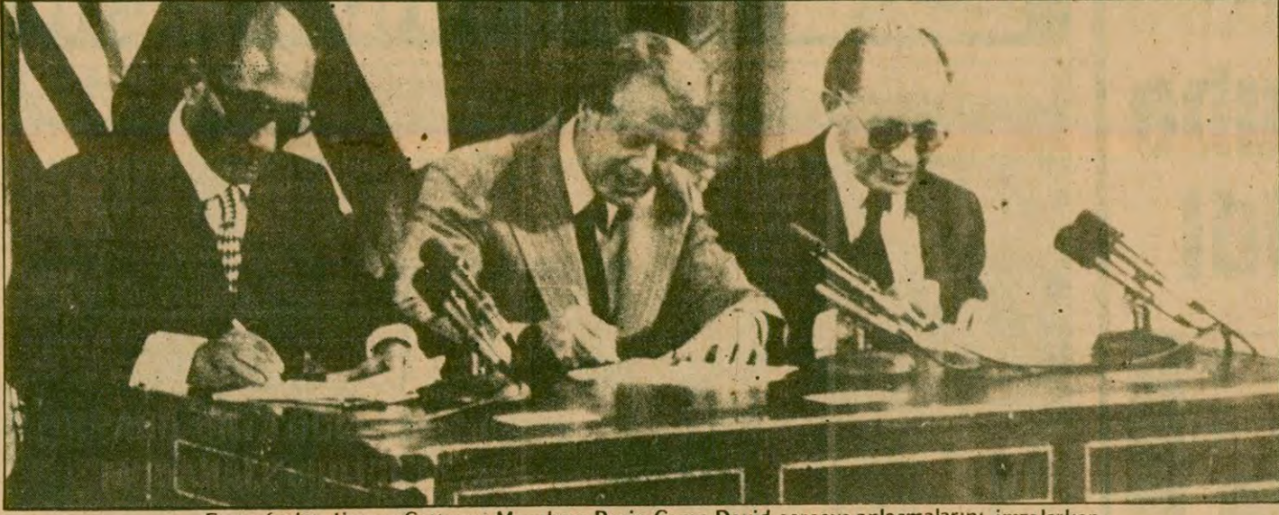
Enver Sedat, Jimmy Carter ve Menahem Begin Camp David çerçeve anlaşmalarını imzalarlar.