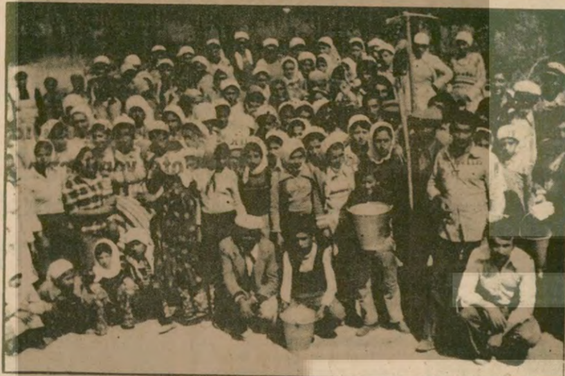
Fotografda daha önce direniş geçtiklerini duyurduğumuz Amasya Kazanmaz Beta Tohum Üretme Çiftliği işçilerini görüyorsunuz. Çoğunluğu oyun çağında olan çocuklar, yaşlı, genç, kadın, erkek işçiler şimdiye kadar asgari ücretin bile altında ücretle sigortasız çalış-

Haklarını aramak için sendikalaştıkları zaman da işveren hepsini topluca işten atmış. Şimdi oturma grevinde olduklarını söyleyen işçiler yasalar uygulanıncaya kadar direneceklerini belirtiyorlar.