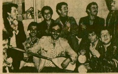
Tersane işçileri "Daha güncel, daha güçlü AYDINLIK" kampanyasını" saz çalıp türkü söyleyerek baslattılar

AYDINLIK KARTLARI SATIŞA ÇIKARILDI Ödeme olarak İsteme adresi: Molla Fenari Sok.37/2 Cağaloğlu—İstanbul Hesap numarası: İş Bankası Türkiye Şubesi,2267/İstanbul