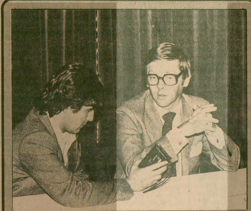
İsveç Başbakanı Ulla Ullsten, muhabirimiz Abdullah Güngör'ün sorularını cevaplıyor.

Vance ile Gromiko'nun bu hafta içinde görüşebileceği gelen haberler arasında.