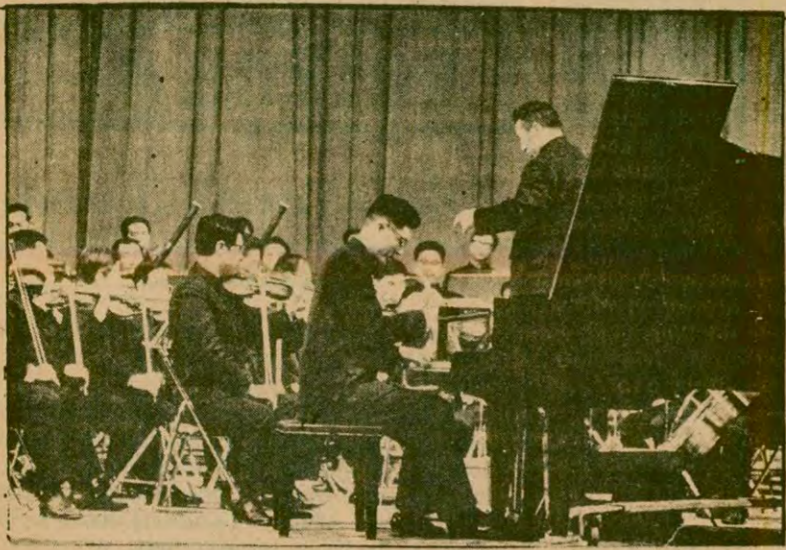
Çin Merkez Flarmoni Orkestrası Topluluğu bir konser sırasında