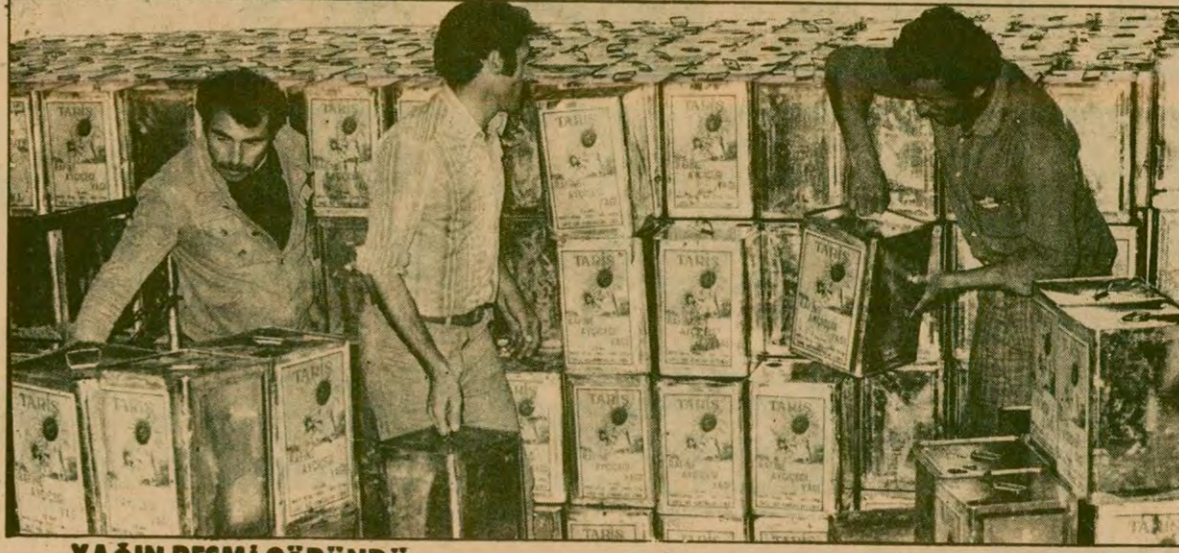
YAĞIN RESMİ GÖRÜNDÜ

TARİŞ'in bu hafta içinde piyasada satışa çıkaracağı yeni ayçiçeği yağlar İstanbul şube depolarına yerleştirilirken