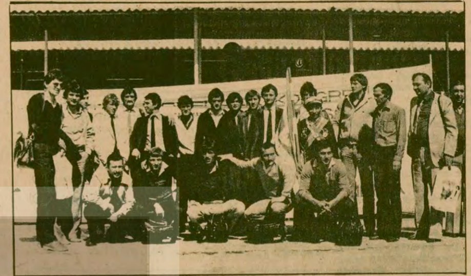
İstanbul'a dün gelen Kızılyıldız takımı

maçta iyi bir futbol göstermek ve ikinci tur için avantaj sağlayacak bir derece elde etmek amaçlıdır.