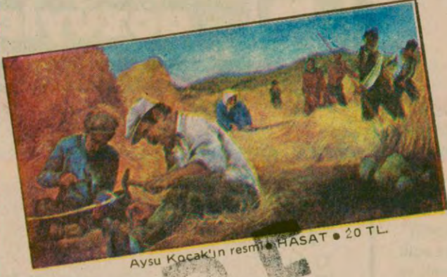
Aysu Kocak'ın resmi 'HASAT' • 20 TL