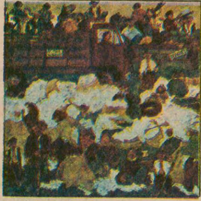
Faruk Cimok'un • Sarısık İnsanları • 250 TL

AYDINLIK KARTLARI SATIŞA ÇIKARILDI Gazetemiz, halkımızın desteğini sağlamak amacıyla AYDINLIK kartlarını satışa çıkarmıştır. Ödemeli olarak gönderilir. İsteme Adresi: Molla Fenari Sok. 37/2 Çağaloğlu-İstanbul Hesap Numarası: İş Bankası Türbe Şubesi 2267 İstanbul