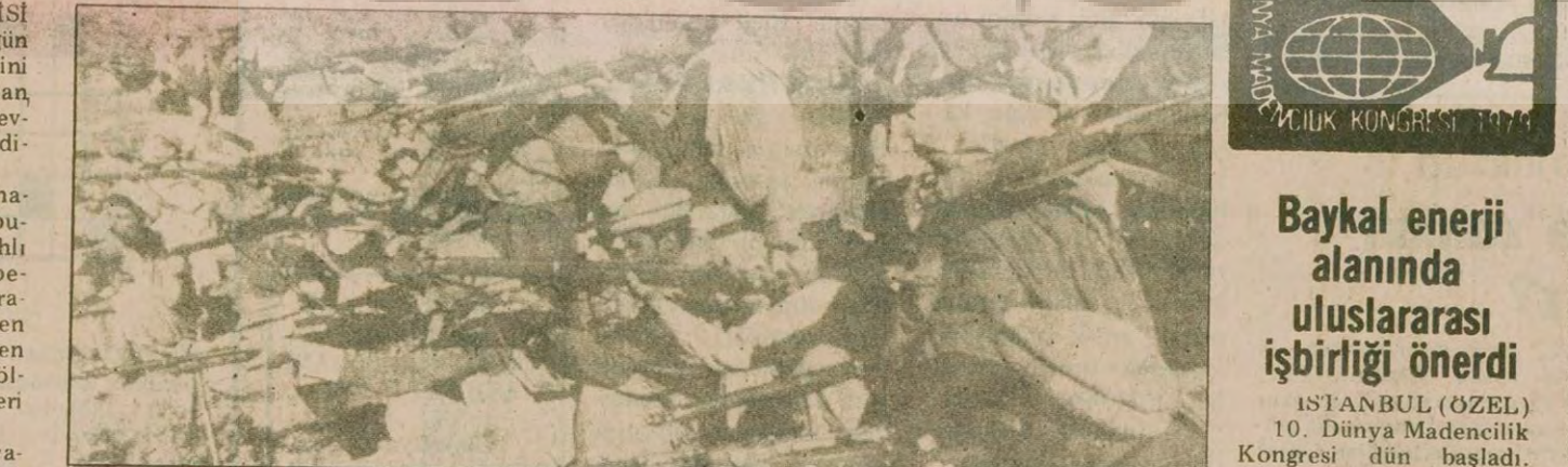
Moskova yanlısı iktidarı devirmek için silahlı mücadele yürüten gerillalar.

DIŞ HABERLER SERVİSİ Kabil Radyosunun, önceki gün ağırlık nedenleriyle istifa ettiğini bildiren bir haber yayımlamasından sonra Batılı ajanslar Taraki'nin görevin zorla uzaklaştırıldığını bildirdi. Çeşitli radyo ve ajanslar haberlerinde, önceki gün Taraki'nin bulunduğu Başkanlık sarayında silahlı atışmaların meydana geldiğini belirttiler. Bu çatışmalar sırasında Taraki'nin muhafızının öldüğünü bildiren ajanslar, geçen hafta görevlerinden alınan bakanların da ölümüne ya da yaralanmış olabilecekleri haberini verdiler. Tahran radyosu ise dün geceki yay-