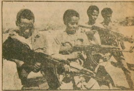
Eritreli çocuklar da kurtuluş mücadelesine katılıyor.

Rusya Afganistan'da, Amerika'nın Vietnam'da battığı gibi bir batağa saplanmış. Batıkça müdahalesini arttırmaktan başka çıkar yol bulamamaktadır. Ancak Brejnev'in de Afganistan cehenneminden kurtulması imkansızdır.