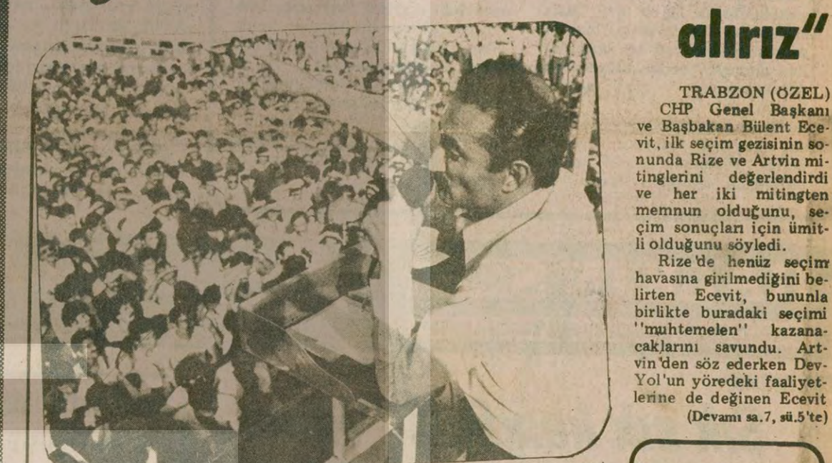
CHP Genel Başkanı "Hatay, Rize ve Artvin gezilerinin kendisine umut verdiğini" söyledi.

● Köyleri ve Kooperatifler Bakanı Ali Topuz Kütahya, Manisa ve Balıkesir'da konuşacak