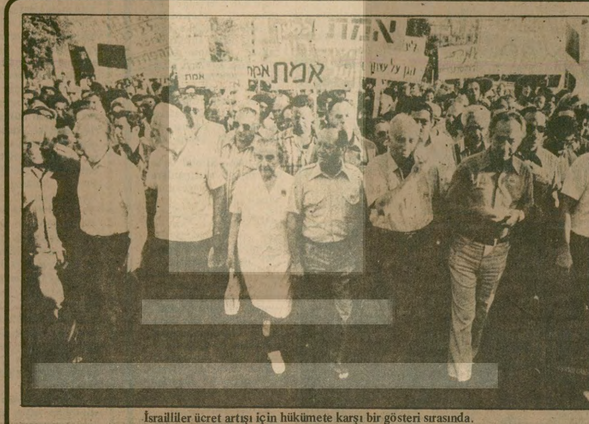
İsraililer ücret artışı için hükümete karşı bir gösteri sırasında.

Ürdün'de görülen kolera olaylarının 33'e yükseldiği, ancak ölen olmadığının bildirildi. Ürdün Sağlık Bakanlığında yapılan açıklamada, üç yeni kolera olayının geçen ay meydana geldiği belirtildi.