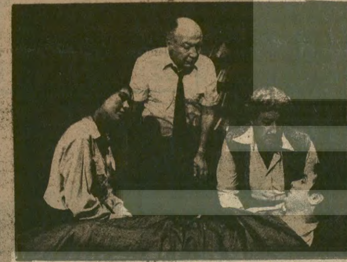
Bu yıl da sürecek olan "Ölü Kentin Nabzi" oyunundan bir görüntü.

Şehir Tiyatrolarında çocuk oyunlarına da 3 Kasım 1979 günü başlanacak.