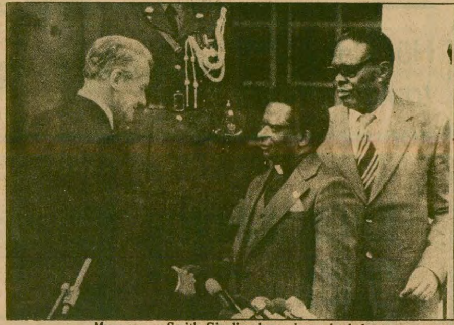
Muzorewa ve Smith. Şimdi araları açılmaya başladı.

Yurt dışında yaşayan 38 bin İsveçlinin oylarını koalisyon partilerine vereceği sanılıyor. Ancak gözlemciler bunun, sonucu değiştiremeyeceği görüşünde.