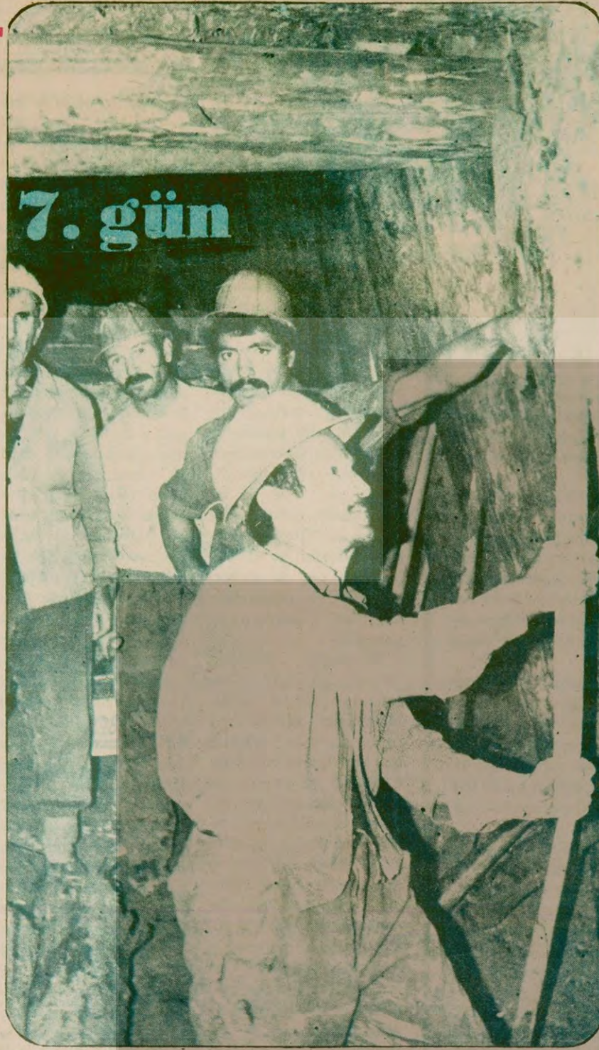
HESAPSIZ İŞLER: Su motoru borularının patlaması üzerine, kurtarma ekipleri bu sefer de boruları taşıyorlar dışarıya. Hesapsız işler yüzünden her an hayatları tehlikede.

İşletmeye bağlı Ankara, İstanbul, Zonguldak, (Devamı sa. 7, sü. 9'da)