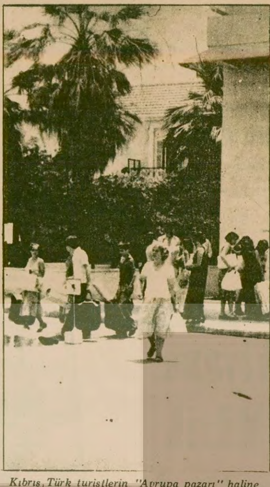
Kıbrıs Türk turistlerin "Avrupa pazarı" haline geldi. Yukarıda Avrupa mallarını bavullarına dolduranlardan bir kısmı.