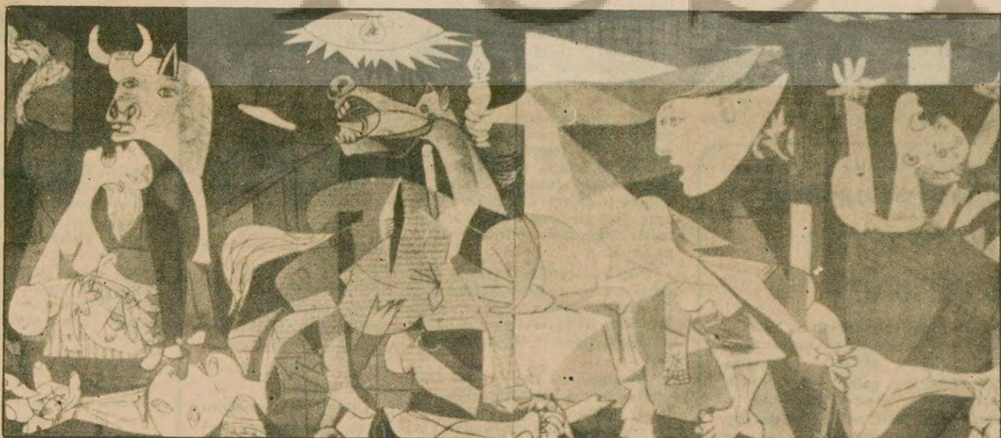
Picasso'nun ünlü tablosu

Guernica, vatani İspanya'ya geri dönüyor