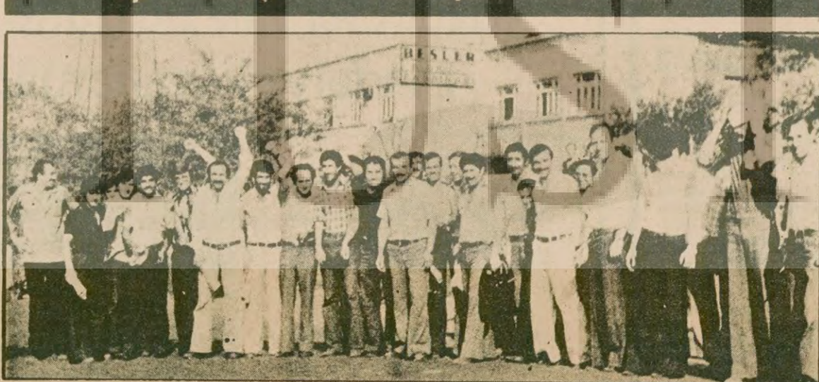
Uzun bir mücadele geçirmiş olan Ülker işçileri şimdi de kanun dışı lokavta karşı direniyor.

Bayram dönüşü fabrikanın kapısını kilitli buldular