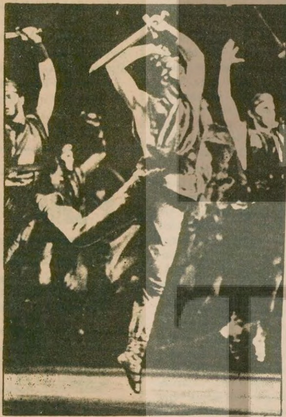
Bolşoy Bale Grubu