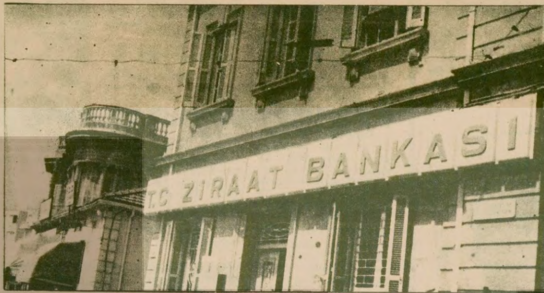
Lefkoşe'nin Saray Meydanında Türkiye'nin resmi bankası, Ziraat Bankası.

İSTANBUL (AA) Atatürk Eğitim Enstitüsünde 1978-1979 öğretim yılı yaz dönemi sınavları dün başladı. Atatürk Eğitim Enstitüsünde gündüz bölümü öğrencilerinin sınavları 08.30-13.00 saatleri arasında, gece bölümü öğrencilerinin sınavları ise 14.30-19.00 saatleri arasında yapıyor. Yaz dönemi sınavlarının 17 Eylül-28 Eylül tarihleri arasında, kış dönemi sınavlarının ise, 15 Ekim-20 Ekim tarihleri arasında yapılacağı bildirildi.