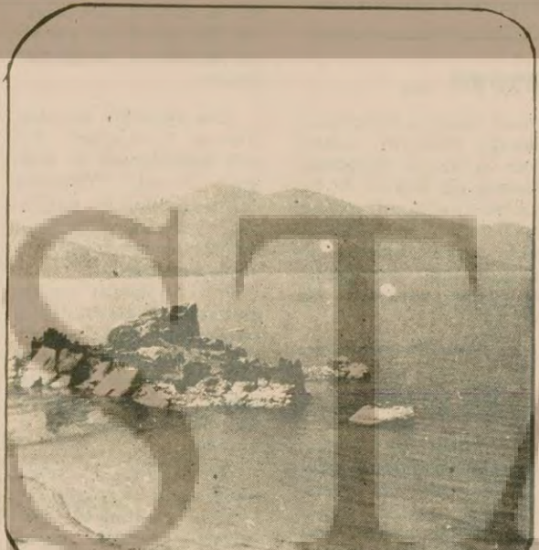
Kapukırtı köylülerinin elinden alınmaya çalışılan kumsal. Köylüler burada yazı geçirip balıkçılık yapıyorlar.