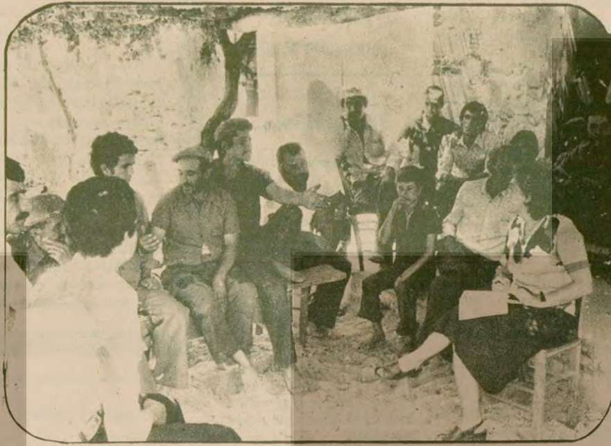
Kapukırtı köylüleri kooperatiften memnunar. Ama yazıklarının bulunduğu araziyi, hazine ellerinden almaya çalışıyor. Bunun için derli toplu köylüler, "Burası daha evvel bizimdi. Sonra kumsal saha diye Maliye buradaki evler için yıkım emri verdi" diyorlar.

GÖL köylüleri kamu- laştırmadan memnunar, ancak bunu yetmiş bulduklarını daha önce de belirttik. Ayrıca Dalyan tesisleri ve 50 dönümlük arazi için 2,4 milyon, gölden balık avlama hakkı olarak da 26 milyon olmak üzere Özbaşlara, toplam 28 milyon lira kamulaştırma bedeli verilmesini doğru buluyor köylüler. "Devletin bundan para alması lazım. 70-80 sene bol bol gölden ye, bir de devletten 28 milyon lira para kes. "Özbaş'a 28 milyon verilmesi doğru mu olur? Kiminmiş bu mal da bu parayı alacaklarmış? yıllarca da vergi kaçırmış.. Sercin köylülerinden