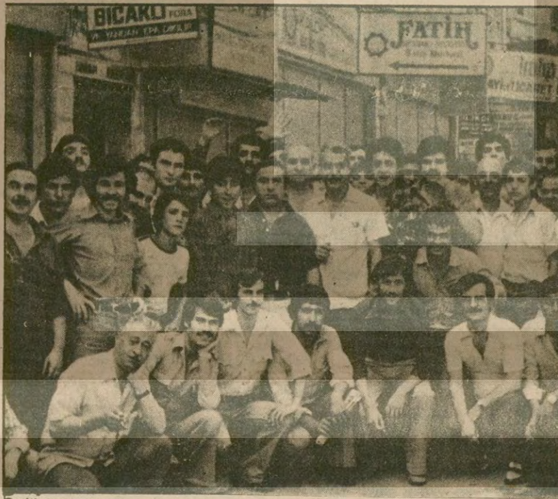
Bedikpaşalı kundura imalatçıları, imalathanelerini kapatıp önünde oturdular, "Ya sessiz kalıp yok olacağız, ya da direniş varolacağız, şimdi varolma mücadelesi veriyoruz" dediler.