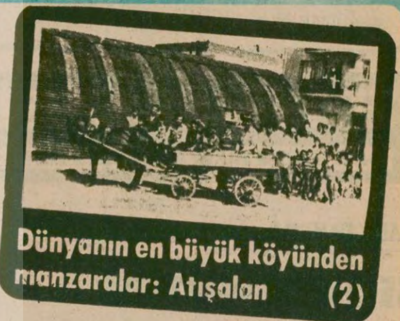
Dünyanın en büyük köyünden manzaralar: Atışalan (2)

Bir otobüs bu kadar insanı taşıyor mu? Taşımaz. Taşıyorsa o zaman da İstanbul'un en uzun kuyrukları Atışalan'da ortaya çıkar. Bazı İstanbullular sabah erkenden kalkıp et kuyruğuna girerken, Atışalanlılar da otobüs kuyruğuna girer. (solda)