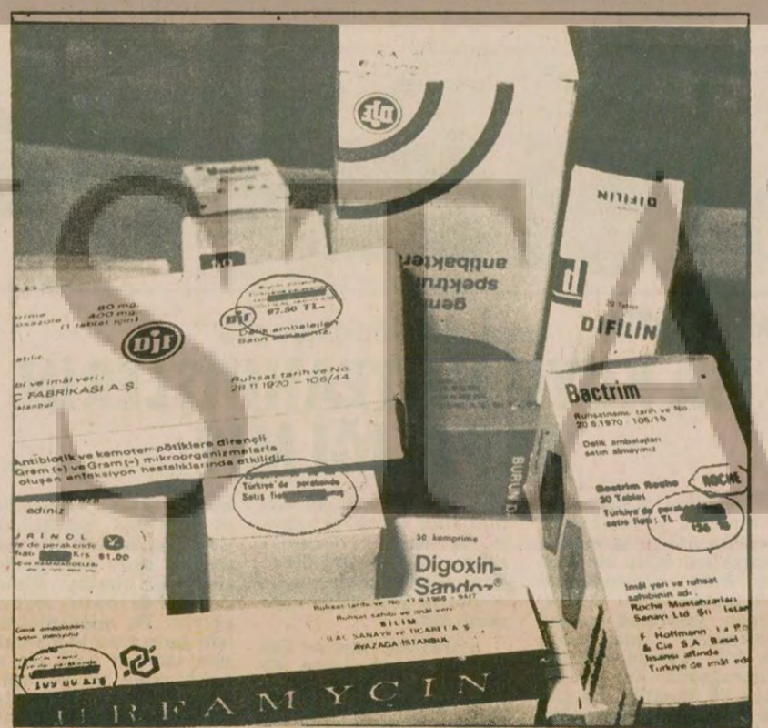
Son zamlardan sonra ilaç paketlerinin üzerine yeni fiyatlar damga ile basılıyor. Yüzde 200'e varan zamlardan sonra bir reçetenin yapılması 500-1000 lirayı buluyor.

ANKARA (THA) Ankara Bahçelievler'de 9 Ekim 1978 günü 7 TIP üyesini öldürmekten sanık silah sağ eylemcilerin duruşması bugün Ankara Sıkıyö- (Devamı sa.7, sü.4'te)