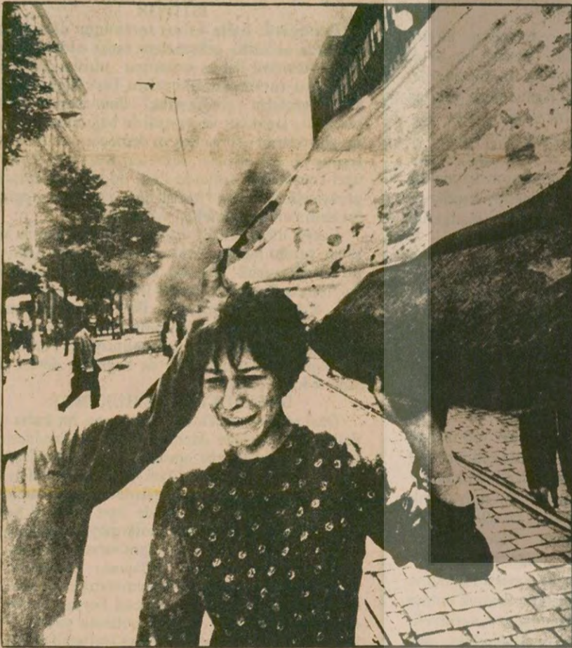
On bir yıl önce 20 Ağustos 21 Ağustos'a bağlayan gece sabaha karşı Rus tankları Çekoslovakya'ya girmişti. Çek halkı, o günden bu yana işgalcilerle karşı mücadele ediyor.