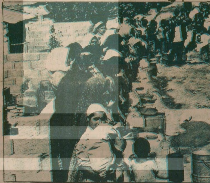
Atışalan köyü Fevzi Çakmak Mahallesi Kербela'lı Zamanlarının çoğunun kuyru başlarında geçiren bu insanlar bir kova su aldılar mı, dünyanın en mutlu insanı sayılırlar. (altta) "Su depo var ya işte karşımızdadır, içti su doludur, uğultusu kulakımıza gelmektedir, biz hastalarımız için bir damla su bulamıyoruz, gözümüz hep ordadır." diyor yaşlılar. (üstte).