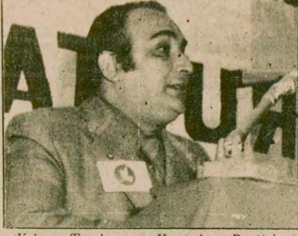
Kıbrıs Toplumcu Kurtuluş Partisi Başkanı Alpay Durduran.