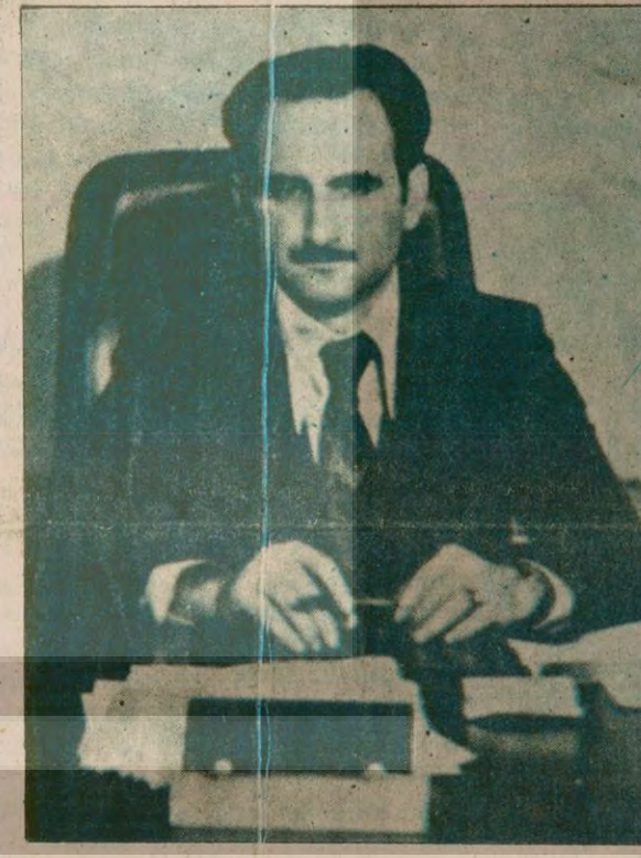
ODTÜ Rektör Vekili

Bunun üzerine halka rastgele ateş açan Apocular daha sonra olay (Devami sa.7, sü.9'da)