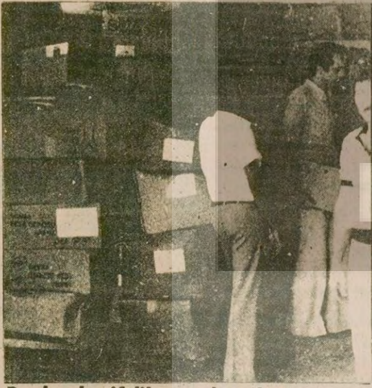
Bunlar da çiftlikten çıkan ilaçlar

Adana'da çiftliklerde ele geçirilen ilaçların sayımı yapıldı.