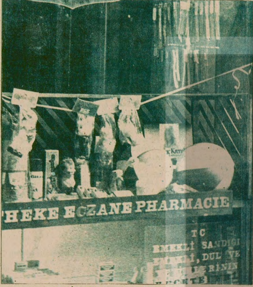
İşte bir eczane vitrini