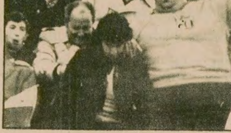
Bireyi birey olarak, narçayarak tek yönlü kullanarak, tek yönlü gelişim içinde aptalaştırarak meta durumuna sokarak ve sirk dizisine düşürerek, sporu geniş kitlelere uyutma aracı olarak kullanan burjuvazi bu yolla iktidarının omurgasını sure daha uzatabilir. Diktatör Videla'da bu yolu en iyi kullananlardan. Arjantin Dünya Kupasıyla kanlı katliamlarını bir sürede öldürdü. İşte macların havasına kapılıp kendini kaybeden seyirciler.

Bu kurallar neler olacaktır, nasıl olacaktır sorular şimdilik ancak bazı tahminlerle yanıtlanabilir. Tek başına kimse harcı değil bu kuralları koymak ve geliştirmek. Bu kurallar gerçek sosyalist toplumun sosyalist anlayışına yetiştirme felsefesine, eğitim anlayışına, spor felsefesine uygun olarak geliştirilecek ve temelinde gerçek sosyalist üretim biçimiyle biçimlenecektir. Ancak söz gelişi bu konuda bazı genel görüşler belirtmek isterseniz, şöyle diyebiliriz: Bireyin, insanın fiziksel yetkinliğini bir bütün olarak ölçmek gerektiğinde, bugünkü garip, tek yönlü uygulamaların her biri ortadan kalkacaktır. Aynı ayrı bireyler üzerinde salt süratini, salt dayanıklılığı ya da kuvvetini, becerinin çeşitliliğini ölçülmesi sisteminden vazgeçilecektir. Hatta bireylerin salt fiziksel yetkinliklerinin değil, entellektüel ve ruhsal yetkinliklerinin ölçülmesi düşünülebilir.