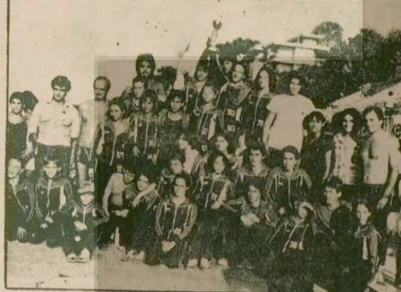
Şampiyonada 455 puanla üçüncü olan İstanbul Yüzme İhtisas Takımı Antrenör ve yöneticileri ile