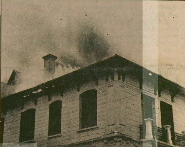
Yangın büyük hasara yol açtı