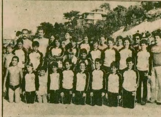
Türkiye birinci kume yaş grupları yüzme şampiyonu Altay Takımı