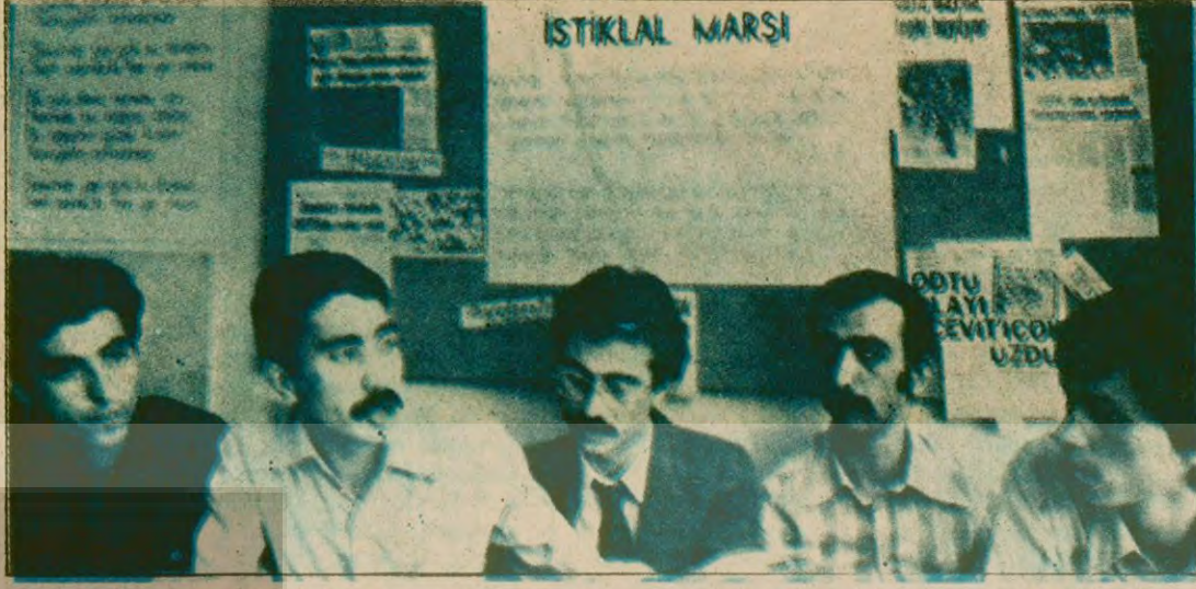
DGBF, Mem-Der ve diğer kuruluşlar ODTÜ'deki olaylarla ilgili olarak ortak basın toplantısı düzenlediler

ODTÜ öğretim üyelerinin düzenlediği yürüyüş saat 10.00'da başlıyor