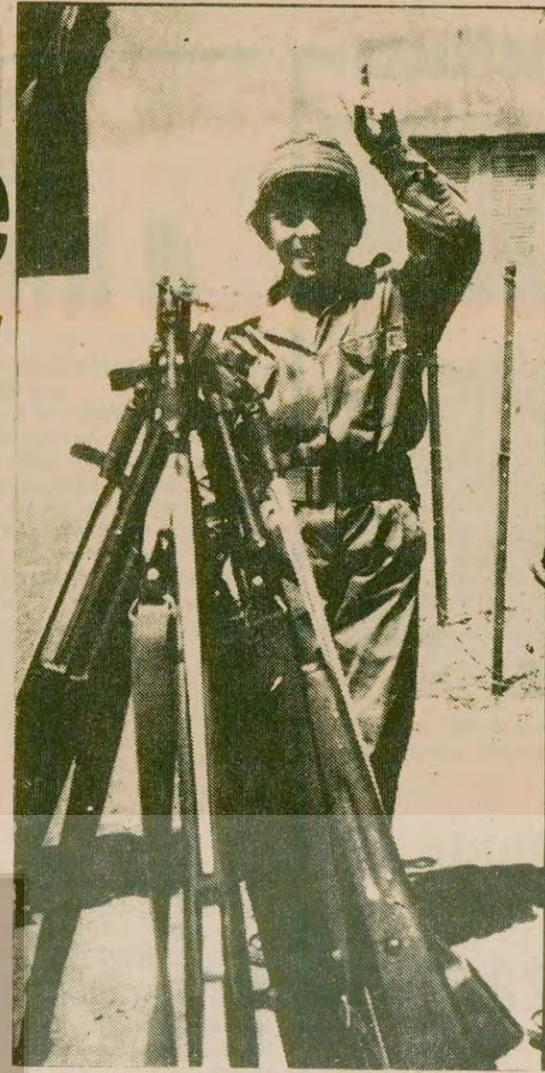
Filistinli bir çocuk gerilla eğitiminde

Galî, "Sovyetler, Başkan Sedat tarafından başlatılan barış sürecinde ABD ile işbirliği yapmak isterse, onlara sadece hoş geldiniz demek yeterli değildir"