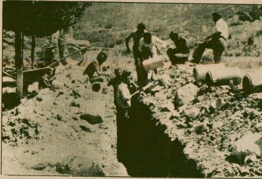
Fotoğrafta görülenler sendikali sigortalı işçiler değil, TC'nin devlet memurlarıdır. Ve yetkililere soruyorlar: "İşçi-memur arasındaki fark nedir. Yenen haklarımızın karşılığını kimden, ne zaman alacağız?"

Ote yandan Maden-İş'in 1977 MESS grevlerinden olduğu gibi bu yılki grup sözleşmelerinde de sahte TKP'nin UDC çabalarına bağlamakta geri durmadığı gözleniyor. Maden-İş Genel Başkanı Kemal Türkler bu niyetlerini 10 Ağustos tarihli Maha Ajansı tarafından dağıtılan açıklamada şu şekilde ortaya koymuştu: "Bu savaşımı, ilerici, demokrat güçler arasındaki eylem ve cephe birliğinin güçlenmesi ve pekişmesi için birlikteliğe dönüştürmek gerekiyor".