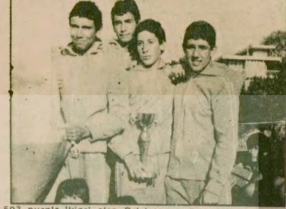
503 puanla ikinci olan Galatasaray yüzme takımının derece alan yüzücüleri birarada