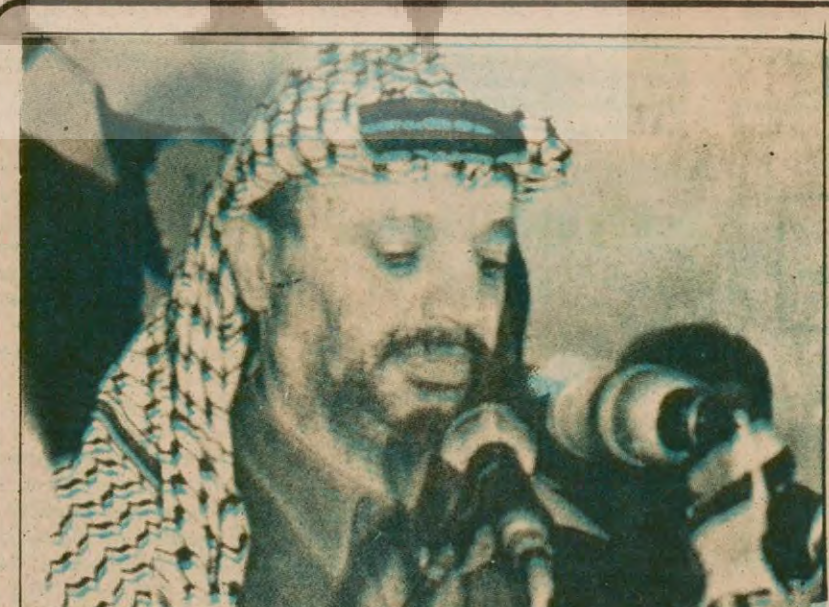
FKÖ Yürütme Kurulu Başkanı Yaser Arafat

Sağlamtaş Belediye Başkanlığı seçimini AP adayı kazandı