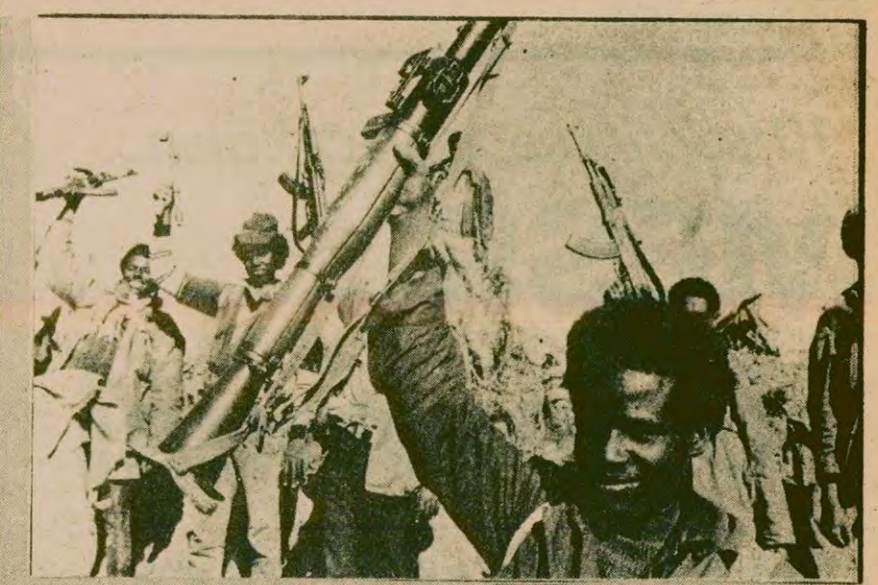
Eritre gerillaları Rus-Kıba desteğindeki Etyopya'ya karşı yeni başarılar kazanıyor.

Cossiga'nın kurduğu koalisyon hükümetinde Hristiyan Demokratlardan başka Liberaller ve Sosyal Demokratlar yer alıyor. Güven oylamasında Sosyalist Parti çekimser oy kullanırken, İtalya'nın ikinci büyük partisi İtalyan Komünist Partisi yeni hükümete güvenoyu vermedi.