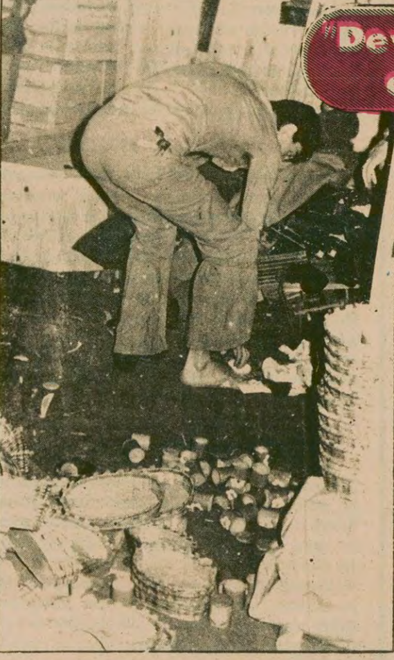
Tahrip edilen dükkanda sığınan hiç bir şey bırakmadı.

Vietnam işgali altındaki Kamboçya açlık tehlikesiyle karşı karşıya 7.SAYFADA