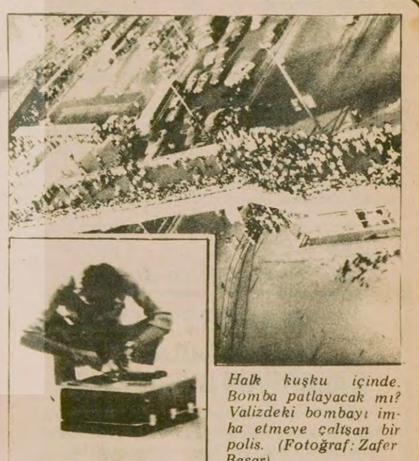
Halk kuşku içinde. Bomba patlayacak mı? Valizdeki bombayı imha etmeye çalışan bir polis.

TİKP Genel Başkanı Doğu Perinçek'in Aydınlık gazetesinde yayımlanan yazısında, kongrelerle diye bir kuruluş olup olmadığını, MIT ile birlikte hangi suçları işlediğini hükümetin suçları hakkında kanunları uygulamayı sorulmakta ve halkın bu sorulara cevap beklediği belirtilmekteydi. Bu sözlerle MIT'e hakaret edildiği iddia eden İstanbul basın savcılığı, Doğu Perinçek'in TCK'nın 159. maddesine göre cezalandırılmasını istiyor. Son açılan dava ile birlikte TİKP Genel Başkanı Doğu Perinçek hakkında çeşitli yazılarından dolayı açılan dava ve soruşturmanın sayısı yirmiyi aşmış bulunuyor.