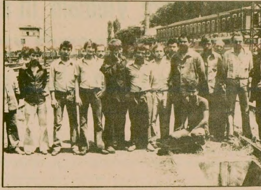
1977'nin ücretleriyle geçinmek durumunda kalan 45 bin demiryolu işçisi sözleşmenin bir an önce imzalanmasını bekliyor. Sirkeci Garında çalışan işçiler şöyle diyorlar: 'Elimize geçen 3 bin 500 lira ile sürünüyoruz. Bu parayla değil aile geçinmiyor, ev kirasını bile zor karşılıyoruz. Maaşlarımız 20 bin liraya çıkarılmalıdır.'

●İşçilerin talepleri arasında cumartesi gününün tatil olması da var