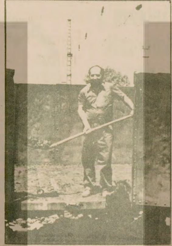
KIT'lerde en düşük ücretle çalışan demiryolu çalışanları, bir de Cumartesi günü tatil yapamazlar, çalıştırılır. Bakalım DYF-İŞ bu konularda işçilerin beklediği şekilde aktif bir tutum alabilecek mi?

İzin parası diye 500 liranın bir parçası verilmesini de eleştiren işçiler, sendikamız görüşmelerde daha aktif bir tutum almasını istedikler.