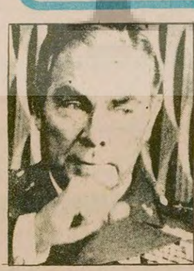
NATO eski Başkomutanı Aleksander Haig

yıkım için değil yapım için geldi ve İstanbul Belediyeler Birliğinin alt yapı çalışmalarının ikincisi (Devamı sa.7, sü.1'de)