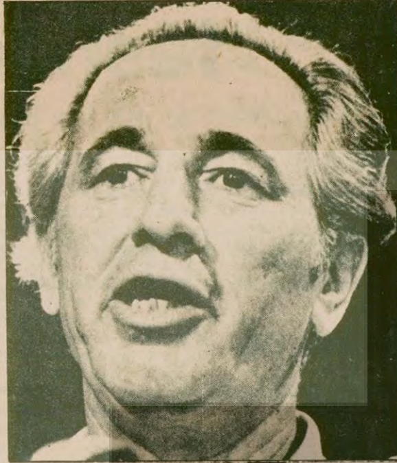
İsrail İşçi Partisi Başkanı Simon Perez

● İsrail Sina'nın bir bölümünden daha geri çekildi ● El Saika lideri öldü