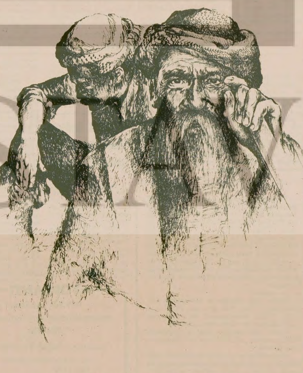
—Peki oğul, Kevok'un, Bey'in tersliği niye dir? —Bey beni berduş, Kevok yoksul beller.

—Ne sebep ararsın, gönülsüzdür de ondan der. Rispi Safo bildi ki Bey kararlıdır ve de karından dönmek. Bu işten hayır çıkmaz, diye düşündü. İzin isteyip ayrıldı. Memdız'ın yanan işiğini denkleyip vardı. Kapıda bir, iki öksürük içeri geçti. Memdız kavalmı bıraktı, doğrulup kalktı. Yer açtı. Uzandı Apo Safo'nun elini öptü. Halhatır sordu. Apo Safo beklemeyen girdi söze: —Şana acı haber getirmişim, dedi. —Senin getirdiğin acı başım, gözüm üstüne dedi. —Bey evinde senin doğuşun olur Memdız. —Şebep nedir Apo? —Sen hiç bir şey sezinlemedin mi oğul? —Sezinlemişim. —Nedir sezinlemediğin? —Apo, senin yanında bu sözleri etmek ayıptır. Utanc yüzümü karartır. —İznini ben vermişim. Kevok bana ters gelir. Ya Bey? O da ters gelir. Hacer Hanıma laf demeyesin. Demem. Peki oğul, Kevok'un Beyin tersliği niye dir? Bey beni berduş, Kevok yoksul bulur. Başka? Başkasını bilmem Apo. —Bil oğul, bil. Ben derim ki sebep bu degildir. —Ya nedir? —Ben de bilmem. Lakin yakında sebep kendini belli eder. Apo Safo maruz yığı. Kesesini çözüp tütin saracakken Memdız uzanıp keseyi aldı. Özene özene sardı. Tükürklemeden uzattı cigarayı. Apo Safo tükürkleyip bağladı kağıdı. Zin'in uzattığı ateşle yakıp derin duman aldı. Göz ucuyla sızdı Memdız'ı: Uzun boyluydu. Kara kaşlı, kara gözlüydü. Gözünün ucunda delice bir ışıltı dururdu. —Oğul, dedi... Hele bir sebebi görelim. Sebep Kevok'sa gözü dünya bokundaydı bize yaramaz. Beyse sebep, ki herhal öyledir, dağ