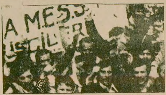
Maden-İş'in "MESS'i ezeceğiz" diye başlattığı ve MESS'in bütün prensiplerini kabul ederek sonuçlandırdığı ünlü grev tarihi "MESS ihaneti" olarak geçti.

İLAN MALATYA BELEDİYESİ BAŞKANLIĞINDAN 1- Belediyemize ait 44 ada 1 nolu parselde yapılacak iş hamı inşaatı 2490 sayılı kanunun 31. maddesine göre kapalı zarf usulü ile eksiltmeye çıkartılmıştır. 2- İşin keşif bedeli 11.190.017.- liradır. 3- Bu işe ait geçici teminat 33.670.050 liradır. 4- Eksiltme şartnamesi ve diğer evraklar Belediye Fen İşleri Müdürlüğünde görülebilir. 5- Eksiltme 16 Ağustos 1979 Perşembe günü saat 15.00 Belediye Encümeninde yapılacaktır. 6- Eksiltmeye girebilmek için aranan şartlar: a- Bayındırlık Bakanlığının arması oldukları (B) grubundan en az işin keşif bedeli kadar müteahhitin karnesi b- 1979 yılına ait Ticaret odası kaydının bulunması c- İsteklilerin kanuni adreslerinin bulunması d- Taahhüt beyannamesi sermaye ve kredi imkanlarını bildiren mali durum bildirgesi e- Plan ve teçhizat beyannamesi f- Teknik personel beyannamesi g- İsteklilerin teklif mektuplarını 16 Ağustos 1979 Perşembe günü saat 14.00'e kadar ihale Komisyon Başkanlığına vermeleri h- Yeterlik belgesi alınması için son müraعات tarihi 13. Ağustos 1979 Pazartesi günü mesai saati sonuna kadardır. 9- Telgrafla müracaatları ve postada vaki gecikmeler kabul edilmez. 10- Keyfiyet ilan olunur. Basın: 18776-746