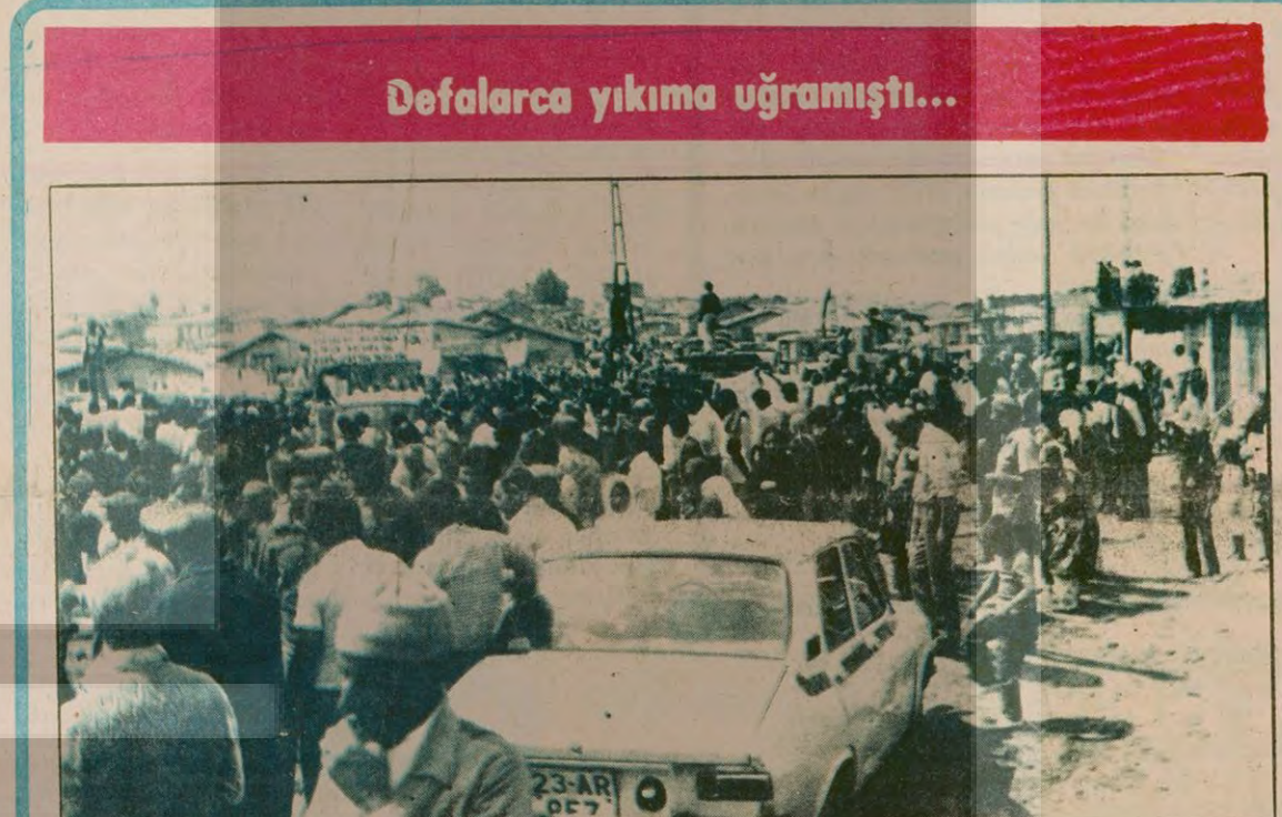
Defalarca yıkıma uğramıştı...

Kasım 1978'de yapılan AP Büyük Kongresinin hemen ardından yeni Temsilciler Meclisi toplandı. Selanik Caddesindeki Genel Merkez'de kapalı kapılar ardında yapılan toplantıdan çıkan haberler, AP'nin tabanında üç talebini parti yönetimine yansıttığını ortaya koyuyordu. (Devamı Sa.7; Sü:9'da)