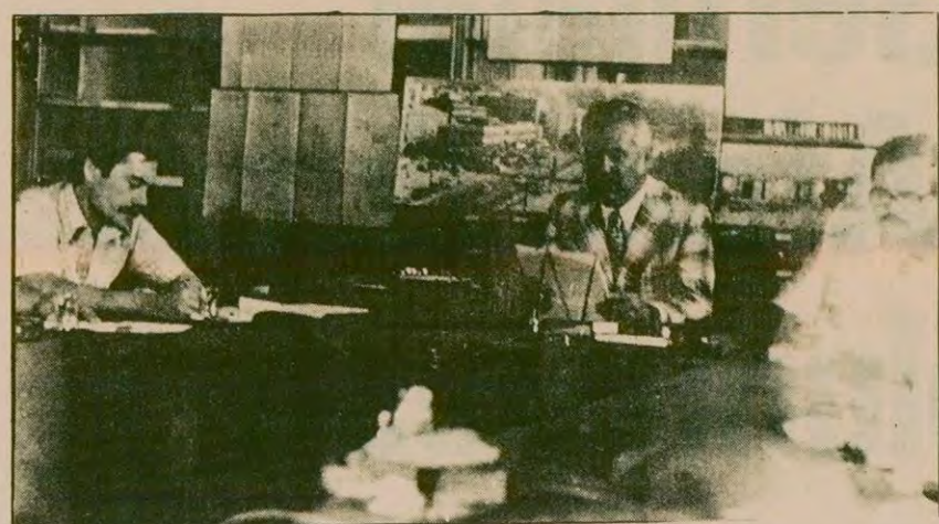
İzmir'de toplu sözleşme görüşmelerinde anlaşma olamıy. Bakanlar Kurulunun erteleme hakkı sona erdi. Genel-İş istekleri kabul edilmezse greve gitmekte kararlı. Resimde sendika şube yönetimi açıklama yaparken görülüyor.