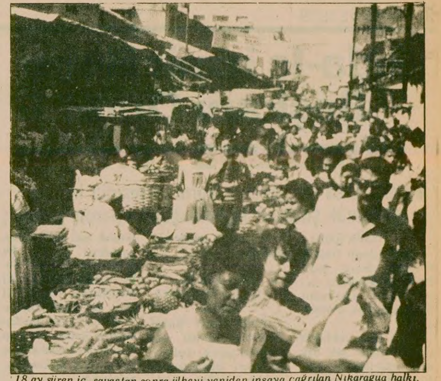
18 ay süren iç savaşın sonra ülkeyi yeniden inşa çağırlan Nikaragua halkı,

Yunanistan ile Suriye, beş anlaşma imzaladılar. Bu anlaşmalar özellikle teknik, bilim, kamu sağlığı, ticaret ve turizm alanlarını kapsıyor.