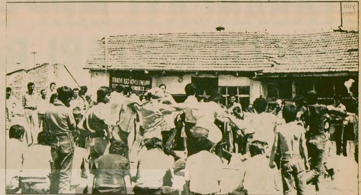
Apocuların tahrip ettiği lokali 10 gün içinde onaran, onarılmasına maddi, manevi destek gösteren Tuzluçayır halkı sayesinde TİKP Tuzluçayır lokali ikinci kez törenle açıldı. İkinci kez halaylar çekildi.