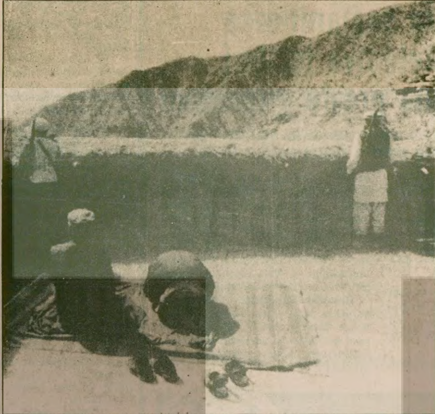
Gerilla savaşları için elverişli bir coğrafi duruma sahip olan Afganistan'da dağlar dan etrafta gözleyen Müslüman gerillalar.

●Kabil'den Herat'a gelen bir otobüs dolusu Tarakici öldürüldü