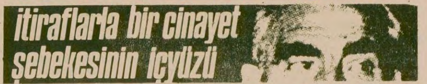
İtirafıyla bir cinayet sebekesinin İyildü