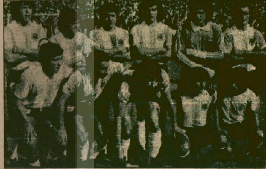
1978 Dünya Kupasını alan Arjantin'in İspanya'da ne yapacağı şimdiden merak konusu olmaya başladı.

kararlaştırılacak. Balkan ülkelerinin Bisiklet Federasyonlarının katıldığı toplantıda, prensip olarak turun Atina'dan başlatılması kararlaştırıldı. Beş ana bölümün Atina-Istanbul-Sofya-Belgrad-Bükreş olarak belirlendiği, ancak bunun kendi içinde de etaplara bölünebileceği belirtildi.