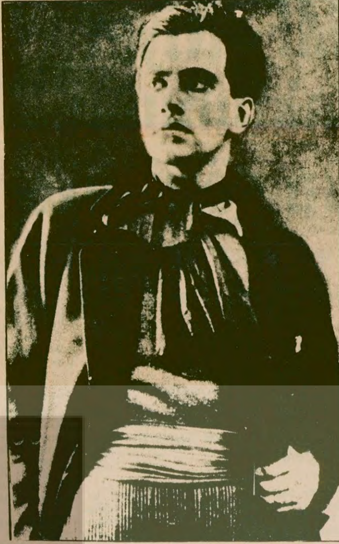
"Livadia Sarayında şiirlerimi köylülere okudum. Geçen ay Bakü doklarında, Bakü'nün Schmidt fabrikasında, Chaumon kulübünde, Tiflis işçi kulübünde de okudum. Yemek molasında, mahinaların sağır edici gürültüsü arasında, torna tezgahı üzerinde okuyordum."