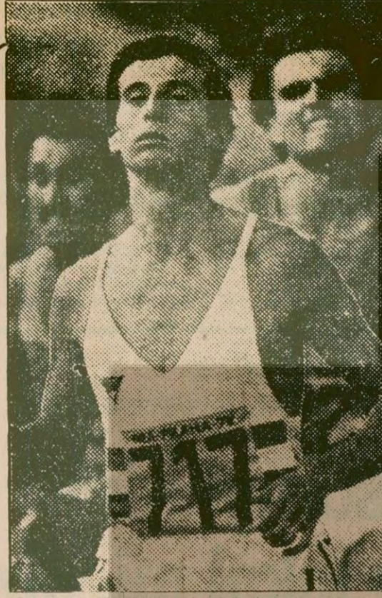
Moskova Olimpiyatlarında büyük dereceler yapması beklenen Sebastian Coe.

Bu arada dört yıl süreli ve Türkiye'nin bütün illerinde birinci sınıf yerlerde geçerli olmak üzere, çeşitli şampiyonalarda ilk dereceleri elde edenlere de serbest giriş kartları veriliyor.