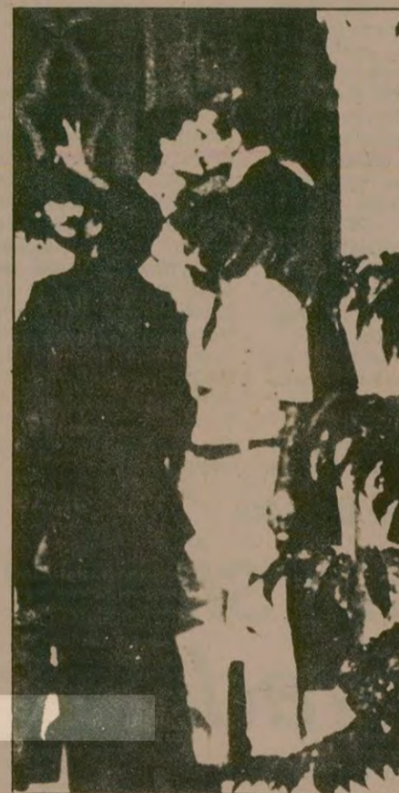
Binadan çıkan tedhişçilerden biri İçişleri Bakanını öptü.