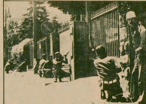
Sabahın ilk saatlerinde güvenlik görevlilerinde bir kıyırındanma oldu. Keskin nişancılar hazırılık içinde.