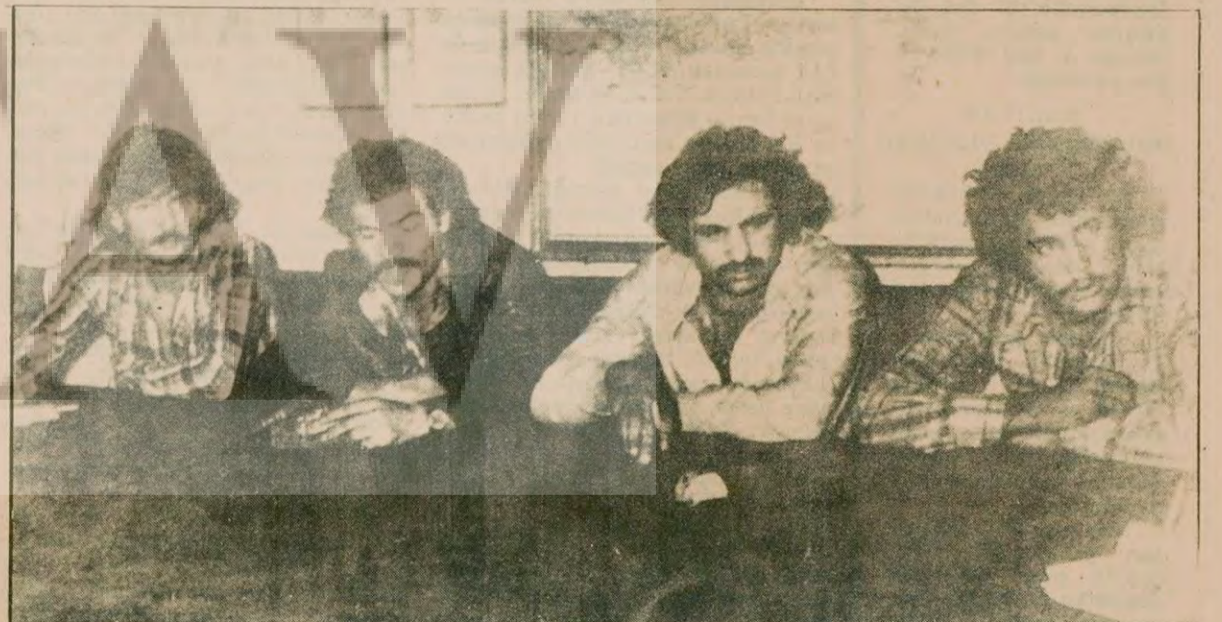
Dört terörist, Emniyet Müdürlüğünde basına gösterildi.