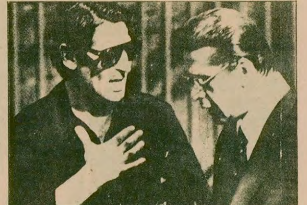
Teröristlerle görüşen heyetten bir kişi 08.05'de dışarı çıkarak, İçişleri Bakanına "5 dakika sonra teslim olacaktır" dedi.