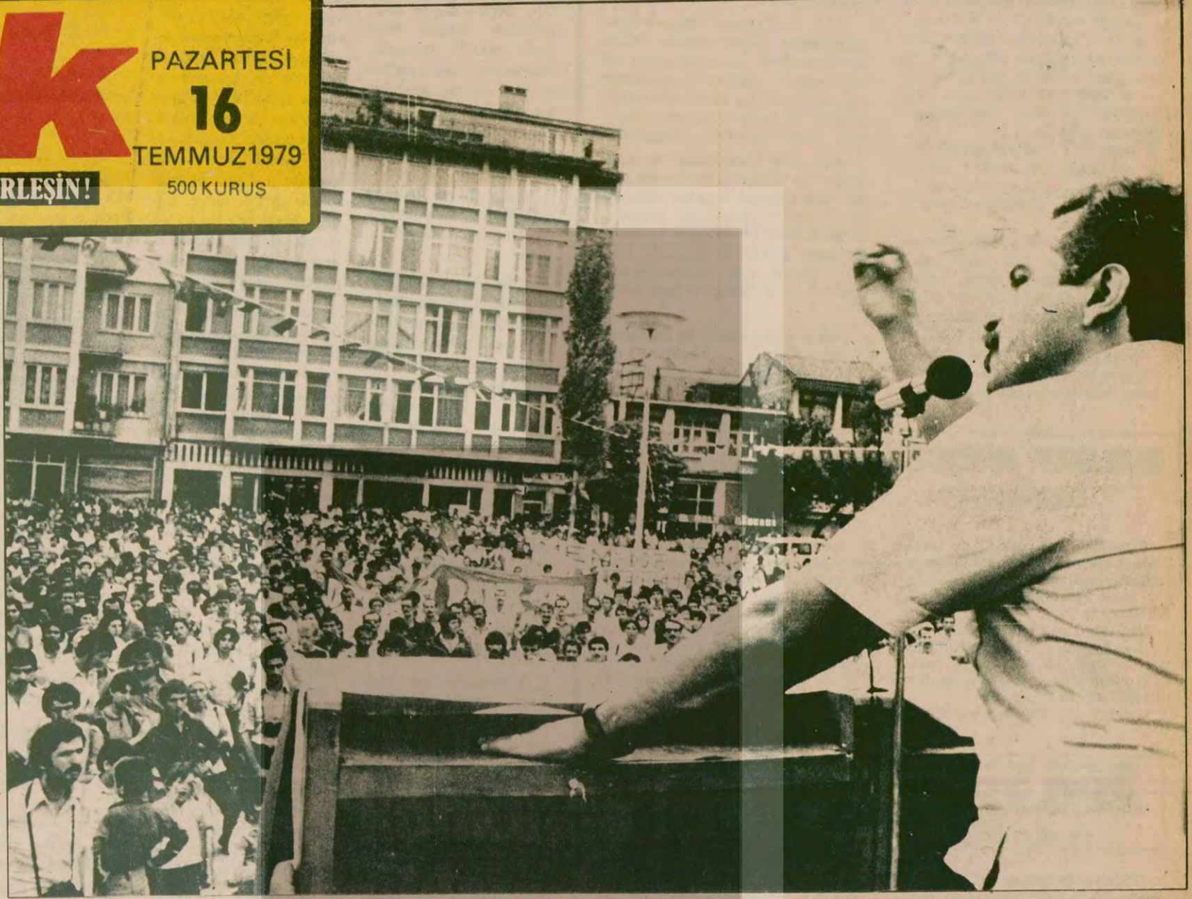
SEVİNÇ VE GURUR: 3 bin kişi miting alanına toplandığında yürüyüşçülerin yüzünde yorgunluk değil, halkın bağımsızlık tutkusunu temsil etmenin gururu ve sevinci vardı. Mitingde konuşan TİKP Genel Başkanı Perinçek şöyle dedi: "Halk kararını vermiştir." U-2 UÇAMAZ, RUSYA GEÇEMEZ."