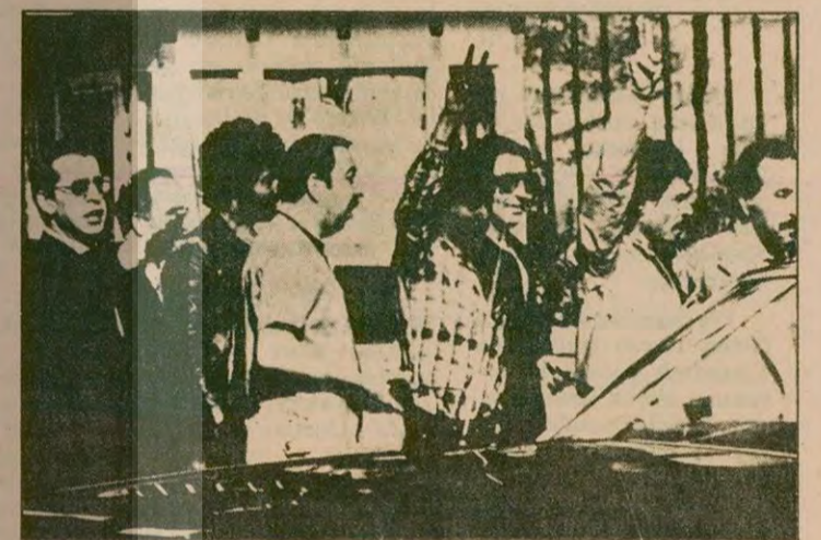
Teslim alınan teröristler, Emniyet Müdürlüğüne götürüldü.