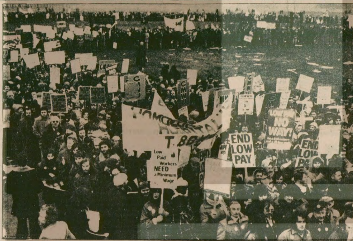
İngiltere'de Thatcher hükümetinin sendikal hakları kısıtlayan tasarılarına karşı sendikalar sert tepki gösteriyor