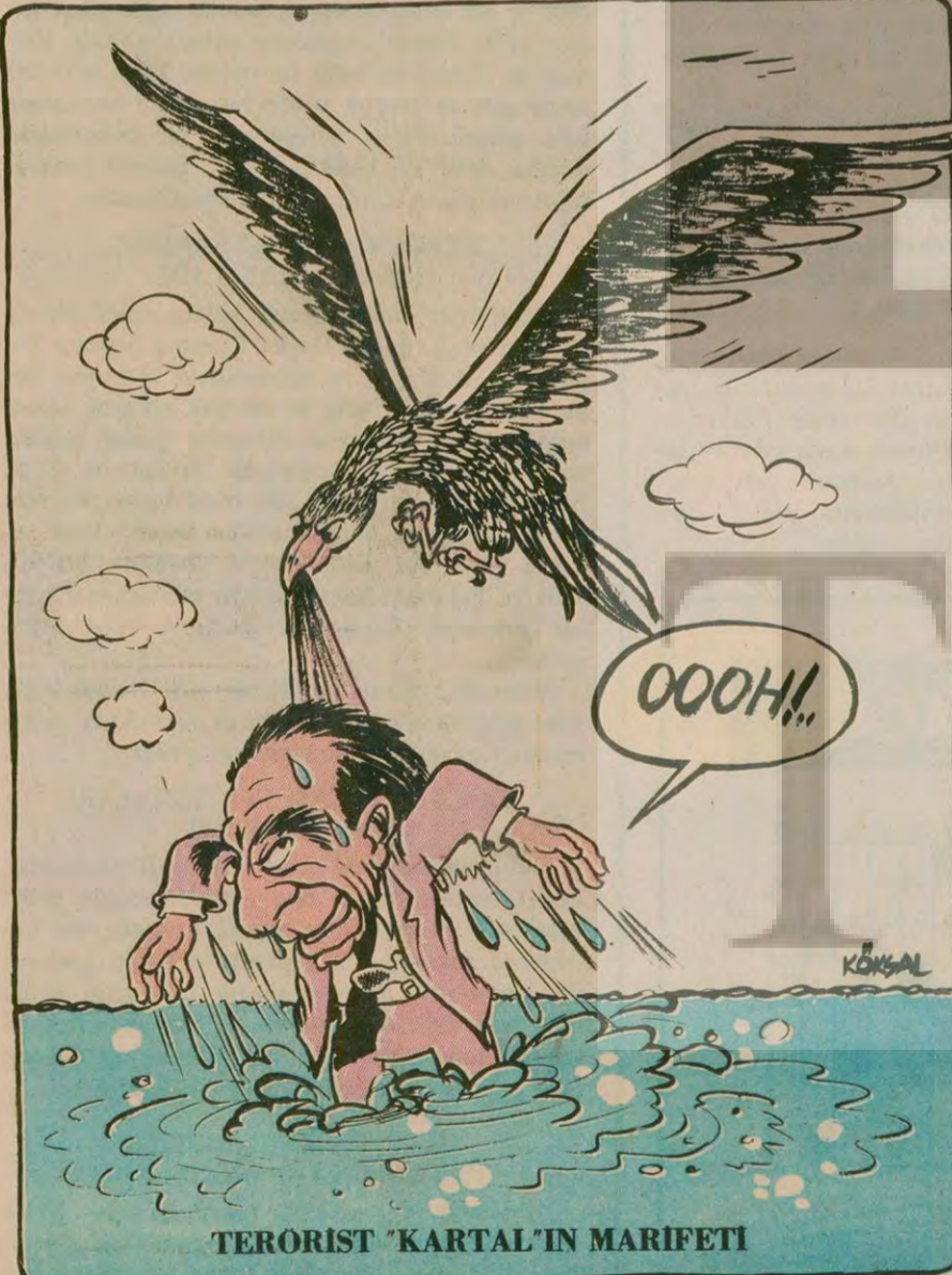
TERORİST 'KARTAL'IN MARİFETİ

Yürüyüşçülerden biri, "İyi ki gelmişim, anlatsalar inanmazdım" diyor. Bir diğeri atlıyor: "Bu iki günü ve geceyi anlatabilmek çok zor. Görmeyince, yaşanmayınca nasıl anlatılır ki." (Devamı sa.7, sü.5'de)