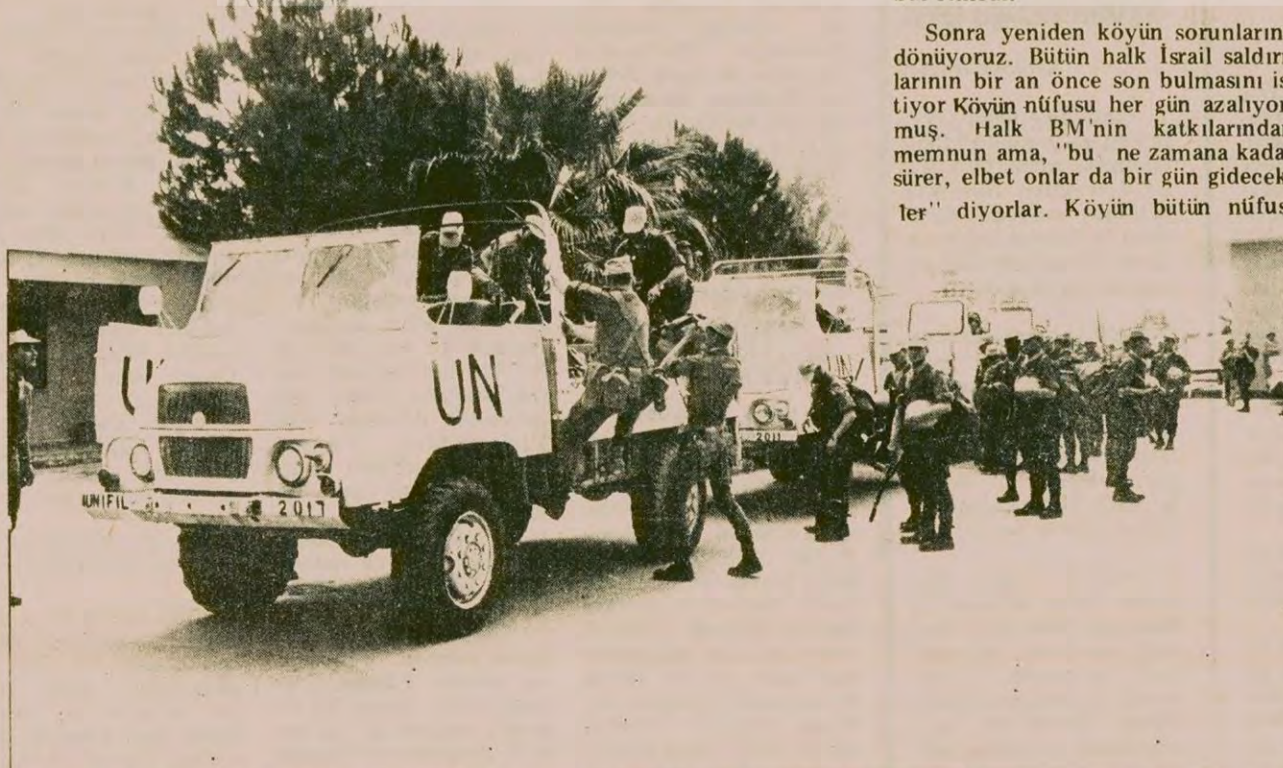
Fransız birliğine bağlı askerler Sur kentindeki BM merkezinden hareket etmek üzere cemselere biniyorlar.

YARIN: BM askerleri, İsrail ve Filistin hakkında ne düşünüyor?