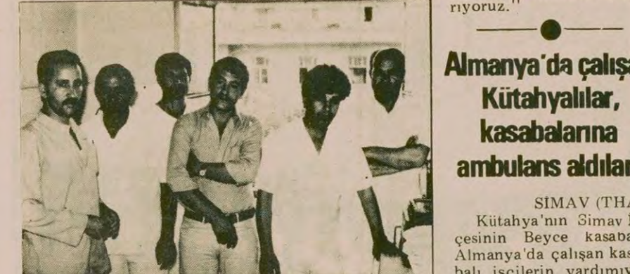
"Tam Gün Yasası"nın tüm hastane çalışanlarına eşit olarak uygulanmasını isteyen personelden bir grup.

Hastabakıcı unvanı olan emekçilerin gerekçesi ile "Tam Gün Yasası" kapsamına alınmayan hastane personelleri değil, hastabakıcıların, hemşire ve doktorların yapmaları gereken işleri yapıyorlar. Her gün, ameliyat yapı-