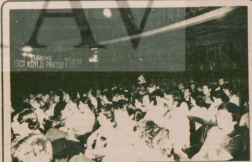
Bursa'daki U-2'leri protesto toplantısına kalabalık bir halk topluluğu katıldı

● Yakalananlardan sekizi serbest bırakıldı, diğerlerinin de bırakılması bekleniyor