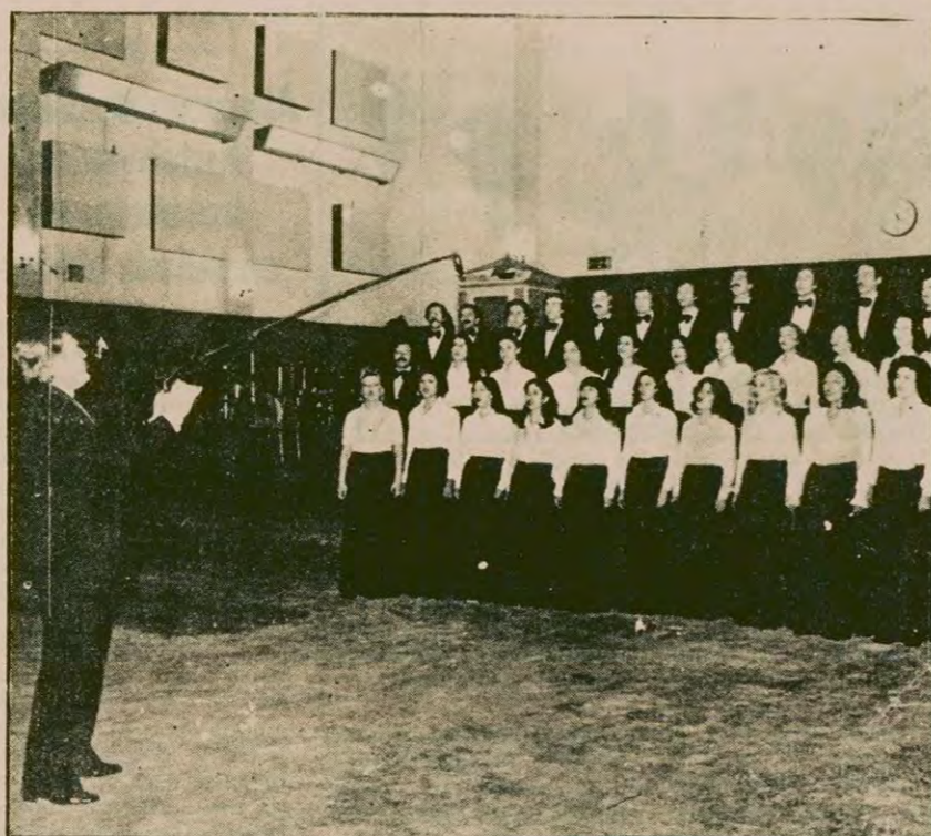
TRT Ankara Radyosu Çok Sesli Korusu.

Yer: Açıkhava Tiyatrosu. Saat: 21.30. Fiyatlar: 200, 150, 100, 75, 50 lira.