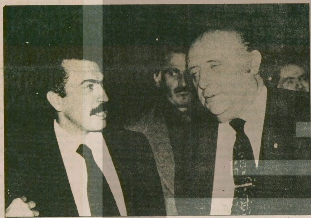
Demirel, Doğu Perinçek'in "Rusya'nın yıkıcılığına karşı açık tavr almıyorsunuz" uyarısına, "bunlar devletin meseleleridir" şeklinde cevap verdi.

AP ve TIKP Genel Başkanları Ankara Gazeteciler Cemiyetinin geleneksel toplantısında karşılaştılar