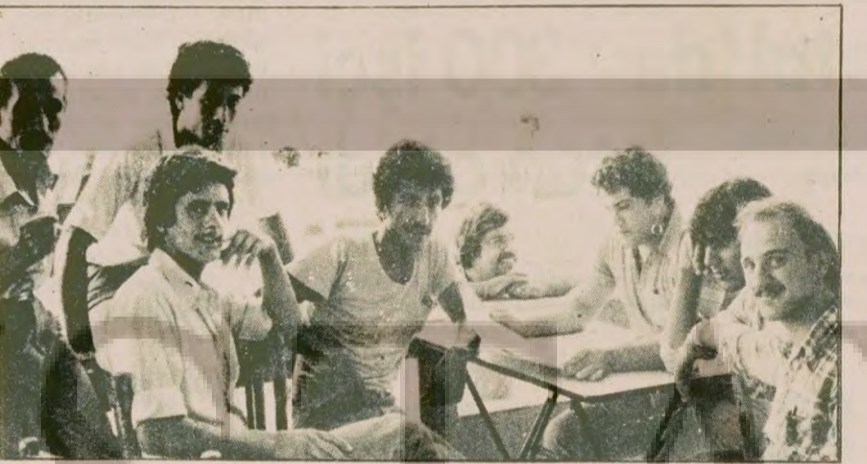
Gana kahvesinde sohbet

— Bakın mesela Mısır'da Enver Sedat var, cin gibi zeki bir adam. Oturdular barış yaptı. Şimdi orada savaş bitti!