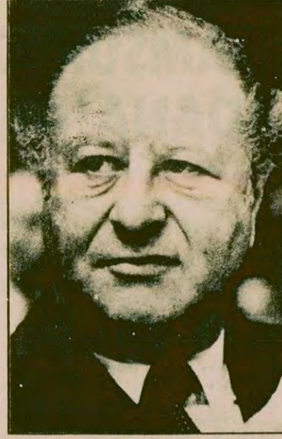
Avusturya Başbakanı Kreisky.