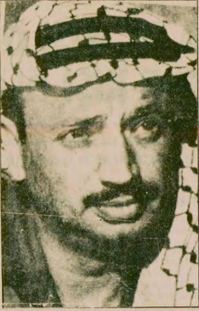
FKÖ Lideri Arafat