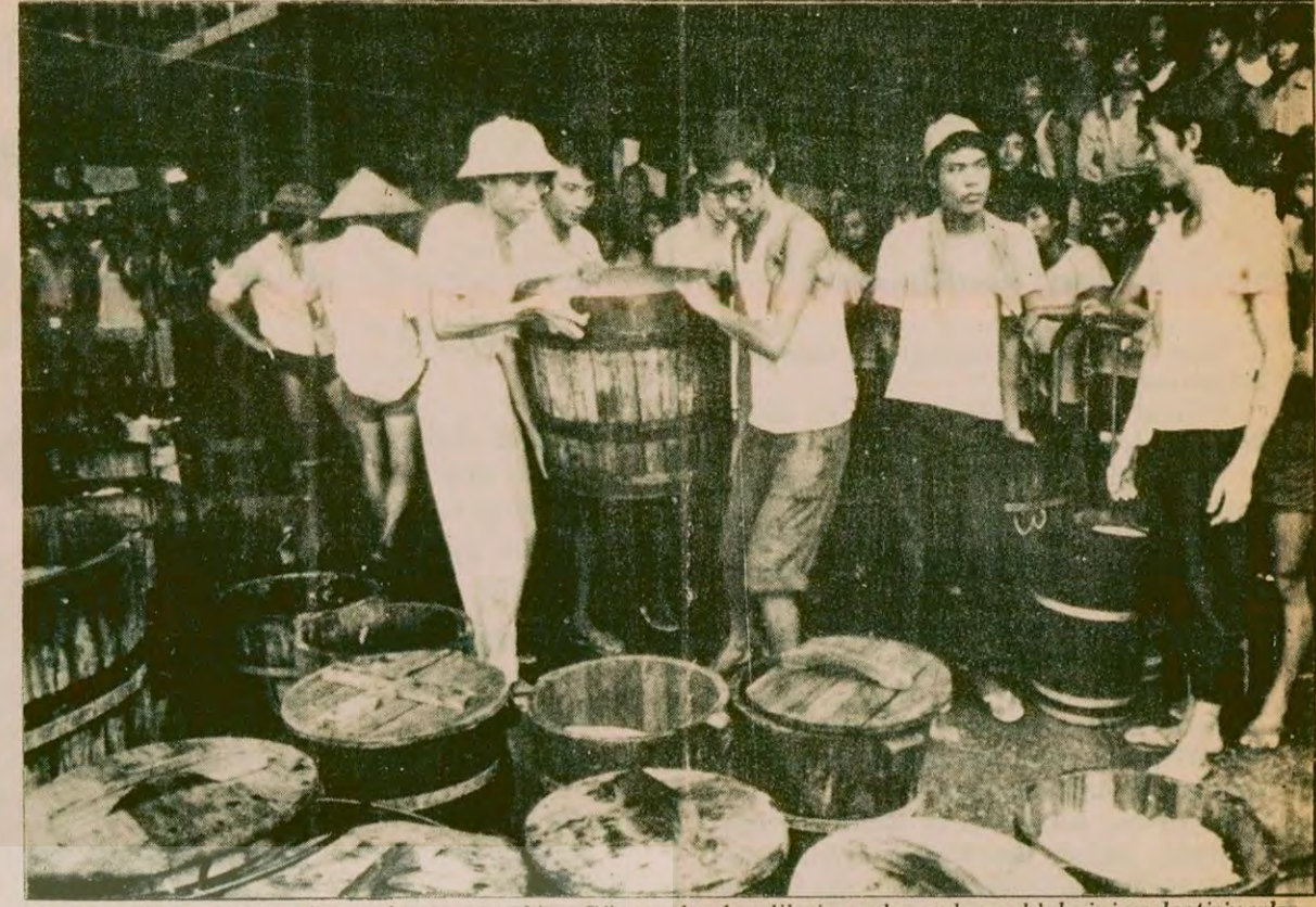
Vietnam'ın kuduğu göçmenler Hongkong'ta. Göçmenler kendilerine gelen gıda maddelerini yerleştiriyorlar

Şimdiye kadar Geçici Hükümeti tanıyan devletler Irak, Libya, Vietnam ve Panama'dır. Diplomatik kaynaklar, Venezuela, Kolombiya, ve Bolivya'nın da yeni hükümeti tanımak üzere hazırlık yaptıklarını bildirdiler.