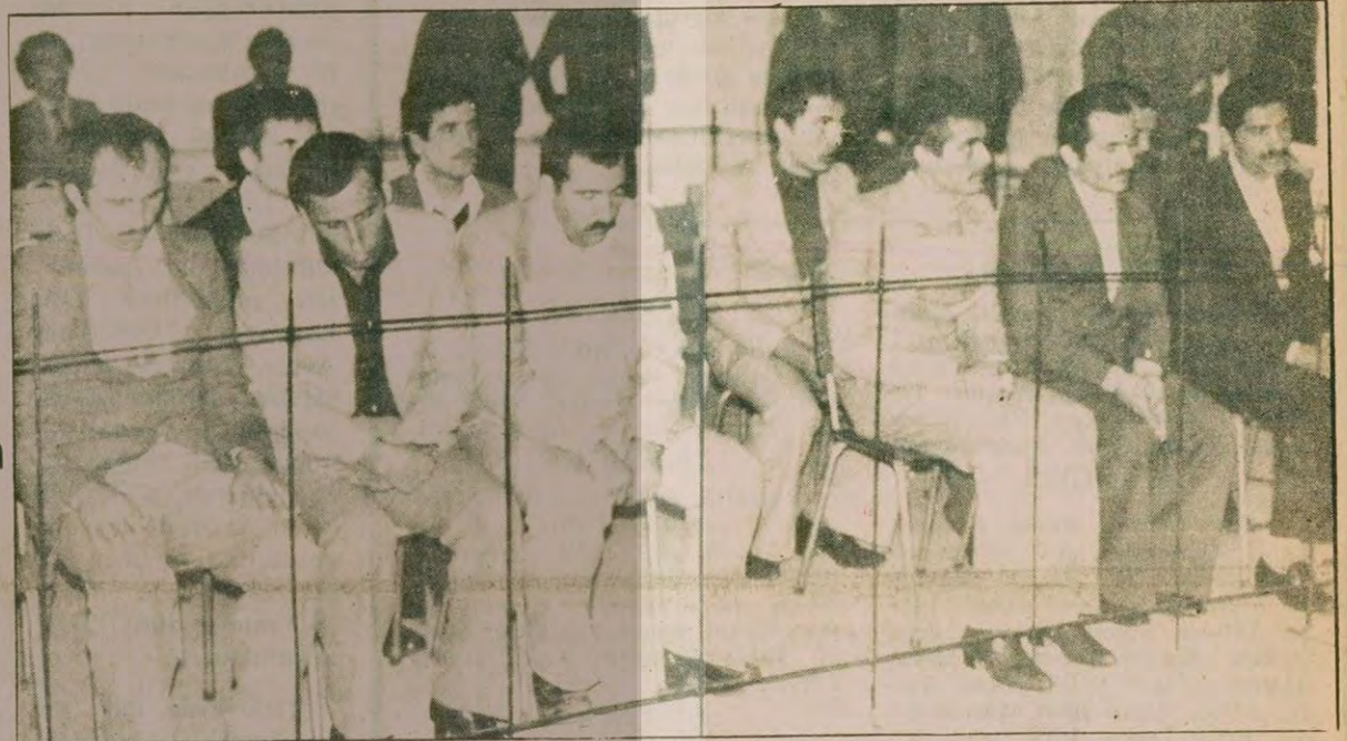
Bulgaristan'dan Türkiye'ye kaçak olarak sokulan 900 bin adet mermi ile ilgili davaya İstanbul Sıkıyönetim Mahkemesinde bakılıyor.

● Sıkıyönetim Mahkemesinde sanıklar 900 bin mermiyi Bulgaristan'ın Varna Limanından aldıklarını itiraf ettiler