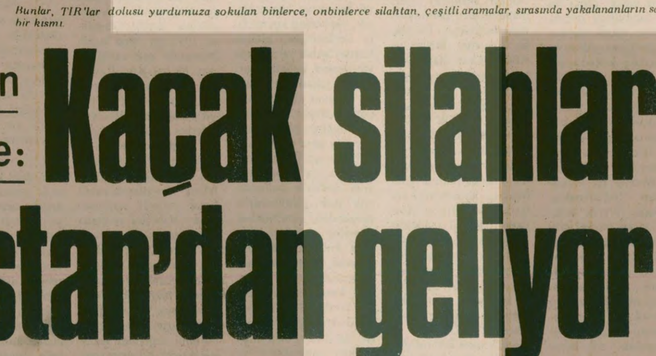
Bunlar, TIR'lar dolusu yurdumuza sokulan binlerce, onbinlerce silahtan, çeşitli aramalar, sırasında yakalananların sadece bir kısmı.

ANKARA (ÖZEL) Özellikle son birkaç yıldır Türkiye'ye sokulan kaçak silahların Bulgaristan'dan geldiği resmi belgelerle, diplomatik kaynaklar tarafından da doğrulanmaya başladı.