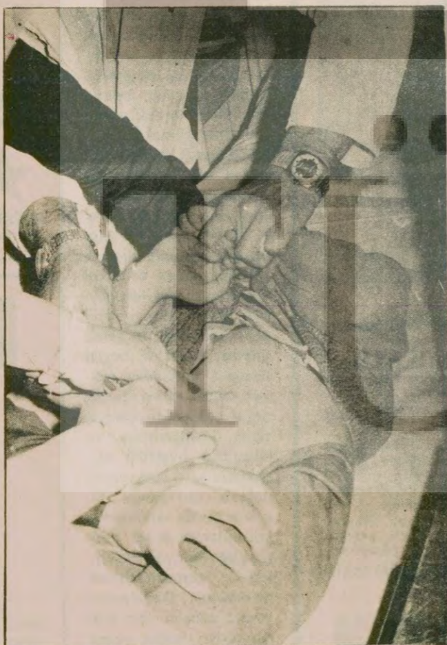
Hergün kundaktakinden, aksakallıyla 100'lerce kişi aştı ol- maya geliyor.