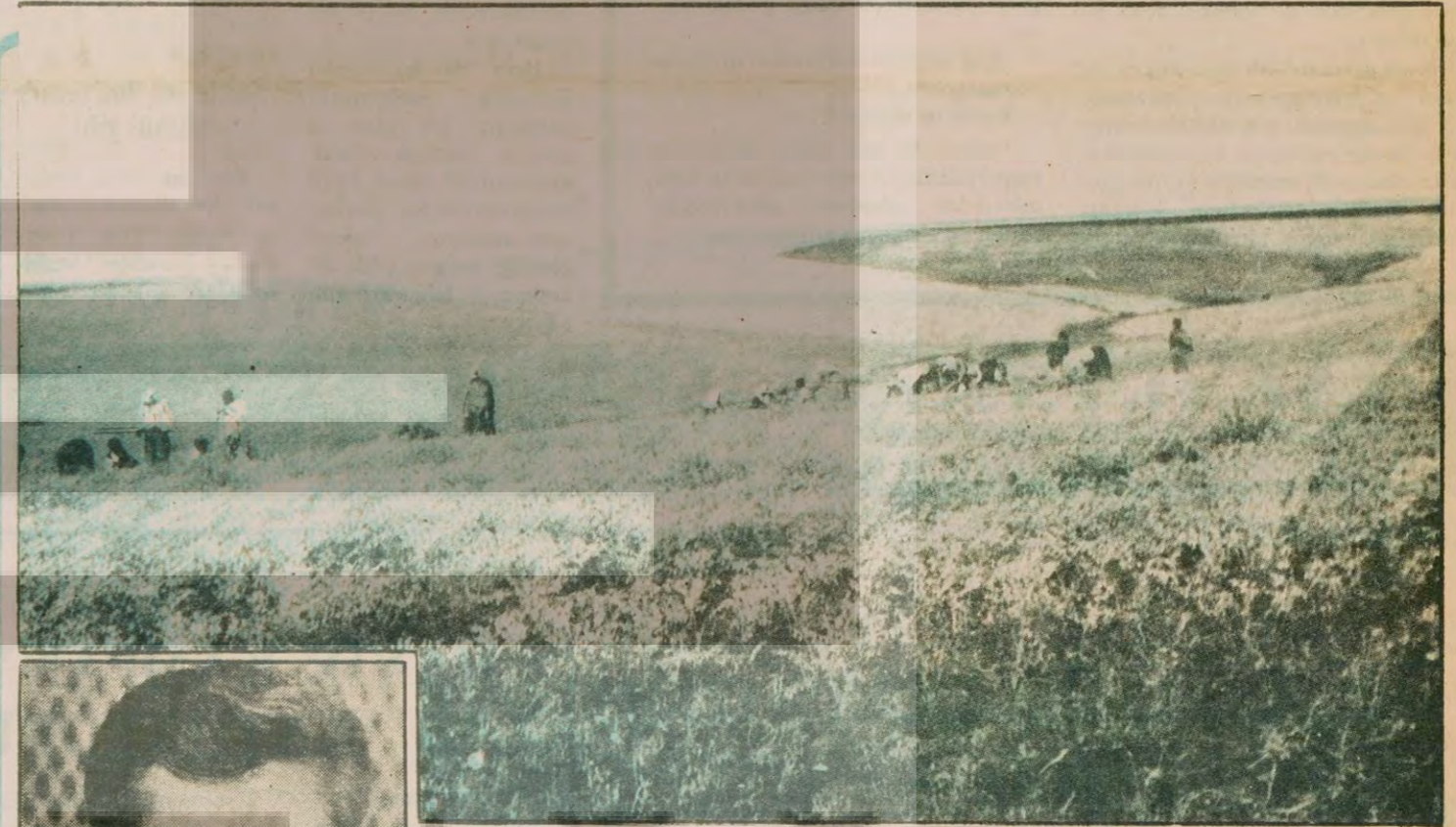
Ensarioğlu'nun soldaki fotoğrafı Millet Meclisi albümünden alınmıştır. Terkan ovasının Osmanlısı, tek sahibi Ensarioğlu için bakın ne deniliyor. Diyarbakır (doğum yeri) 1935 (doğum tarihi) - Orta (tahsili) Evli 5 çocuklu. Çiftçi. Tüccar... İşte burada durum: Koca Şeyh Ensarioğlu'nun şeyhliğinden kelime yok. Mesleği ise gayet mütevazı, Çiftçi-Tüccar olarak belirtilmiş.