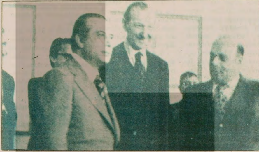
Denktaş ile Kıprıyanu 1978 yılında yapılan zirve toplantısında, Waldheim ile birlikte. Zirve toplantılarını Toplumlararası Görüşmeler izliyor. Kıbrıs'ta liderler her iki halkın barış talebini gözünde tutmak zorundalar.

● HER İKİ TARAF KENDİNİ YÖNETSİN FAKAT KIBRIS TEK BİR ÜLKE OLSUN'