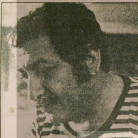
Fikret Otyam'ın "Dilimiz Türkçe" programında izleyeceğiz.

22.00 — TV'DE SINEMA: Yönetmenliğini Mauro Bolognini'nin yaptığı "Arabella" adlı 1968 yapımı filmde başrolleri Virna Lisi,