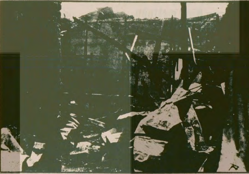
Elazığ'da geçen yıl çıkan olaylarda MHP'çiler 27 dükkanı tahrip ettiler ve yağmaladılar. Şehirde bir yanda MHP'çiler bir yanda sahte solcular Alevi-Sünni çatışmasını körüklediler. Yukarıdaki fotoğrafta Elazığ'daki olaylar sırasında MHP'çilerin tahrip ettiği bir dükkan görülüyor.

YARIN: Bir grup Apocu, arkadaşlarına işkence yaparken yakalandı