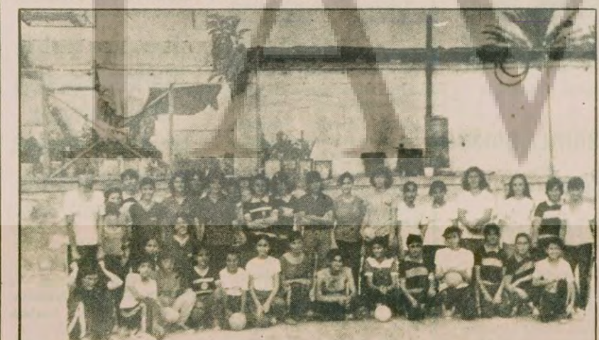
Yaz Hentbol Okulu çalışmalarını katılan hız sporcuları toplu halde.