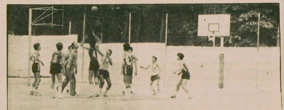
Turnuvaya çok sayıda minik basketbolcu katılıyor.