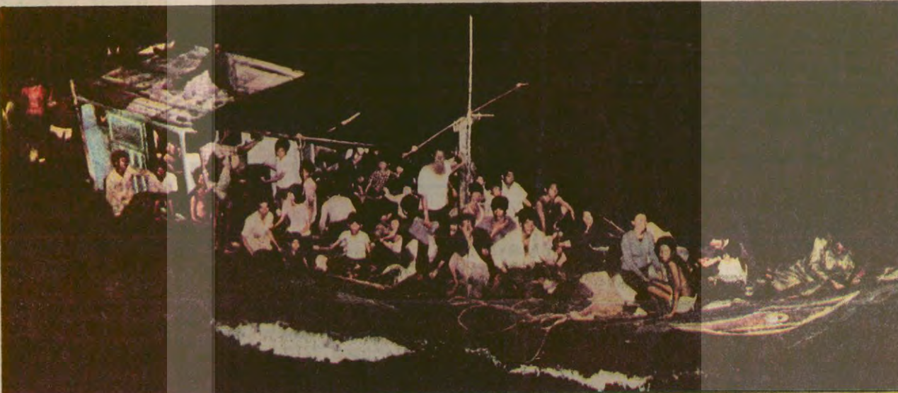
Vietnamlı göçmenler, sonu belirsiz bir kaçışa zorlanıyor. "Sosyalizmden kaçan burjuvalar olduğu" ileri sürülen bu göçmenler, ülkede sosyalizmin değil, baskı, işence ve açlığın olduğunu vurguluyorlar. Vietnamlı yöneticilerin Moskova ile işbirliği artırdıkça ülkede yolculuğun giderek daha da büyüdüğünü söylüyorlar.

ELAZIG (ÖZEL) Gazetemizde yayınlanan "DOĞUDA 15 GRUP" yayınıyla ilgili olarak Apocuların tehditleri sürüyor. Apocular Aydınlık satan seyyar gazetecilerine küfrederek satış engelleyeme ça- (Devamı Sa. 4 Sü. 7'de)