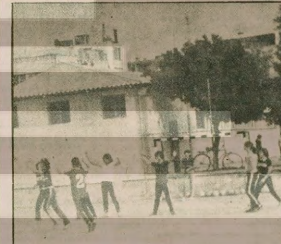
Hentbol Ajansı hentbolcuları çalıştırırken