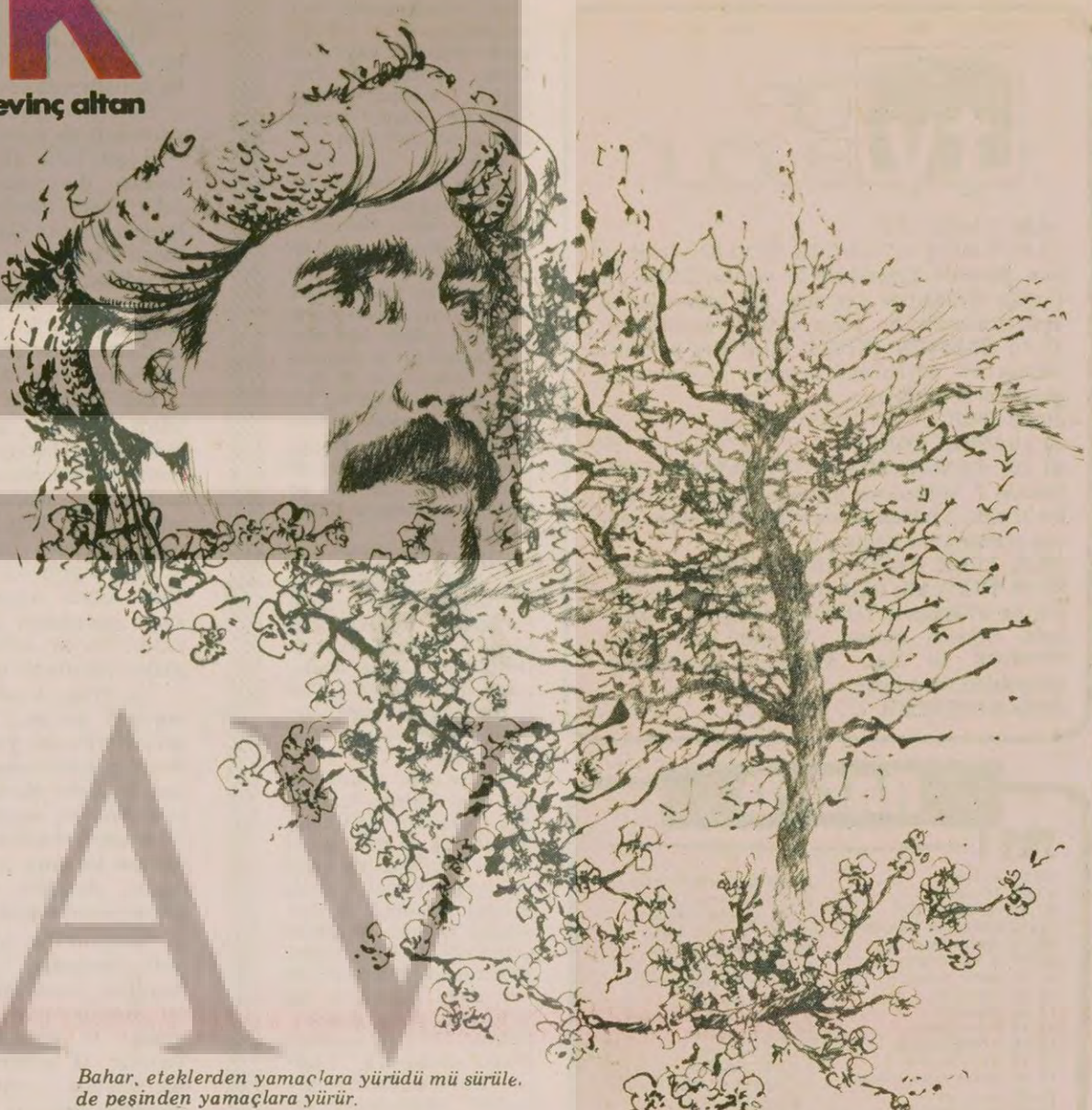
Bahar, eteklerden yamaçlara yürüdü mü sürüler, de peşinden yamaçlara yürür.