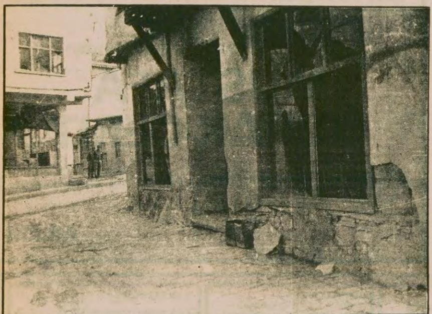
Tunceli'de son iki yıldır sahte solcu çeteler birçok olay yaratıyor. Halk bu olayların önlenmesi için aralarında birleşti. Komünistler kurdular. Olayların ve sorumluların üzerine gidilmesini karşıladıkları deltiler de ettirdi. Bu saldırılar sırasında birçok vatandaş yaralandı. Evler ve işyerleri talan edildi. Yukarıdaki fotoğrafta Tunceli'deki çatışmalar sırasında tahrip edilen bir kaline görülüyor.