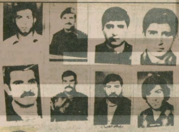
Suriye'nin resmi SANA haber ajansı Halep topçu okulu katliamına katılan 12 kişinin resimlerini bütün basına dağıttı. Halen aranan ve gıyaben idama mahkum edilenler arasında bir de Türk asıllı örgüt üyesi bulunuyor.

63 kişinin ölümü ile sonuçlanan olayın ardındaki esrar perdesi hâlâ tam olarak kaldırılmadı