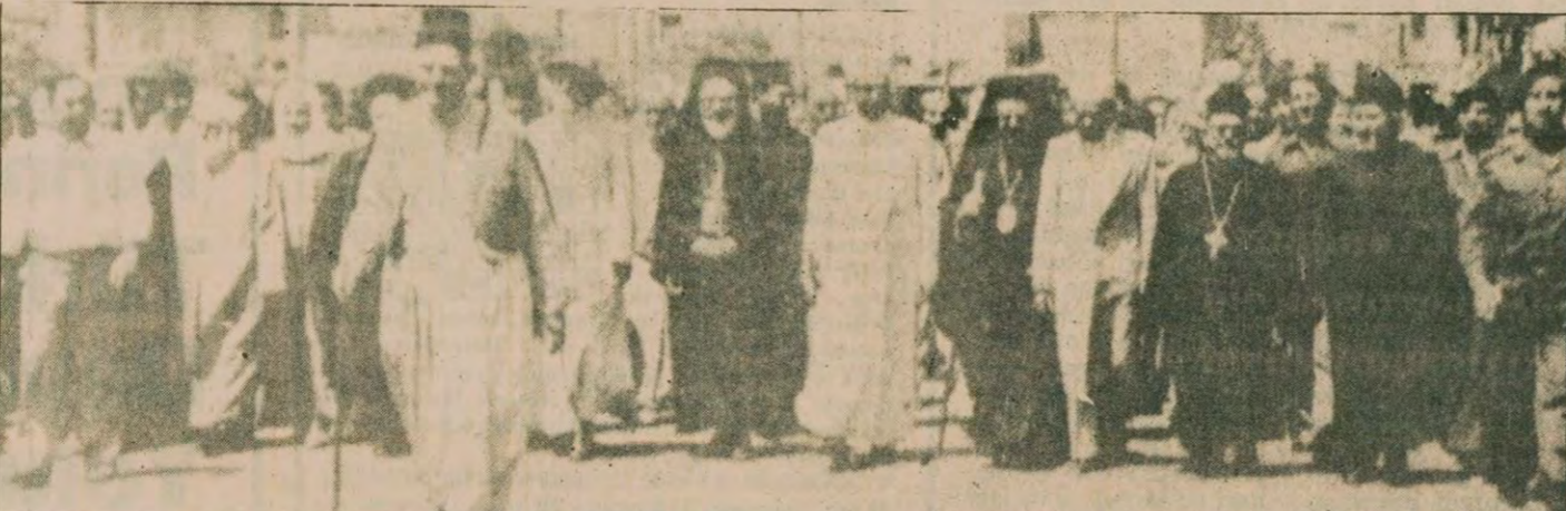
63 kişinin ölümü ile sonuçlanan Halep katliamı Suriye'de ve bütün Arap dünyasında nefretle karşılandı. "Müslüman Kardeşler" adlı cinayet şebekesinin lanetlendiği bir yürüyüşe Halep'in Müslüman ve Hristiyan topluluklarının liderleri ve binlerce insan katıldı.

Siyasi-dini bir teşkilat olan "Müslüman Kardeşler", 11 Nisan 1929 tarihinde Mısır'ın İsmailiye kentinde kuruldu. Örgütün 22 yaşındaki (Devamı sa.7, sü.9'da)