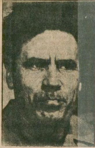
"Müslüman Kardeşlerin" sık sık öldüğü Libya Devlet Başkanı Albay Muammer Kaddafi