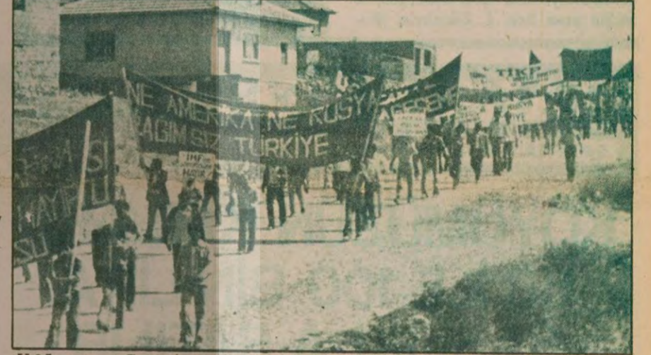
U-2'lere ve ve Rusya'ya teslimiyete karşı Anadolu'da yapılan ilk uzun yürüyüşte halkımızın bağımsızlığını gözünün bebeği gibi koruyacağı vurgulandı.

Gromiko, "ABD Senatosunda SALT-2 değiştirilmemeli" derken, Amerikan hükümeti Evren' in demeci hakkında açıklama istedi