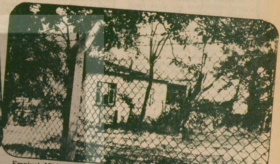
Emniyet Müdürü Yusuf Aksoy'un işgal ettiği 5 bin dönüm arazi üzerinde yaptırdığı yazlık ev.