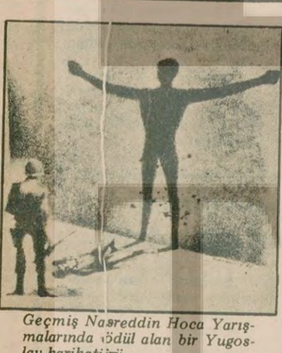
Geçmiş Nasreddin Hoca Yarışmalarında ödül alan bir Yugoslav karikatüristi.