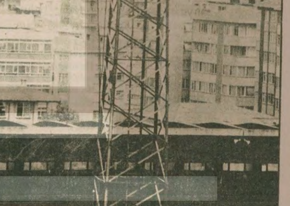
Stadın tamirat borcunu B.Terbiyesi Ödemeye hazırlanıyor.

Karşılıklı yapılacak bir görüşmede bir uyum ve anlaşma sağlanacağını umuyorum. Şu anda stadın bazı eksiklikleri bulunmaktadır. Teknik adamlarımız eksiklikler için 15 milyon lira civarında bir bütçenin gerekli olduğunu bildirdiler. Genel Müdürlük olarak bunu vermeye hazırız. Ali Sami Yen Stadının altı yıldır hizmete açılmaması nedeniyle bütün yüksek İnanç Stadına binmektedir. Artık bu sorun