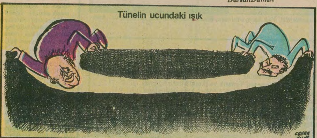
Tünelin ucundaki ışık

DÜZCE (ÖZEL) Karakollarda vatandaşlara görülen eziyetin iki örneğine Düzce ve Yığılca'da rastlandı. Bolu İlçesinde sun Duman adlı devrimci genç işkenceyle öldürüldü. Urfa'da bir işçi komaya sokuldu. Birkaç gün önce de, Urfa'da trafik polisleri memura işkence eden akl dengisini yitirince neden olmuşlardı. Urfa'da artan işkenceye Adalet ve İçişleri Bakanlığı'nın