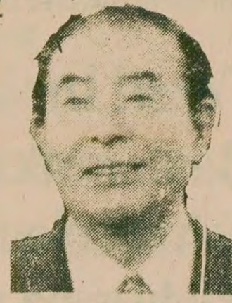
Japon Dışişleri Bakanı Sonoda

● Battambang civarında ve ülkenin batı kesiminde işgalci Vietnam askerleri yeni kayıplar verdiler