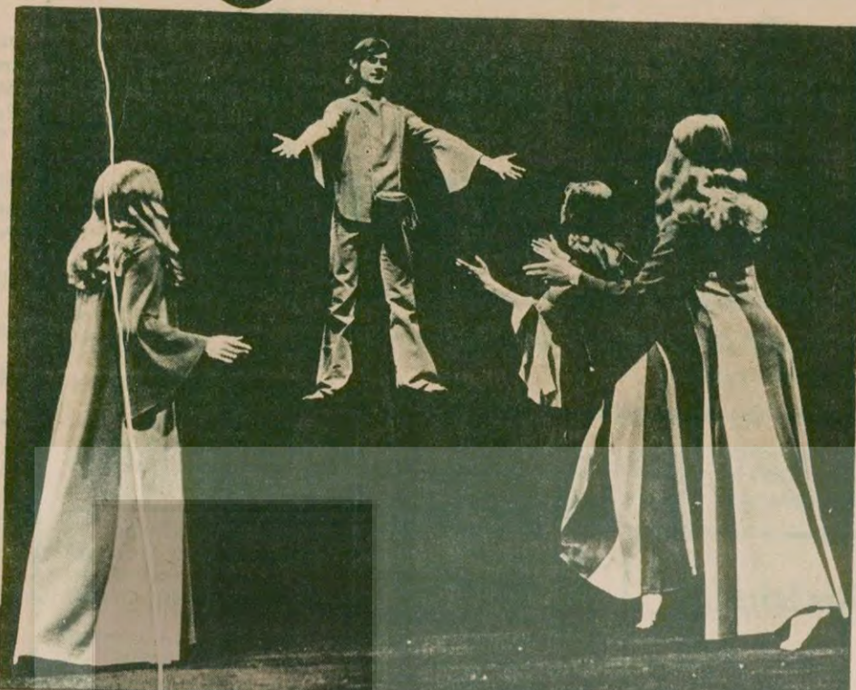
Belçika'nın Flandern Kralliyet Festivalinde iki ayrı program sunacak.