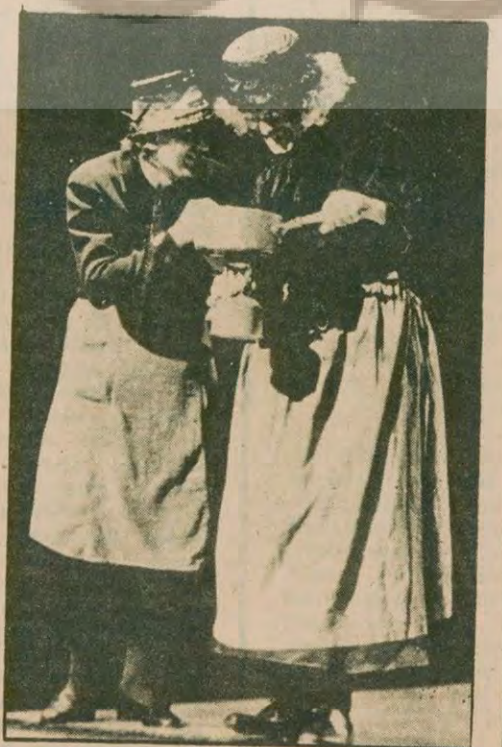
Akvaryum Topluluğunun sunacağı "Shakespeare'in Kızkardeşi" oyunu, son anda "Lipaja'ya Vapur'un yerine programa girdi."

İSTANBUL BELEDİYESİ KONSERVATUARİ ŞEHİR ARMONİ ORKESTRASI Yer: Gülhane Parkı. Saat: 17.00