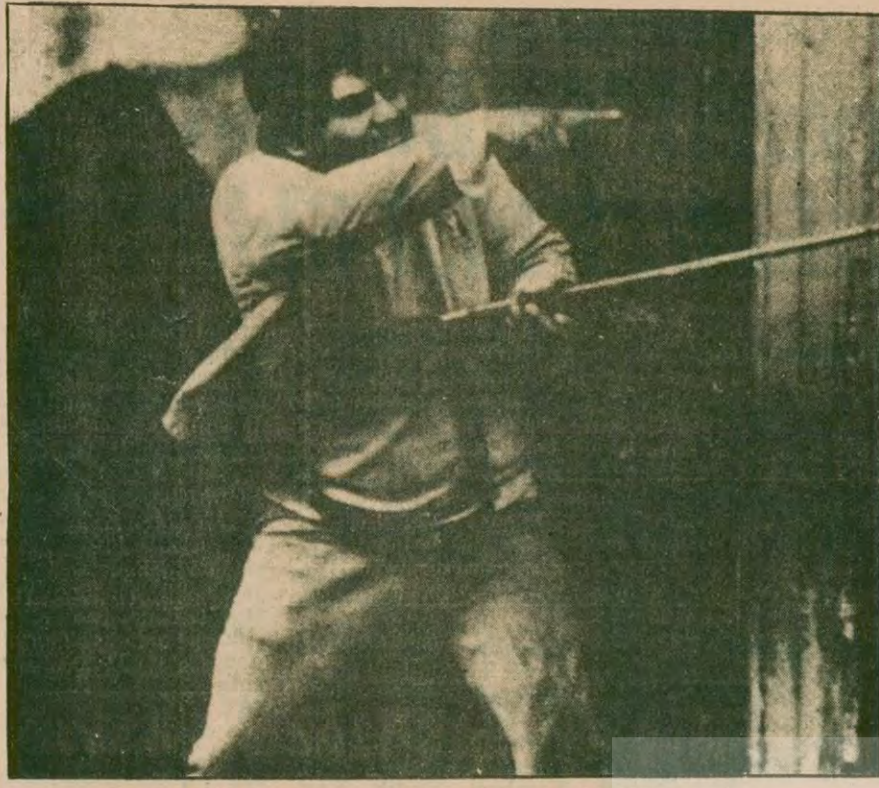
Somoza diktatörlüğüne karşı mücadele eden bir Nikaragualı...