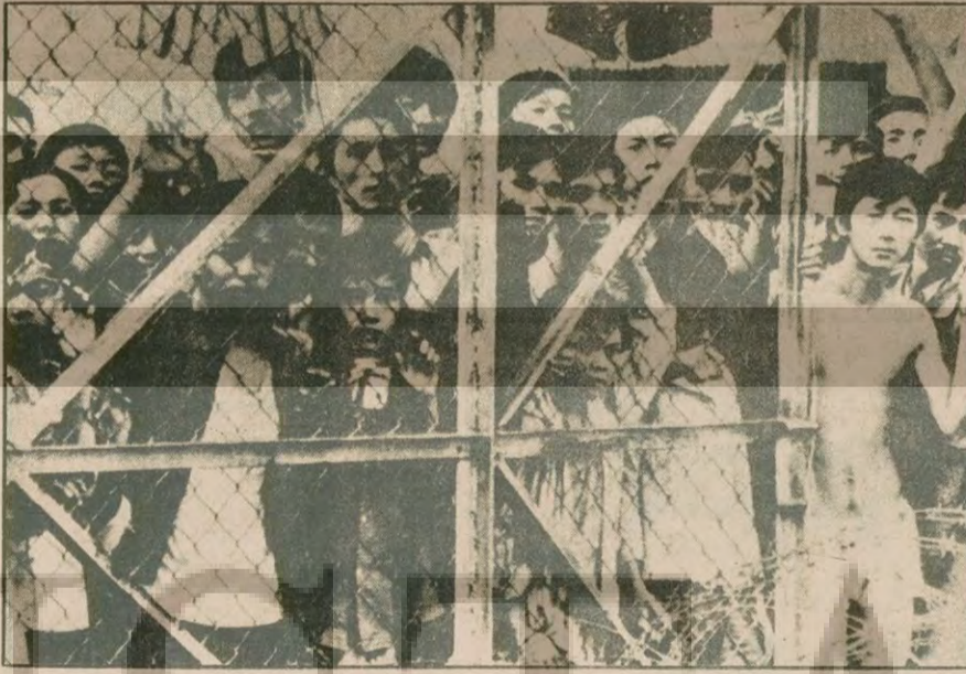
Vietnam yöneticilerinin baskısı sonucu ülkeden kaçmak zorunda kalan mülteciler...

Rusya'nın Karadeniz tersanelerinde inşa edilen, Montrö Sözleşmesini ihlal ederek 25 Şubat sabah boğazlarımızdan geçen MİNSK uçak gemisinin, Çin Denizinden geçerek Vietnam'a gideceğini ve Sovyetler'in Pasifik'teki donanmasına katılacağı tahmin edildiğini haber vermiştik (Aydınlık, 26 Ocak 1979)