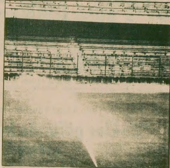
Amatör kulüpler saha sıkıntısı içindeyken, Beden Terbiyesinin koskoca stadı Ali Sami Yen Şu anda sadece Galatasaray'ın hizmetinde.