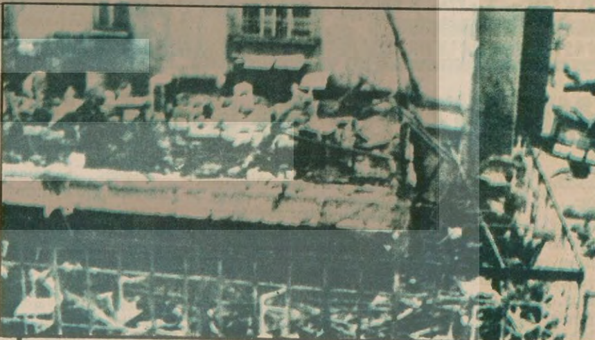
Cafe Mola meydana gelen patlamanın etkisiyle tamamen çöktü