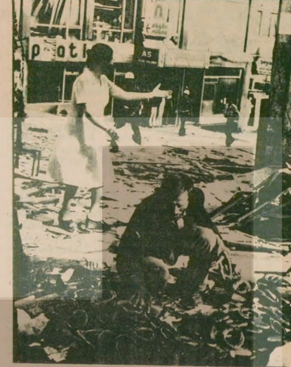
Patlayan bombanın etkisiyle herkes can derdinden sağa sola koşarken simitçi bir sermayesini yok etmek için kanlar ve döktükleri arasında dağılan simitlerini topluyor.

● Patlamada 10'u ağır 42 kişi yaralandı, Cafe Mola tamamen çöktü