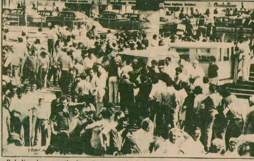
Belediye bazı semtlerde yağ satışına başladı. Kavurucu sıcağına rağmen halk, saatlerce 1 kilo yağ için kuyrukta beklemek zorunda kalıyor.