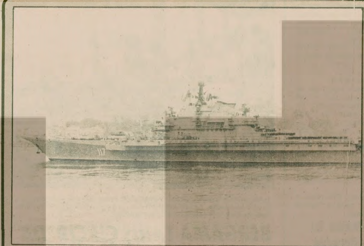
Minsk Boğazlarımızdan geçerken