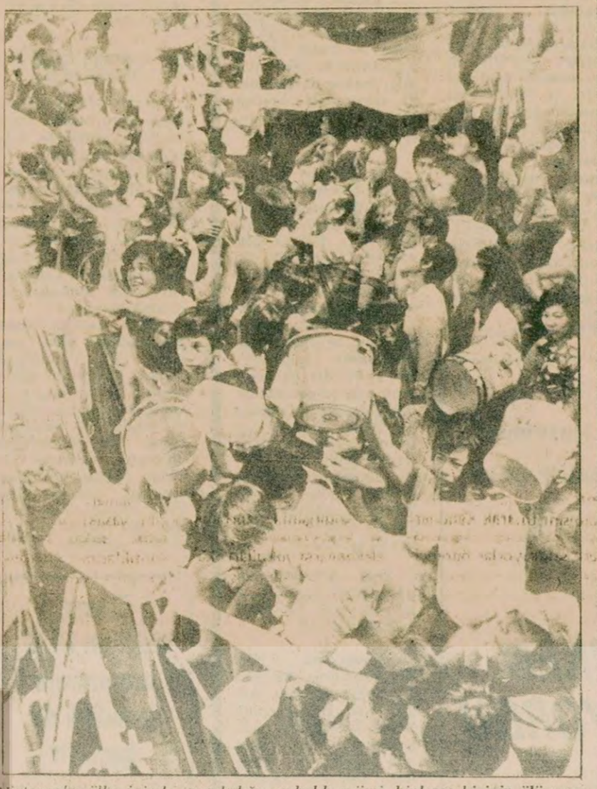
Vietnam'ın ülke içinde uyguladığı zorbalık rejimi, binlerce kişinin ölümüne sebep olarak, kaçmasına yol açtı.

Roma'daki Komünist Partisi bürosuna patlayıcı maddelerle bomba atıldı. Patlamada 20 kişi yaralandı. Komünistler, parti bürosunda bir parti toplantısı yapıldığı sırada kirli bir bomba patlayıcı maddelerle ve makneli tüfeklerle ateş açtılar.