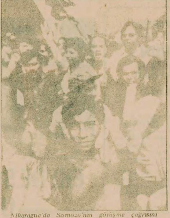
Nikaragua'da Somozo'nun görünme çağrısını reddeden mahalleler, cihannâslik yoluna hadar mücedele, süddürecğini açıkladı.