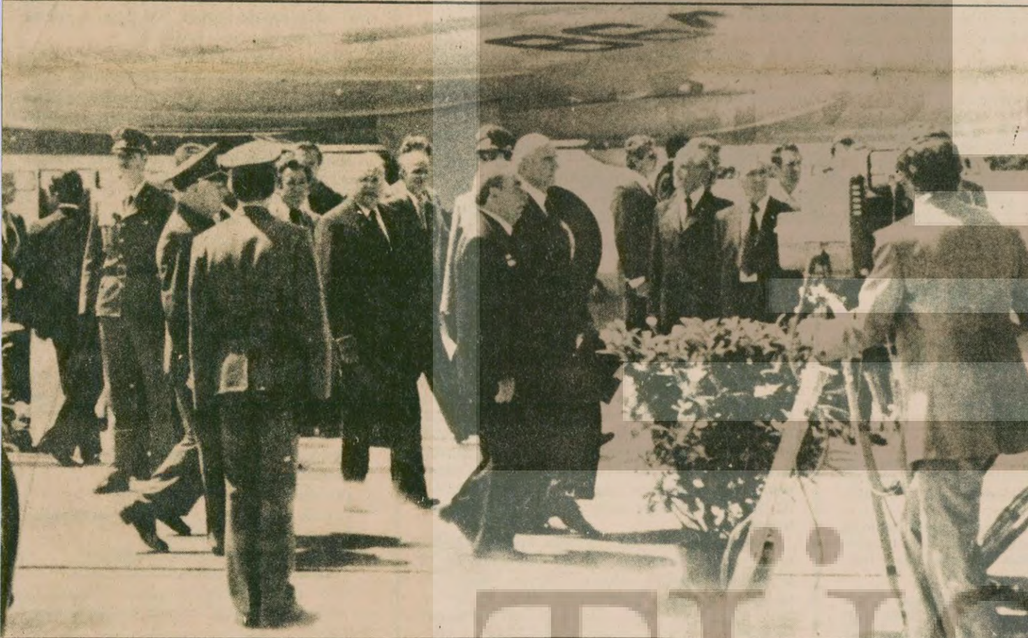
Brejnevin ilk kez Gromiko, Uştinov ve Brejnevin yerini alacağına kesin gözüyle bakılan Çernenko'dan oluşan böyle güçlü bir ekiple bir görüşmeye katılıyor. Bu durum Brejnevin iyice hasta olmasına bağlıdır.