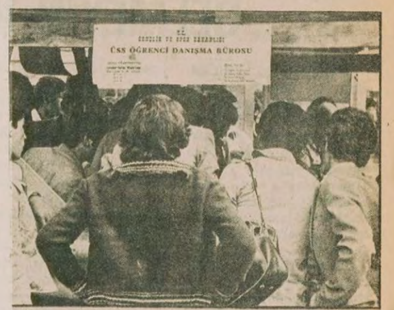
Üniversitelerarası seçme sınavına katılacak öğrenciler için danışma büroları kuruldu.