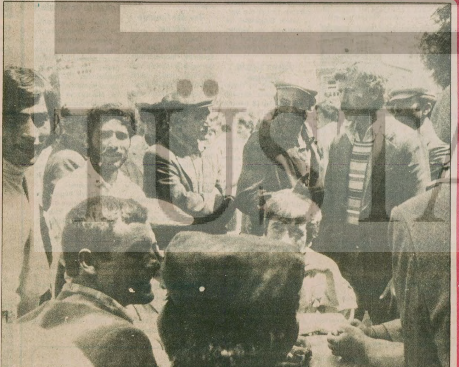
İŞÇİLER ÇAPALARI BIRAKTI "Asgari ücretle geçinilir mi bugün" diye soruyor işçiler, "milyonlar uçuran toprak beyleri bize 160 lira bile vermiyorlar".