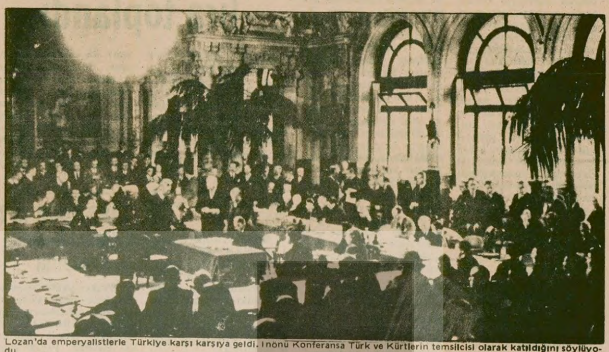
Lozan'da emperyalistlerle Türkiye karşı karşıya geldi. İnönü Konferansta Türk ve Kürtlerin temsilcisi olarak katıldığını söylüyor.

Musul'da İngilizlerin büyük çıkarları vardı. Bu yüzden Lozan Konferansında Kürtler bir kere daha emperyalistlerle Türkiye arasında tartışma konusu oldu