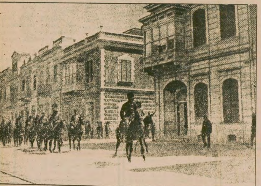
İzmir'in kurtuluşu ile bağımsızlık savaşı noktalanıyordu.

"Türkiye'de Müslüman azınlık yoktur. Çünkü kuramsal olduğu gibi uygulamada da Müslüman unsurlar arasında hiç bir ayırım gözetilmemektedir"