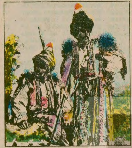
BAŞBAKAN RAUF ORBAY: